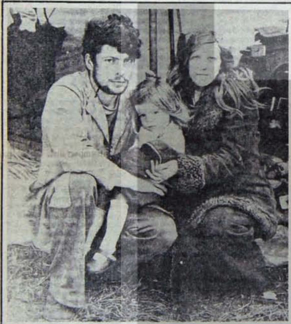
Onbinlerce işsiz İngiliz ailelerinden biri