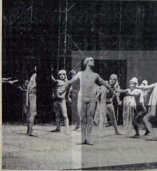
"Ferhat ile Şirin"

Bilgiç'in marifetleri elbet bu kadarla bitmeyecek ve tüm merak kesimine layık görülmesek, kıyım ve zulüm Devlet Tiyatroları çalışanlarını da hedef almaktadır. Bu nedenle sorun hiç bir zaman "Genel Müdür Ergin Orbey'in görevden alınıp alınmaması" sorunu değildir. Ne Devlet Tiyatroları çalışanları, ne de tepki gösteren diğer kurum ve kişiler kendilerini bu sınıra hapsedememlidirler.