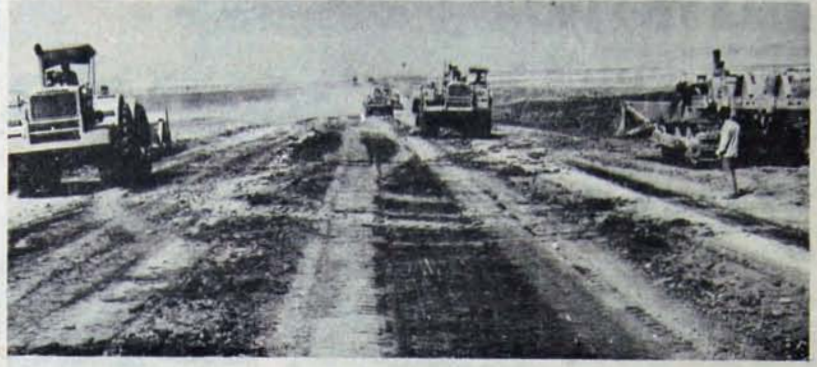
YSE işçileri Karayığıt'in "MİSK"leştirme" planına direniyor

Yasalara ve son mahkeme kararına rağmen Karayığıt YSE işçilerine saldırıya daha da artırdı. 30 Kasım 1979 gün ve 1929 sayılı bir genelgeyle YSE Genel Müdürlüğü'nün tüm işyerlerinde göndererek Köy YSE-İŞ ile imzaladığı sözleşmenin gereğinin yapılmasını emretmekteydi. İşin ilginç yanı genelgenin Ankara'daki bölge işyerlerine gönderilen nüshalarına bir not düşülerek "mahkemenin tedbir kararına verdiği, ikinci bir emrin beklenmesi" önerilmektedir. Ankara dışındaki bölge müdürlüklerine gönderilen aynı genelgede ise bu nota bilinçli olarak yer verilmiş, imzalanan korsan sözleşme-