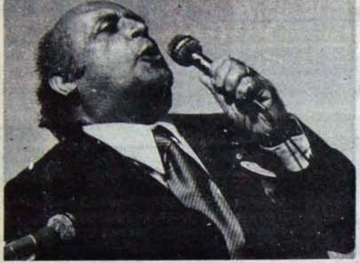
AP hükümetini iğbâna getiren emperyalizm ve tekel, ivedi bir devalüasyonu zorluyor

Türkiye'de bulunan Uluslararası Para Fonu heyetiyle görüşmeler sürüyor. Süreyor da, pazarlığın sonuna gelinmiyor bir türlü. Sızan haberlere göre, kur ayarlaması, KİT zamları ve yatırım programında kısıtı için baskısını yoğunlaştıran heyet üslubunu da sertleştirmiştir. Deneyimli Fon uzmanlarının, 'sorunlara iyi niyetli yaklaşım', 'Hükümetin yeni kurulması nedeniyle başvurulacak önlemlerin zaman ve içerik yönünden somutlaştırılmaması' türünden mazeretlere verdiği yanıtın "o halde görüşecek bir şey yok. Biz gidelim" şeklinde olduğu belirtilmektedir. Demirel'in evindeki hesap, çarşıya uymamıştır.