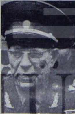
SSCB Savunma Bakanı D. Ustinov

Sovyetler Birliği'nin silahsızlanma alanındaki gelişimine karşı, NATO'nun Batı Avrupa'ya yerleştirmeyi düşündüğü nükleer başlıklı orta menzilli Pershing II füzeleri konusu ise karar aşamasına ulaştı. NATO Bakanlar Konseyi bu konuyu karara bağlayacak.