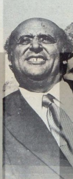
Polis devleti yolunda

alma çabaları IMF ve NATO gibi kuruluşların Türkiye'den beklentileriyle de tam bir uyum gösteriyor. Emperyalist dünyada tekeli devlet kapitalizminin kuruluşlarının en önemli olanlarından Bildenberg Grubu'nun yaptığı son toplantıda, Türkiye'nin bölgede Batı için en güvenilir mütefek olduğu vurgulandı. Batı'nın Türkiye'den hiçbir yardımcı esirgememesi gerektiği belirtilen Bildenberg Toplantısı'nda, emperyalist dünyanın en önde gelen temsilcileri, "Başta Amerika olmak üzere, Türkiye'nin ihtiyacı olan ekonomik yardım ve silah ihtiyaçları karşılmalıdır. Yardım elini uzatmalıyız. Türkiye'ye bir şey olduğu takdirde Batı yerinden oynar" görüşlerini savundular!