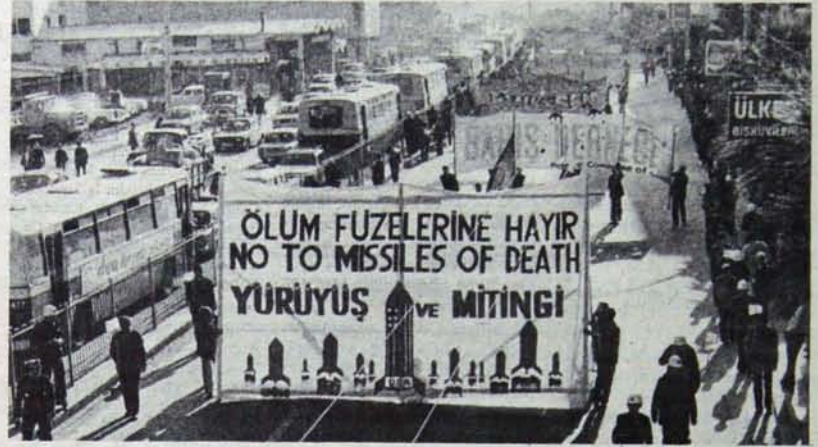
ESKİŞEHİR'DE BARIŞ GÜÇLERİ EYLEM BİRLİĞİNİ SOMUTLADI

Eylemin ele alınış tarzında olumluluk, ilkelere sonuna kadar uyulması ve bütün bunların zoraki değil de istenerek yapıl- ması eylemin kendisini de olum- lu yönde etkiledi. Gerici faşist güçlerin artan baskı ve tehditleri karşısında 24 Kasım eylemi, ko- runması ve geliştirilmesi gereken bir adım olarak demokratik güç- lerin görevleri arasında yerini al- dı.