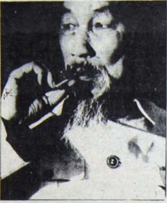
Ho Şi Minh ve Georgi Dimitrov: Uluslararası bilimsel sosyalist gençlik hareketi eşiz öğretmenlerin yolunda ilerliyor