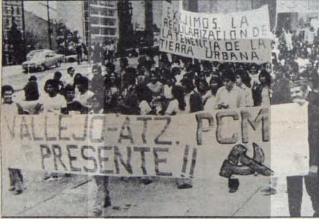
Meksika Komünist Partisi yığınların devrimci savaşına önderlik ediyor

Büyük Britanya Komünist Partisi Kongresinin Ana Belge ve diğer kararlarında ülkedeki bunalım ve antidemokratik hükümet girişimlerine dikkat çekilerek, bunlara karşı amansız bir mücadelenin sürdürüleceği kaydedildi. Bu arada, güçlüklerin aşılması ve ülkede gericiğin ve antidemokratik girişimlerin yenilgiye uğratılması için gerekli olan en önemli önkoşulun, tüm ilerici, demokrat, sosyalist ve komünist güçlerin birlik içinde mücadele etmeleri olduğu vurgulandı. Kongrede ayrıca tüm Britanyalı komünistlerin, birlik ve disiplinli bir güç oluşturulması gereğinin bilincinde oldukları ve bunun için çabaladıkları belirtildi.