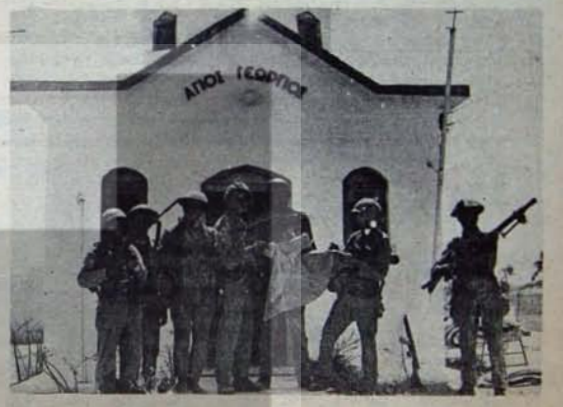
BM Kararları: Kıbrıs'ta barışın genel çerçevesi

BM Genel Kurulu'nun benimsediği karar tasarısı, Kıbrıs'tan tüm yabancı askerlerin çekilmesi zorunluluğunu bir kere daha vurguluyor; öte yandan BM'nin daha önceki kararlarının uygulanmasını sağlamak üzere Güvenlik Konseyi'nin bir "takvim" hazırlamasını