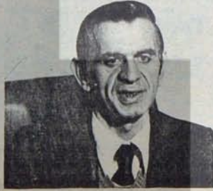
G. Cazioglu: TÖB-DER yöneticileri ser- best bırakılmalı.

TMMOB ve Birliğe bağlı odalar da hükümet programını eleştirerek, bu programın TİSK'ın, TUSİAD'ın, İşbir-