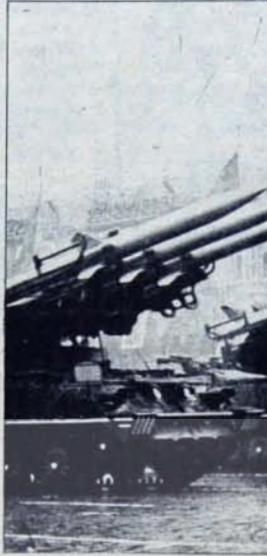
Belçika ve Hollanda topraklarında nükleer başlıklı birkaç yüz süper modern roketin bulunmasını kitudaki stratejik durumu NATO yanına değiştirebileceği ortadadır. sosyalist ülkelerin buna kayıtsız kalmalarının olanaklı olduğu ve karşı önlemler alınması zorunda kalacakları da çok normaldir.

Bu, öncelikle Avrupa'da silahlanma yarışının yeniden kızdırılması olacaktır. Aşında İngiltere, Federal Almanya, İtalya,