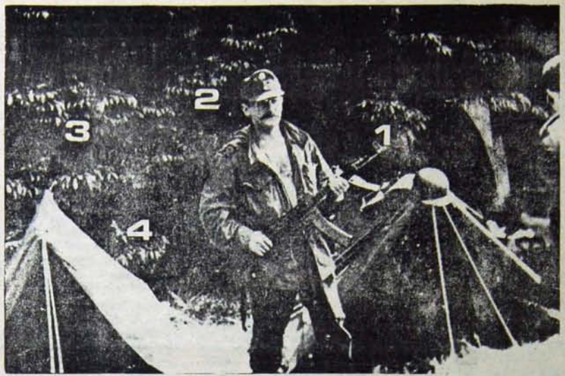
Belçika Flaman bölgesinin faşist örgütü VMO'ya mensup komandoların Ardennes Dağları'nda kurduğu üniformalı-silahlı eğitim kampı

VMO örgütünün Ardennes Dağları'nda yaptıkları silahlı eği-timlerin fotoğrafları ve belgeleri solcu Pour Dergisi'nde açıklan-mış, komandoların nerelere bas-tıkları yaptıkları, hangi olayları çı-kardıkları, tarih tarih, saat saat