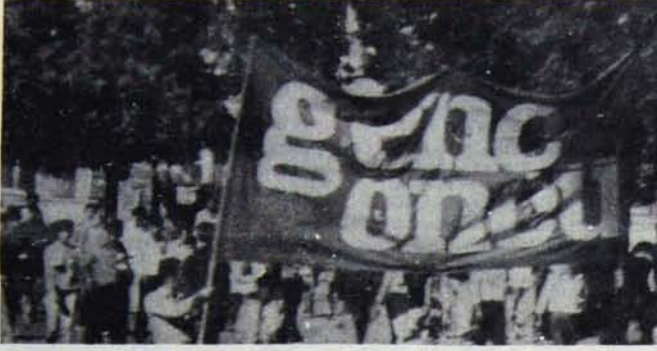
Genç Öncüler dünya gençlik ve öğrenci haftasını anıtfaşist bir kampanyaya dönüştürdüler. Altta Genç Öncüler gençlik hareketinin hedeflerini selamlıyor...