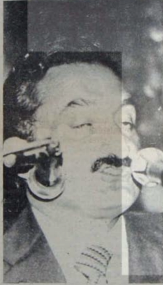
CHP-AP işbirliğine ilk adımlar

Ama bu demek değildir ki, dünya görüşünü 'demokratik sol' olarak ilan eden tarihsel partinin toplum önündeki bütün sorumlulukları da sona ermiştir."