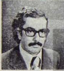
CTP Genel Başkanı Özker Özgür

Kıbrıs'da 21 Ekim Pazar günü Cumhuriyetçi Türk Partisi'nin Olağanüstü 5. Kurultayı toplandı. CTP Merkez Yönetim Kurulu, Kıbrıs Türk işçi ve emekçilerinin günden güne yükselen ekonomik, demokratik, politik mücadelesinin gereklerini yerine getirebilecek ve yığınsallaşan CTP'nin omuzlarına yüklenen geniş görev ve sorumlulukları üstlenebilecek, partinin politik yaşamındaki işlevini daha etkin bir biçimde yerine getirebilecek yeni bir merkez kadrosu oluşturmak amacıyla olağanüstü kurultaya gitme kararını almıştı.