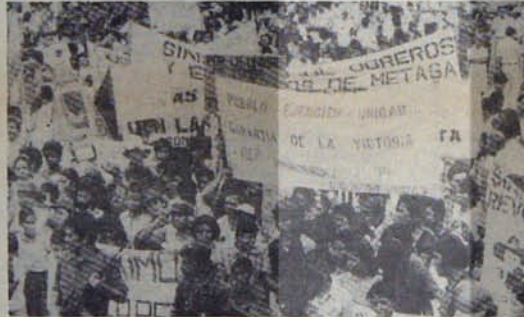
Nikaragua halkı devrim yolunda kararlı ilerliyor

Bununla birlikte Ulusal Yeniden Kurtuluş Hükümeti, sadece ulusal onurunu zedelemeyecek yardımları kabul edeceğini açıkladı. Bu arada Latin Amerika Ekonomi Örgütü SELA önümüzdeki yıl içinde 2,5 milyar dolarlık bir kredi açma sözü verdi. Kostarika ve diğer Latin Amerika devletleriyle, Petrol İhraç eden Ülkeler Örgütü acil krediler sundular. Nikaragua'da sosyalist ülkelerden, başta Küba, Sovyetler Birliği ve ADC'den gönderilen dayanışma yardımları sükrarla karşılanıyor ve bu doğrultuda karşıllık çıkara ve eşitliğe dayalı ekonomik ilişkilerin gelişmesi için büyük olanaklar görünüyor.