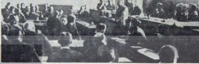
Sovyet delegesi Litvinov 1934'de Milletler Cemiyeti'nde barışçı önerilerini açıklıyor...

Bununla birlikte, SSCB'nin girişiminden hoşlan-