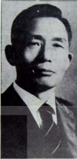
Emperyalizmin dikeniz gül bahçesi, yeni komploların da sahnesi oluyor...

İkinci Dünya Savaşı sonunda Japon emperyalizminin yenilgiye uğraması, Japon ordularının püskürtülen Sovyet ordularının Kore'li partizanlara sağladığı destek, Kore halkının bağımsızlığına kavuşması, kendi geleceğini kendisinin belirlemesi olanaklarını hazırlamıştı. Ama Japonya'nın teslim olması ile Güney Kore'ye asker yağın ABD, Kore'nin bağımsızlığına kavuşmasına karşı çıktı. ABD savaş sırasında Kahire ve Potsdam kararlarına rağmen Kore'de yabancı himayesi altında bağımsızlık öncesi on yıla kadar uzanabilecek bir geçiş dönemi örgüleyordu. ABD planına göre Kore, ABD, Sovyetler Birliği, İngiltere ve Kuumintang Çin'inin dörtlü yönetimine bırakılacaktı. Sovyetler Birliği'nin karşı önerisi ise, Kore halkının temsilcilerinin kendi aralarında düzenleyecekleri seçimlerle Kore'nin tek ve bağımsız bir ülke haline getirilmesiydi. Kore'de mevcut Sovyet ve ABD askerî güçlerinin bu düzenlemeye yardımcı olmanın başka işlevleri olamazdı. Ancak Kore'nin demokratik güçlerini tasfiye ederek Kore'yi Amerikan tekelinin eline bırakmak isteyen ABD Kore'den askerî güçlerini çekmeyi reddetti. Güney Kore'de, 10 Mayıs 1948'de uzun yıllardan beri ABD'de yaşayan Syngman Rhee başkanlığında bir hükümet kurdurttu. Eylül ayında ise Kuzey ve Güney Kore'nin tüm politik partileri ve diğer örgütlerinin ortak düzenlediği seçimlerle oluşan Ulusal Meclis, Kore Demokratik İlaik Cumhuriyeti'nin kurulduğunu ilan etti. 1948 yılı sonunda Ko-