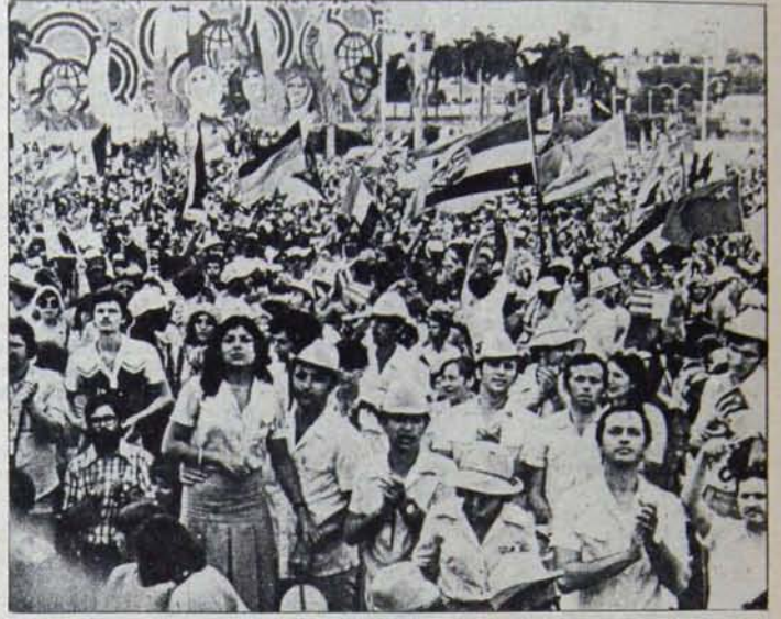
İlerici Türkiye gençliği dünya gençlik hareketiyle dayanışmasını yükseltecek

Dünya gençliği 10-17 Kasım tarihlerinde faşizme, emperyalizme, her türlü gericiliğe, ırkçılığa ve ayrımcılığa karşı, silahsızlanmadan, barıştan ve sömürsüz bir dünyadan yana mücadelesini yükseltiyor. Bugünlerde, gençliğin yaşamsal siyasal ve ekonomik talepleri daha gür haykırılıyor, bu hedefler uğruna geniş gençlik yığınlarının döğüşkenliği artıyor, daha geniş gençlik kesimleri bu ta-