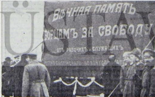
Petrograd: Devrim için ölenlere son saygı

Marksizm hiçbir zaman mücadele biçimlerini "keşfetmez" yada uydurma biçimde bulup çıkarmaz, ama onları genelleştirir, örgütler ve devrimci sınıflar tarafından hareket boyunca ortaya çıkartılarak yürütülmekte olan mücadele biçimlerine bilinç katar. Marksizm tarihsel bir yaklaşım gerektirir. Ekonomik evrimin (politik, ulusal, kültürel, somut ve diğer koşullara bağlı olarak) çeşitli aşamalarında farklı mücadele biçimleri ortaya çıkar ve öne geçer. Ve bu da kendi payına ikincil, türevsel biçimleri de içerir. Marksist-Leninist teori olanaklı olan tüm mücadele biçimlerinin kullanılmasını ve ana stratejik görevin çözümünde en fazla katkısı olanların seçilmesini gerektirir.