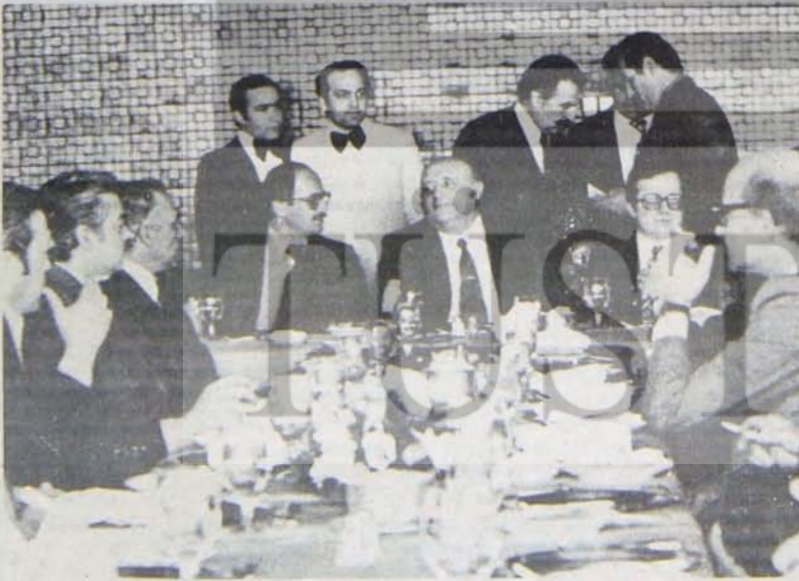
Demirel azınlık hükümetiyle tekeli burjuvazinin sorunlarını nasıl çözecek?