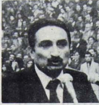
ından, Türkiye, belki de kurtuluş olacaktır.."

"Adalet Partisi bu deneyimi üstlenirse ve başarılı olsun olmasın - günlük olaylar karşısında ivedi hararla alabileceği, yürütme erkine tanınan yetki alanında kendi programına göre tutarlı davranabilecek bir azınlık hükümeti kurarsa, ülkemizde sağlıklı bir demokratik gelenek yerleşmeye başlamış ve sayısal zorlukların bundan böyle hükümet sorununa ve bunalımına yol açma-