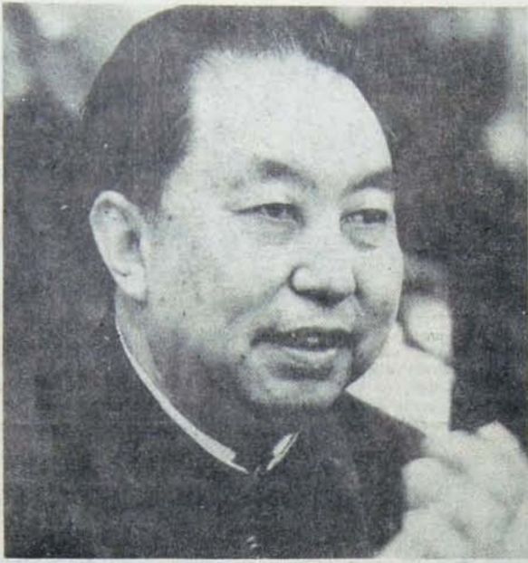
Hua Kua Feng: NATO'nun savaşçı çevrelerinin kucağında

Paris'te onbinlerce Fransız ve göçmen işçinin katıldığı mitingin en ön safında CFDT Genel Sekreteri Georges Seguy'da diğer örgüt yöneticileri, ayrıca Fas, Cezayir gibi ülkelerin sendika temsilcileriyle Afrika Sendikalar Birliği'ni temsil eden bir yönetici yürüdü. İşçi sınıfının yığılmal örgütleri tarafından düzenlenen eylem eylemler, ülkedeki göçmen işçilerle hedef alan ırkçı nitelikli Barre-Bonne ve Boullin-Stoleru yasalarının senatodaki oylanması sırasında önemli değişikliklerin gerçekleşmesini dayattı.