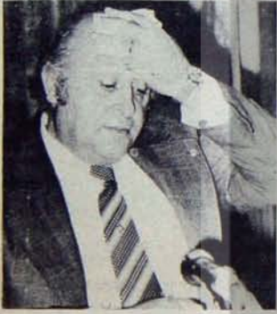
"Liberal" etiketli baskıcı bir yönetimle "fevkalade hal'i nasıl normalleştireceğini düşünüyor!..

Cumhurbaşkanı'nın 29 Ekim mesajını ortaya koyduğu bu yönleri, "geniş tabanlı" hükümet formülleriyle Türkiye'ye dayatılmak istenen iktidar biçimlerinin bir göstergesi olarak değerlendirilmelidir. Bu yöndeki dayatmaları etkisizleştirmenin yolu, tüm demokratik güçlerin etkin ve kitlesel iş ve eylem birliğinden geçmektedir.