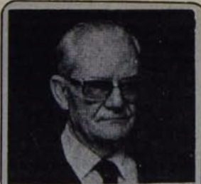
BREZİLYA'DA GEISEL'İN BAŞINI ÇEKTİĞİ FAŞİST DİKTATÖRLÜĞÜN TEMELLERİNİ SARSAN KİTLE EYLEMLERİ, BU YILIN 1 MAYIS'INDA SAO PAULO' NUN ENDÜSTRİ BÖLGESİNDE 100 BİN KİŞİNİN TOPLANMASIYLA DORUK NOKTASINA ULAŞTI.

BKP MK kararında, geçen yıldan bu güne ülkede işçi sınıfının müca-