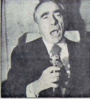
Demokratik güçler, faşist partinin kitleler arasında daha da meşrulaşma girişimlerine asla izin vermeyeceklerdir...

Ara seçimlerin yapıldığı 29 ilde MHP'nin oy oranı yüzde 5.2'den 6.7'ye; seçmen oranı (her yüz seçmenden toplayabildiği oy miktarı) ise 3.8'den 4.5'e yükseldi. Seçimlerin yapıldığı 9 ilde MHP'nin seçmen oranının düştüğü, ancak 9 ilde ise 1 puanın üzerinde artış gösterebildiği görüldü. Ağrı, Amasya, Antalya, Artvin, Edirne, Konya, Manisa, Rize ve Van, MHP'nin oy ve seçmen oranlarının düştüğü iller oldu.