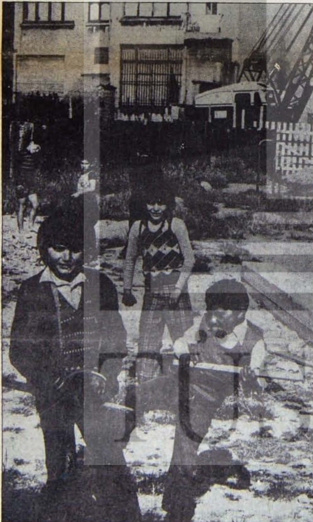
Avrupa'nın başkenti Brüksel'in Türk gettolerında sahipsiz, eğitimsiz, bakımsız yalnızlığa terk edilmiş Türkiye'li çocuklar...

"Döviz çekmek söz konusu olunca işçiyi 'muhterem vatandaş' ilan eden Türk Hükümeti, Türk Elçiliği, aynı vatanşahsahipsiz açlık ve sefaletle terk edilirken sizler neredesiniz?"