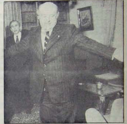
Demirel: Erken seçim için...

Bu sonuçlar, AP'nin, 1973'ten bu yana gericilik ve faşizm güçleriyle demokrasi güçleri arasındaki kutuplaşmayı, daha geniş kitleleri harekete geçirmek yönünde değerlendirebildiğini ve 1977'den bu yana da bu gelişmeyi sürdürdüğüne göstermektedir.