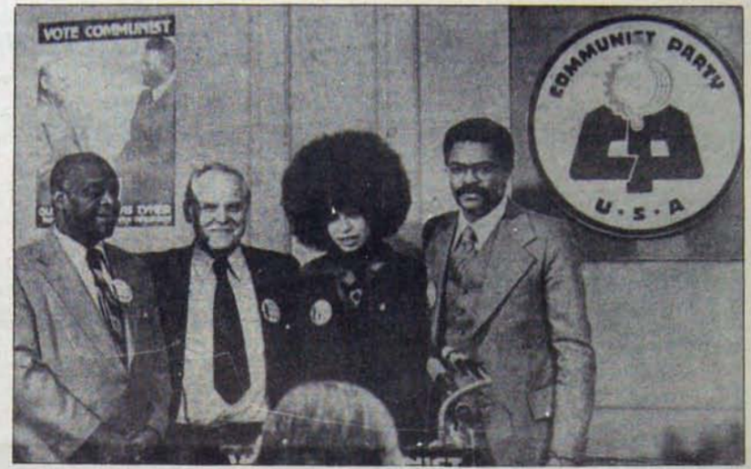
ABD KP'nin önderlerinden Angela Davis, ilerici kadın hareketinin de önderi ve örgütleyicisi....

ABD Federal dairelerinde çalışan kadın personelin durumu da pek farklı değildir. Bu dairelerde çalışan kadınların işyerindeki eksikliklerine ve konularına bağlı olarak verilen 13-26 günlük tatil zamanını "gebelik süresi için kullanmaları" bir hak (!) olarak icat edilmiştir. Nihayet bütün bunlara ek olarak, geniş kapsamlı özel sigortalara sözleşme yapamamış olan milyonlarca Amerika'lı kadın, yüksek doğum masraflarının -1976 yılında kadınlardan doğum için ortalama 2194 dolar dolandırılıyordu.- bir kısmını kendileri karşılamak zorunda dır.