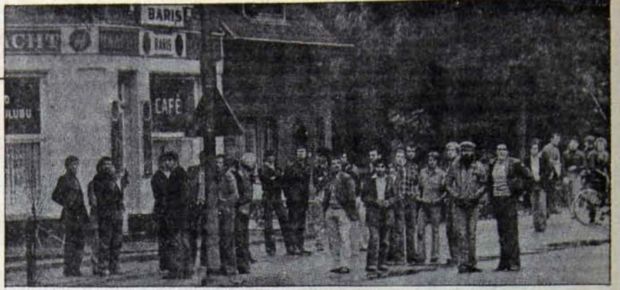
Ekim ayı başında Belçika'nın Limbourg madenlerinde greve giden Türkiye'li işçiler ocakların dışında kışma kışma bekliyorlar, diğer yandan patronların çağrısı üzerine Belçika jandarmaları grev bölgesini sarıyor.

Ancak, işçilerin ezici çoğunluğunun aralarındaki birliği korumaları ve direnmekte kararlı olmaları sayesinde, bu kaba kuvvet uygulamaları ve provo-