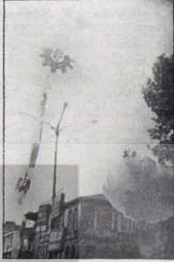
Çarşabağ'lı balonlar İstanbul göklerini süsledi.

Uzun bir seçim dönemi, ülkemizi 12 Mart benzeri karanlık, baskıcı günlere olan özlemlerin azgınlaştığı bir dönem oldu. Tekelci büyük burjuvazi, bunalımını aşmanın çarelerinden biri olarak gerici-faşist hükümet biçimlerini gördüğünü her fırsatta belirtti. Propaganda makinelerini bunun için çalıştırdı. CHP ağırlıklı hükümetten bazı bakanlar bunun için istifa etti.