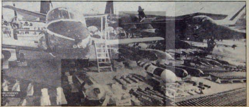
NATO silahlanması soğuk savaş kıskırtıcılığını körüklemeyi hedef alıyor.

Bu olguların değerlendirilmesi 1951-1978 döneminde Sovyetler Birliği'nde yıllık sanayi üretimi artışının yüzde 9.1 emek üretkenliği artışının yüzde 6.7, ulusal gelir artışının ise yüzde 7.7 hızıyla gerçekleştiğini ortaya koydu. ABD için bu verilerin karşılığı sırasıyla yüzde 4.3, yüzde 2.2 ve yüzde 3.5 biçiminde gerçekleştiği bulunuyor. Diğer bir deyişle Sovyet kalkınma hızının ABD'nin iki katını aşarak yükseldiği belgeleniyor.