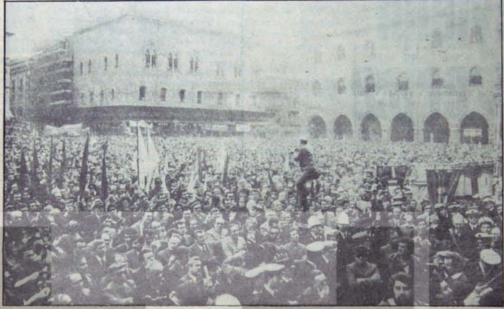
Sol serüvençilik, kitlelerin örgütlü ve birleşik mücadelesine inançsızlıktan kaynaklanıyor.

Sosyalizme geçişin farklı biçimleri onusundaki görüş, aynı zamanda barış ve barışçı olmayan geçişlere de uygulanabilir, işçi sınıfının iktidarı, bu içimlerden biri ya da her ikisinin bilemi kullanılarak elde edilebilir. Kapitalizmden sosyalizme geçiş biçimi nasıl olursa olsun, sosyalist devrim ve prole-