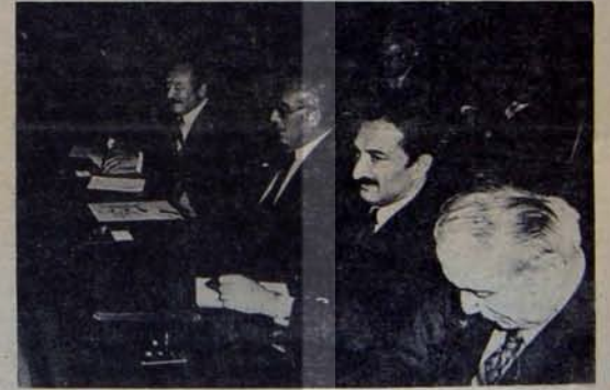
Ecevit ve eski yol arkadaşları: Sükan, Feyzioğlu

Bir gün sonraki basında "Sükan acaba bir ara rejimin kokusunu mu aldı" kuşkuyla karşılanan bu satırların doğruluğu sorular da kendisi şöyle yanıtla-