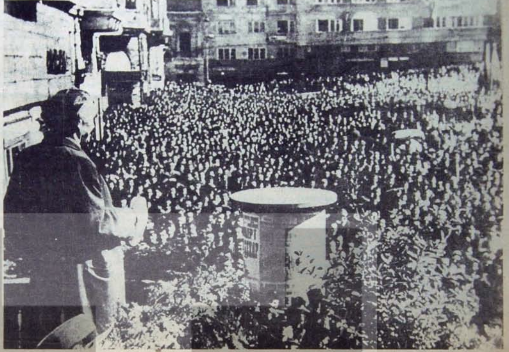
Bilimsel sosyalist hareketin önderleri sapmalara karşı mücadelenin yolunu aydınlatıyor.

Lenin Marksist kurama dayanarak aynı kitapçıkta, "Zora dayanan devrim olmaksızın, burjuva devlet yerine proleter devleti geçirmek olanaksızdır." (a.g.e., s. 405) demiştir. Lenin'e göre, "Burjuva egemenliği ancak proletarya tarafından alaşağı edilebilir; proletarya, ekonomik varlık koşulları bu alaşağı etme görevini hazırlayan ve ona bu görevi başarma olanak ve gücünü veren biricik sınıftır." (a.g.e., s. 408) "Büyük üretimde oynadığı ekonomik rol nedeniyle, proletarya, burjuvazinin çoğunlukla proleterlerden daha çok sömürüp ezdiği ve kurtuluşları için bağımız bir savaşına yeteneksiz bulunan bütün çalışan ve sömürülen yığınların yol göstericisi olmaya yetenekli