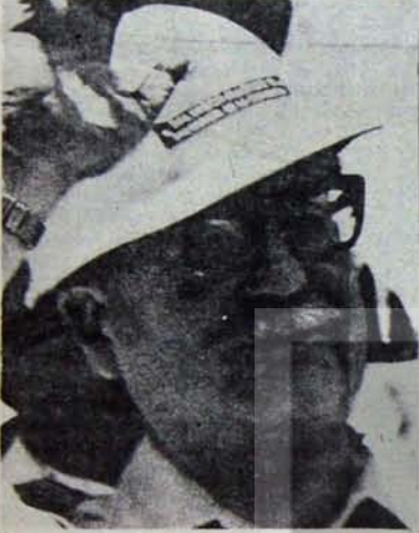
"Onurunu alıp giden Allende'yi unutma!"