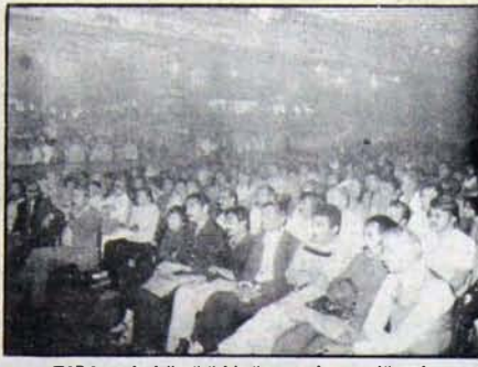
TİP İstanbul örgütü bir üye toplantısı düzenledi

Önceki hafta sonunda 2 Eylül Pazar günü Türkiye İşçi Partisi İstanbul İl Örgütü tarafından, Beyoğlu Kazablanka düğün salonunda Parti üye ve yandaşları ile bir toplantı düzenlendi. Toplantıda bir konuşma yapan TİP Genel Sekreteri Nihat Sargın, ülkedeki politik durumla Parti'nin seçim çalışmalarına değindi. Sargın konuşmasında özette şöyle dedi: