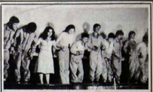
1 Eylül Dünya Barış Günü

Ancak, işçi sınıfının örgütlü mücadelesinin bayrağı 1 Mayıs Alanı'nda burcuna çekilmiştir. Inter-Continental ve Osmanlı Bankası yakasını işçi sınıfının ellerinden kurtarmayacaklardır. Bu kez tam suçüstü yakalandılar. Yıllardır sömürdükleri işçi sınıfına ve yoksul halk kitlelerine hesap vereceklerdir.