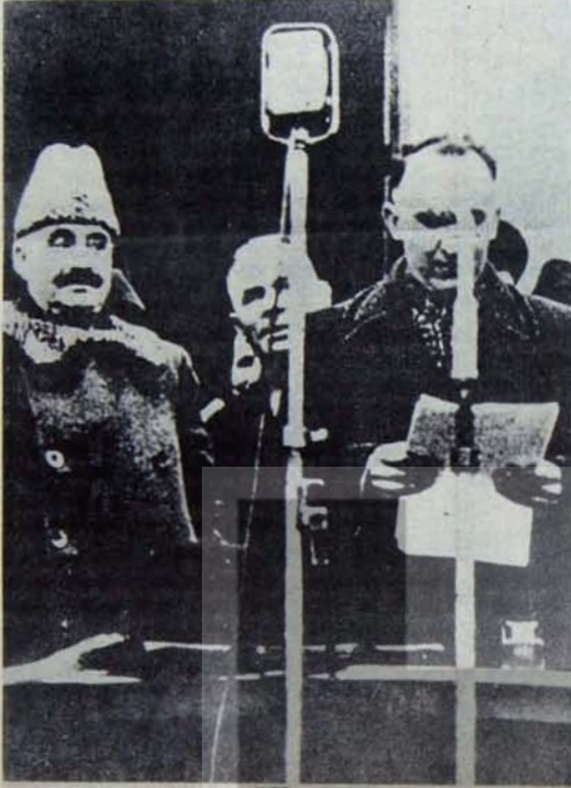
Dimitrov ve Jivkov 1946'da bir gösteri sırasında