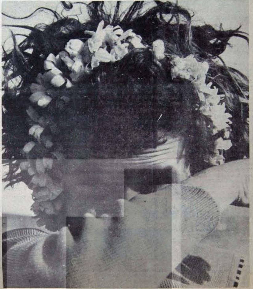
Doğu ve Güneydoğu Anadolu halkı güven baskılarla yılmayacak

Ağalar arasındaki iç rekabette kaynaklanan silahlı çatışmalar da yaygındır. AP Genel Başkanı Süleyman Demirel'in evreni ayaklandırmasına neden olan Hilvan olaylarından kısa süre önce aynı yörede benzeri pek çok olay geçmiştir. Örneğin Hilvan'da belediye başkanlığını kazanan Paydaşlar Süleymanlar'la girişimleri silahlı çatışma sonunda arkadaşları kaç ölü bırakarak, Belediye Başkanlığı'ndan ayrılmak zorunda kalmışlardır. Güçlenen Süleymanlar, Belediye Başkanlığı alduktan sonra savaşım devam etmiş, bugün üzerinde fırtınalar koparılan Apocu'ların desteğini sağlayan Paydaşlar, Süleymanları tasfiye ederek kendi denetimlerinde bir Belediye Başkanı seçilmesini başarmışlardır.