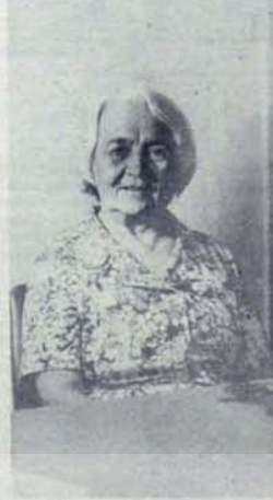
Genel Yönetim Kurulu üyeliğine, oradan da Genel Başkanlığa seçildi.

1962 yılı sonlarına doğru Türkiye İşçi Partisi'ne üye oldu. 1964 Şubat'ında İzmir'de yapılan I. Büyük Kongrede Genel Yönetim Kurulu üyeliğine, o kurul tarafından da Merkez Yürütme Kurulu üyeliğine seçildi. 1966'daki II. Büyük Kongre'de yine aynı görevlere getirildi. 1965 seçimleri sonunda milletvekili olarak parlamentoya girdi. 1969'da Partinin Genel Sekreterliğine, IV. Büyük Kongre'de