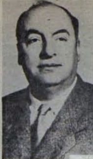
Şili Neruda'yı ölümsüzlüğe uğurluyor.

Uyuyamayacaksınız. Çünkü uyanık herkes. Uyuyamayacaksınız. Çünkü ıktır kör eden sizi. Uyuyamayacaksınız. Çünkü salt ölümdür zaferiniz. Uyuyamayacaksınız. Çünkü ölüsünüz.