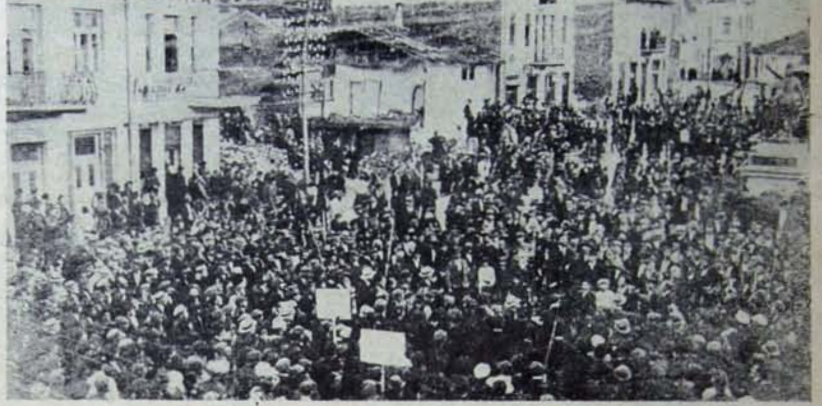
1922'de faşist tehlikeye karşı yerel bir gösteri

9 Eylül 1944 Bulgaristan halkının faşist diktatörlüğü yerle bir edip iktidarı ele geçirdiği ve sosyalist topluma kurulmasına yöneldiği tarihtir. Bu tarih, dünyada ilk kez işçi sınıfı partisi önderliğinde faşizme karşı ayaklanan Bulgar emekçilerinin sınıfsız toplum yolunda attıkları en önemli adımı simgeler.