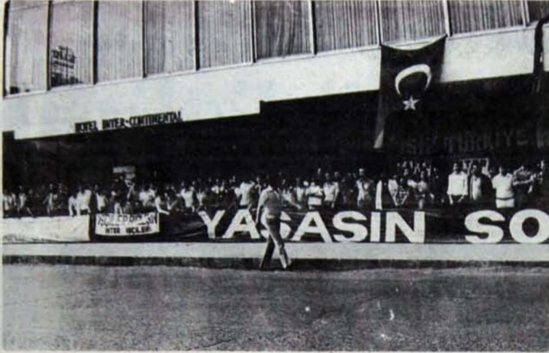
Oleyis tabanı uluslararası tekelere karşı savaşta kararlı

Yirmibeş yıla yakındır ülkemize emperyalist güçler bir şeyleri sürekli kurtuluş yolu olarak dayatmaya çalışırlar. Bazen derler ki; "siz bölgenizin bahçıvanı olun", bazen de "ne güzel ikliminiz var, güneş bol, hava temiz. Öyleyse siz turizm yapın."