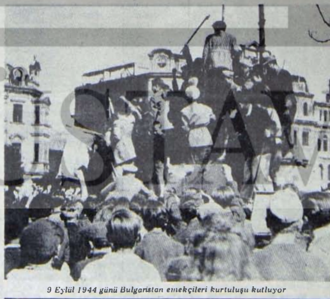
9 Eylül 1944 günü Bulgaristan emekçileri kurtuluşu kutluyor

Havale ve Yazışma HAVASS Yayınları P.K.55, Teşvikliye/İst. Posta masrafı yayınevi tarafından ödenir. On kitaplık siparişlerde %20 indirim yapılır. Posta çekli no: 10863-4 TEL:46 13 19