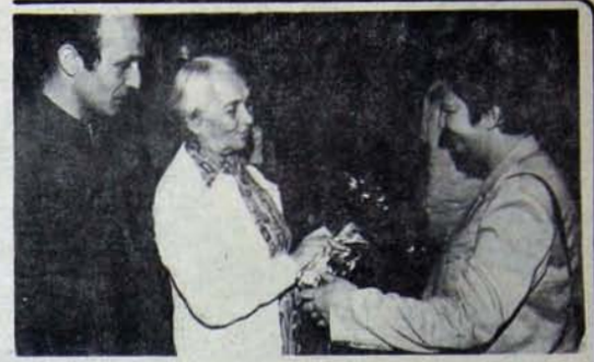
Boran Moskova'ya doğru Partililerce uğurlandı