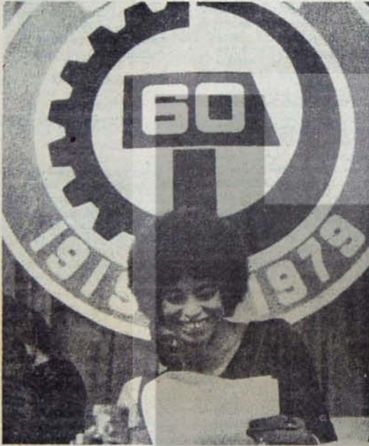
ABD KP Merkez Komitesi üyesi Angela Davis

22-26 Ağustos tarihleri arasında Detroit'te XXII. Kongresi yapan Amerika Birleşik Devletleri Komünist Partisi, kuruluşunun 60. yılını kutluyor. 60 yıldır yoğun baskı ve terör girişimlerine karşı uzlaşmaz biçimde direnen ve gücünü koruyan ABD KP, 60. yılına daha da artan bir güçle başlıyor. 60 yıllık mücadelesi sırasında Amerikan İşçi sınıfının çıkarlarını en iyi biçimde temsil eden Parti, XXII. Kongresi'nde benimsediği Ana Karar'la bundan böyle de aynı yolda kararlılıkla yürümeye devam edeceğini kanıtıyor.