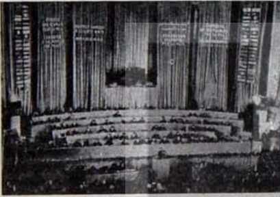
1952 Viyana Kongresi toplantı salonu