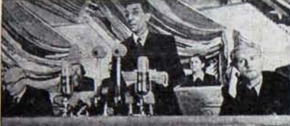
İkinci Dünya Kongresi Prezidyumu ve Joliot-Curie