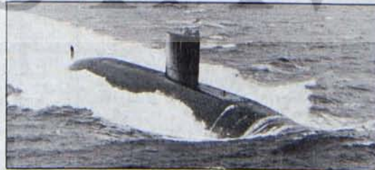
Dünya halkları savaş görüntülerini belleklerinden silmek istiyor.

Helsinki ilkelerini yaşatmanın yolu, işte barış yolunda bu somut adımların alınmasından geçmektedir.