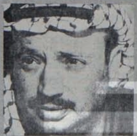
Filistin halkı ABD'nin fetvasını beklemiyor.

Oylanması ileri bir tarihe ertelenen karar tasarısı İsrail'in işgal ettiği tüm topraklardan çekilmesi yanında Filistin halkının kendi geleceğini kendisinin belirlemesini de öngörmekteydi. ABD ise karar tasarısını oylamaya sunulursa, tasarını veto edeceklerini önceden açıklamıştı. Güvenlik Konseyi'nin Filistin konusunda son oturumu Filistin halkının kendi geleceğini belirlemek için verdiği mücadeleden yeni bir kazanımı oldu. Hazırlanan karar tasarısının oylanmaması, Filistin halkının mücadeleye kazandığı mevzilerin anlamını hiçbir şekilde gözlerden kayıramaz. ABD'nin veto hakkını kullanarak tehditli uluslararası düzeyde Filistin halkının kendi geleceğini belirlemesini haklarının kabul edildiği gerçeğini değiştiremeyecektir. Filistin halkının gerçek temsilcisi FKÖ'nünde BM'de Güvenlik Konseyi'ndeki görüşmelerde yer alması bu gerçeğin en somut bir ifadesidir. Emperyalizmin patronu ABD'nin kabul edileceği