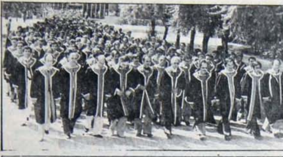
ODTÜ öğrencilerini hedef gösterenler sorumluluktan kurtulamaz