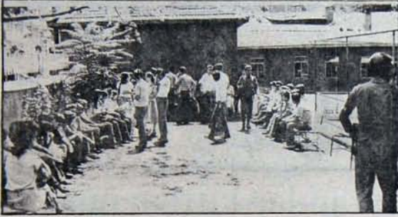
Gözetilene alınan ODTÜ öğrencileri karakolda bekletildi.