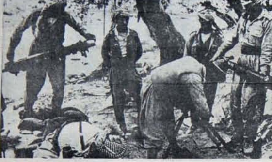
İran Kürt halkının özerklik talebi yaşamaldır.

İran'ın yeniden emperyalizmin ağına düşmesinin engellenmesi İran işçi sınıfı partisi TUDEH'nin öngörülerine etrafında, tüm işçi ve emekçi kitlelerin, Fars ve Fars olmayan halkların birliği ile mümkündür. Emperyalizmden bağımsızlığın titizlikle korunması ve devrimin kazanımlarının ilettilmesi ancak böyle mümkün olabilir.