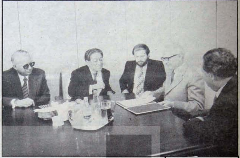
Romeş Çandra: Dünya Barış Konseyi Başkanı