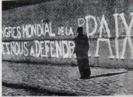
Paris sokakları Birinci Kongreyi selamlıyor.

BARIŞ TARAFTARLARININ BİRİNCİ DÜNYA KONGRESİ 20-25 NİSAN 1949 TARİHLERİNDE 2005 DELEGENİN KATILIMIYLA PARIS VE PRAG'DA TOPLANDI. BİRİNCİ KONGRE'NİN SEÇTİĞİ DAİMİ KOMİTE 1950 2. DÜNYA BARIŞ KONGRESİ'NDE DÜNYA BARIŞ KONSEYİNE DÖNÜŞTÜ.