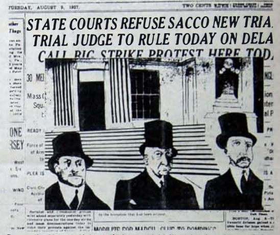
Sacco ile Vanzetti'nin cellatlarının işbirlikçisi üniversite rektörleri

Sacco şöyle dedi: "Verilecek hükmün iki sınıf arasında verileceğini biliyorum - işçi sınıfı ve sermaye sınıfı. Biz insanları kitaplarla, yazılarla birbirlerine kardeş ediyoruz. Siz insanları kovuşturuyor, onlara baskı yapıyor ve onları öldürüyorsunuz. Biz her zaman insanları eğitmeye çalışıyoruz. Siz, bizlerle bir başka ulus arasında bir nefret uçuşunu açmaya çalışıyorsunuz. İşte bugün ben bu neden-