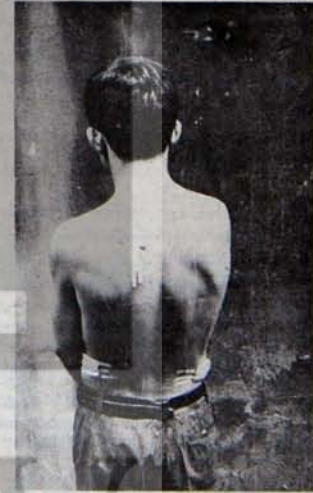
"UDC Slogancıları" bir TİP üyesine bıçakla saldırdı.

UZEL'de toplu sözleşme görüşmeleri yakında başlayacak. İşçilerin her zamankinden daha fazla birliğe ihtiyacı var.