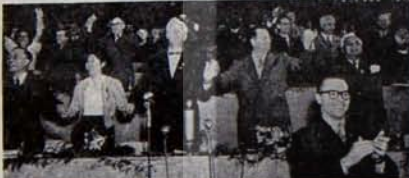
1955 Dünya Barış Asamblesi