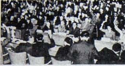
Birinci Dünya Kongresi tarihsel belgesini onaylıyor.