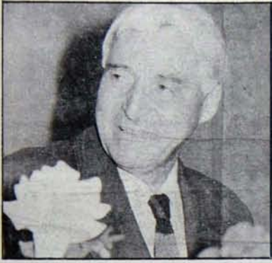
Simonof ardında onurlu bir eser bıraktı.

Büyük Sovyet ozanı, ples yazarı ve romancı Konstantin Simonof'u geçtiğimiz hafta yitirdik. Birçok yapıyla ülkemizde de tanınan ve sevilen Simonof 28 Kasım 1915'te Petrograd'da doğdu. Ortaokulu bitirince sanat okuluna giderek tornacı oldu. Daha sonra Moskova'daki Gorki Edebiyat Fakültesi'ni bitiren Simonof şiir ve piyesleriyle ün yaptı. 1938'de ilk şiir kitabı, "Gerçek İnsanlar" yayınlandı. 1940'da da ilk oyunu olan "Bir Aşkın Öyküsü"nü yazdı. İkinci Dünya Savaşı'na Kızıl Yıldız Gazetesi adına savaş muhabiri olarak katıldı, Beyaz Rusya'da, Kırım'da ve Kuzey Cephesi'nde bulundu; Stalingrad Savaşları'ndan baştan sona izledi. 1944'te Stalingrad Savaşını konu alan "Günler ve Gece" romanını, 1952'de konusu Moskova'dan İç Savaş İspanyası'na, oradan Japon saldırısı altındaki Moğolistan Stepelerine uzanan "Silah Arkadaşları" romanını yazdı. Simonof'un bundan sonraki eserleri arasında büyük epik üçlemesini oluşturan "Yaşayanlar ve Ölümler" (1959), "İnsan Asker Doğmaz" (1964) ve "Son Yaz" (1971) vardır. Bu üçleme Sovyet edebiyatında çok önemli bir yer tutar. Tolstoy çekeneğinde büyük bir yapıt olan bu üçleme 1974'te Lenin Ödülü aldı. Yazarın 1973'te yayınlanan "Savaştan Yirmi Gün" ve "Lopatin'in Notları" adlı yapıtları yeni bir üçlemenin bölümlerini oluşturmaktadır.