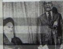
Humeyni ve Bazergan

Gericî Pekin yönetiminin dayatmaya çalıştığı "kapıkuluğu"nu reddeden Kamboçya halkı, gericiliğe karşı kazandığı ikinci zaferden sonra bugün, yeni bir toplumun kuruluşu için çalışmalarını emin adımlarla sürdürüyor. Bu mücadeleden, Pekin kliğinin her türlü yıkıcı girişimlerine rağmen, kesin başarıyla ulaşacağına Kamboçya halkı kesinlikle inanıyor.