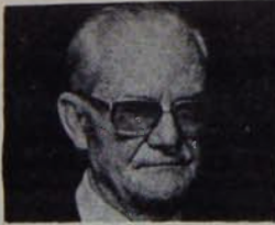
Diktanın eski lideri Giesel

Prestes, kitle eylemindeki bu-günkü yükselişin 1974 seçimle-rinden beri gelişen bir sürecin so-nucunu olduğunu belirtti. Bu so-