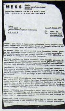
Turgut Özal Sukan'a böyle yakınıyor.

"İçinde bulunduğumuz koşullar devrinci sendikal birliği gündemimizin birinci maddesi haline getirmiştir. Burjuvazinin saldırılarının arttığı, emperyalizm ve tekelci sermayece desteklenen faşistlerin cinayetlerinin yoğunlaştığı