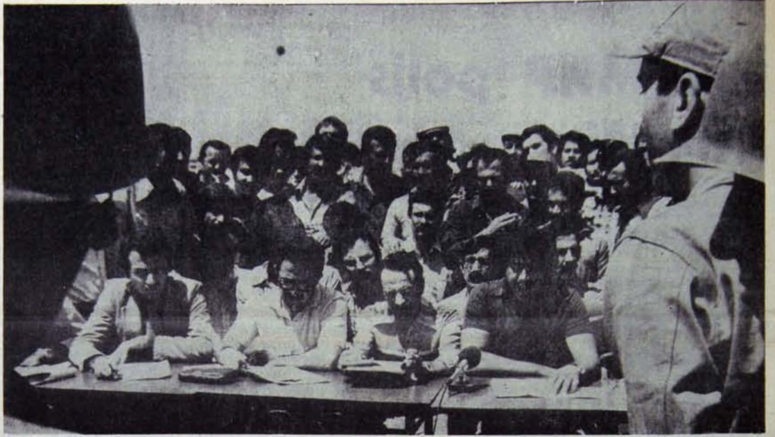
Soda İşçileri Petkim yönetiminin uzlaşmactığından gereken dersi çıkardılar

Mersin'deki Soda Fabrikasında DİSK'e bağlı Petkim-İş Sen-