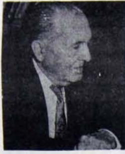
Luis Carlos Prestes

Lefkoşe toplantısına katılanlar Eylül ayında Havana'da toplanacak olan bağıltısız ülkeler toplantısına da bir mesaj gönderilmesine karar verdiler. Mesajda, yapılacak zirvenin halkların emperyalizme ve sömürgeçiliğe karşı verdikleri mücadeleye ve sosyal ve ekonomik gelişmelerine büyük katkılarda bulunacağına değinildi. Ayrıca bildiride, Vietnam halkına saldırıan Çin yöneticileri protesto edilerek yeni Kamboçya'nın dünya barışına büyük katkılarda bulunacağına inanıldığı belirtildi.