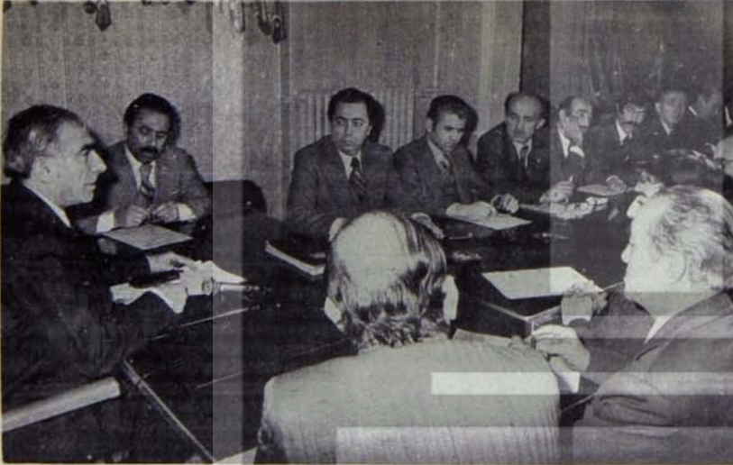
Faşist terörün yönetim odağı, yakayı ele veriyor.