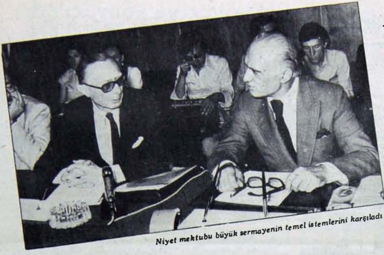
Niyet mektubu büyük sermayenin temel istemlerini karşıladı

Türkiye'nin bir yıl içinde uygulayacağı ekonomi politikaları kapsayan, özünde ise, emperyalizme bağımlılık zincirine Ecevit Hükümeti eyleye eklenen yeni bir halka niteliğinde olan Niyet Mektubu'nununa hatları Maliye Bakanı Ziya Müezzinoğlu tarafından geçtiğiniz hafta açıklandı.