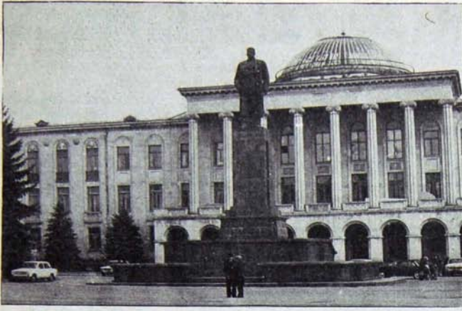
Gori'de belediye binası ve Stalin heykeli.