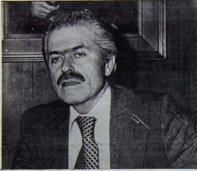
Bağtürk'ün çağırma inandırıcı yanıt gelmedi