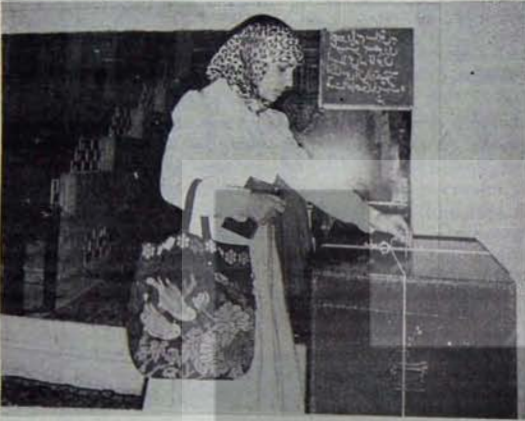
İran halkının demokratik kazanımları tehdit altında

Bu örnek de, dünya sosyalizmi karşısında gerileyen kapitalizmin gitgide dahabüyük oranda sosyal denagojyeye başvurmak zorunda kaldığını kanıtlanmaktadır.