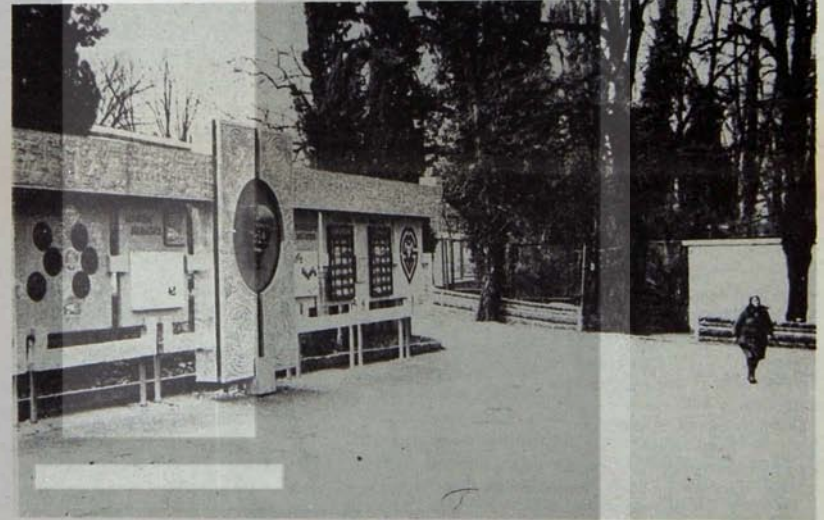
Bir fabrikanın giriş kapısı: Lenin ve ulaşılan yıllık hedefler içiçe...