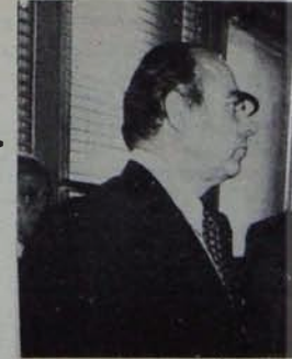
Alp ve Öngüt Bankalar Kararnamesini engelliyor

tir. Yasanın 39'uncu maddesine getirilmesi öngörülen değişikliğe göre de, bankaların sermayesinin yüzde 20'sine sahip olan kişi, aile ya da kuruluşlara sınırsız kredi açabilmesi olanağı kaldırılmakta; bu kuruluşların "tümüne" açabilecekleri kredi tutarının sermaye ve ihtiyat akçeleri toplamının yüzde 20'sini geçmesi ilkesi benimsenmektedir.