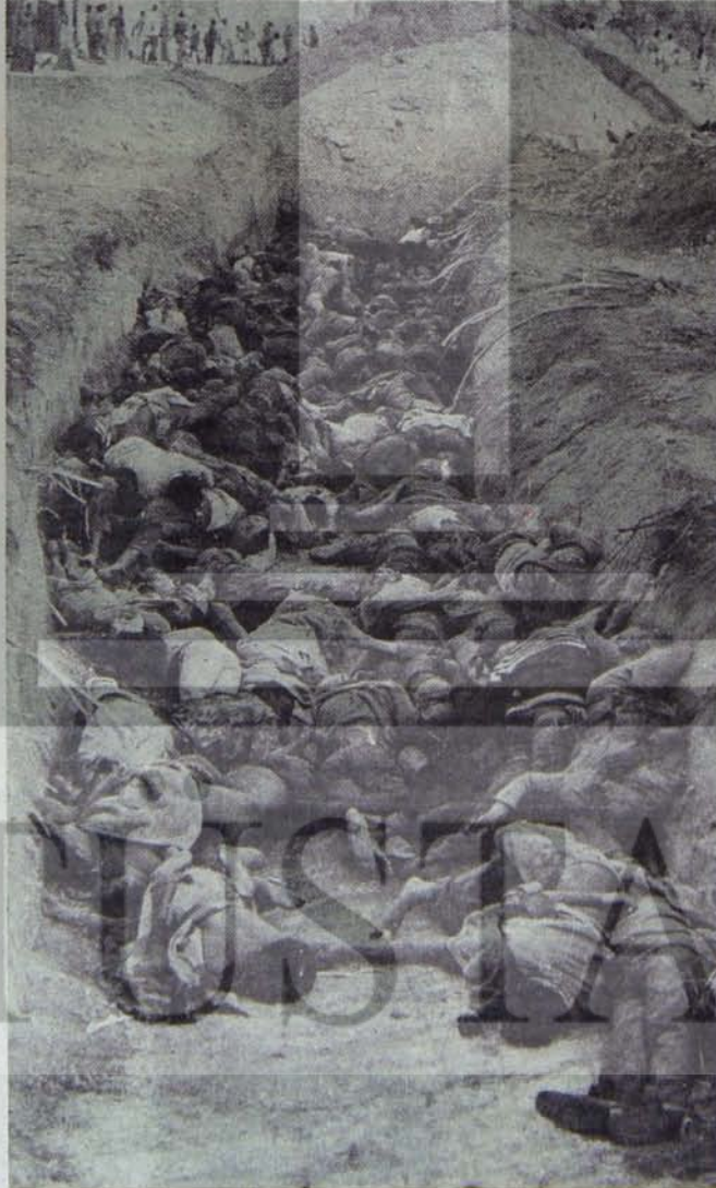
İnsanlık Hitler nazizminin acılarını yeniden yaşamayı reddediyor.

Federal Alman tekelci sermayesi uzun yıllar kendilerini hristiyan olarak tanıtan birlik partileri CDU/CSU'ya dayandı ve böylelikle egemenliğini ve uluslararası etkisini yeniden kurdu. Ancak, sosyalizmin güç kazanması ve uluslararası güçler dengesinin değişmesiyle birlikte, 60'lı yılların ortalarında, emperyalizmin savaş sonundaki "soğuk savaş" stratejisi boşa çıkarılmıştı. Öte yandan, Federal Almanya 1967'de bir ekonomik kriz içine düşmüştü ve ülkede, toplumsal güvenlik ve demokratik özgürlükler için yığınsal hareketler yeni bir ivme kazanmıştı. CDU/CSU hükümetleri dönemi böylece sona erdi. Bütün bunlar politik egemenlik sisteminde bir bunalımı ve antidemokratik eğilimlerin ve neozal güçlerin güç kazanmasını da beraberinde getirecekti.