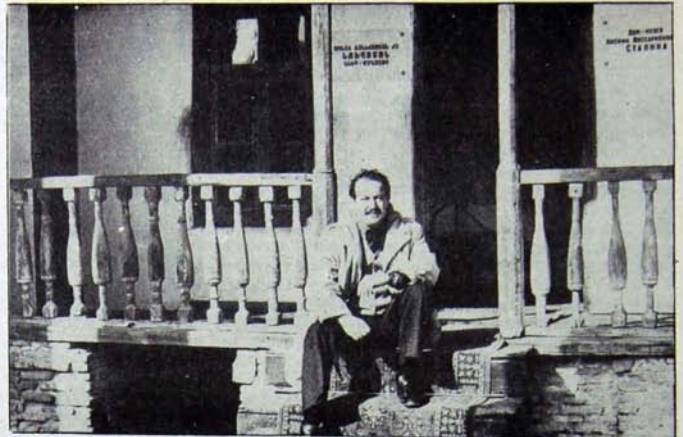
Gori kentinde, Stalin'in doğduğu ev. 1879'da Stalin bu iki göz odalı koy evinde doğdu..

fındaki kıyılarında Şemsipaşa'da yıkık bir duvarın üstünde şehre ateş edecekmiş gibi İstanbul'a doğru çevrilmiş olan düşman donanmasının toplarına bakarak benliğime, kanıma verdiğim söz yerine gelmeğe başlamıştı..."