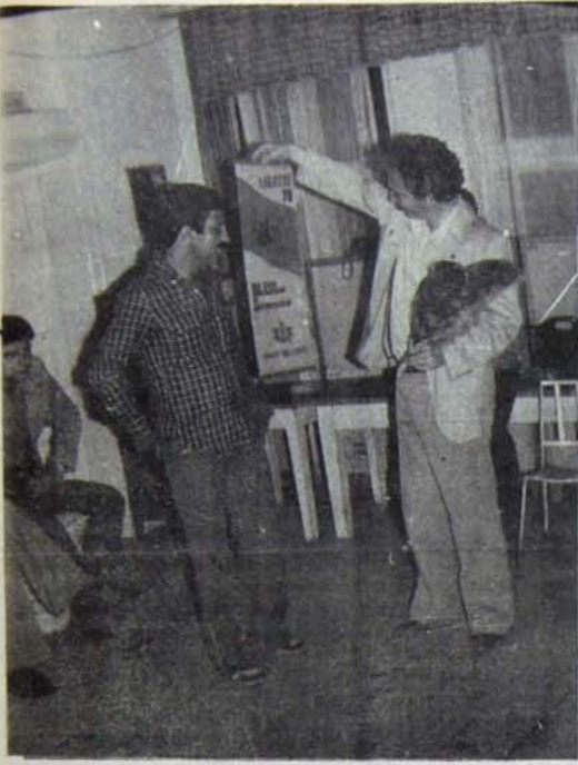
TİP Kartal örgütü, Bulgar topluluğuna armağan sundu