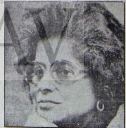
Carter'ın yeni Sağlık Bakanı Patricia Hearst

Japonya Komünist Partisi Merkez Komitesi Başkanı Sanzo Nosaka, Japon emekçilerinin Laos devrimini sonuna kadar desteklemeye kararlı olduklarını bildirdi. Japonya Komünist Partisi ile Haos Devrimci Halk Partisi arasında sürdürülen resmi görüşmeler sırasında bir açıklama yapan Nosaka her iki parti ve halklar arasındaki dayanışma ilişkilerinin güçlendiğini belirtti. Laos Devrimci Halk Partisi MK Genel Sekreteri Kaysonne Phomvihane de yaptığı konuşmada göster-