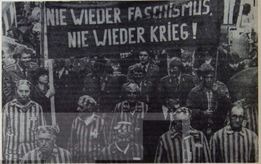
Neo-nazi eylemlerin yoğunlaşması demokratik güçlerin kitlesel tepkisiyle karşılaşılıyor.

Faşist ordunun geleneksel birlikleri ile Federal Almanya'da bulunan yabancı faşist ve terör örgütleri dışında 150 neonazi ve İttikamcı örgüt Federal Almanya'da faaliyettedir ve eylemlerini arttırmaktadırlar. Bunlar arasında kendisini Federal Almanya'da Nasyonal Sosyalist Alman İşçi Partisi - İnşaat örgütü olarak da adlandırılan Nasyonal Sosyalist İşçi Partisi - Yurtdışı örgütü (NS-DAP - AO) gibi Hitlerci faşist örgütler, SS-Gelenek Birliği HIAG, sayısız İttikamcı birlikler ve Ordu spor gruplarının faşist vurucu timleri, "Yurttaş İnsiyatifi" maskesi altında faaliyet gösteren miltan gruplar ve Alman Kültür Çalışması, Biyolojik Güvenlik Enstitüsü ya da Yaşamı Korumak İçin Dünya Birliği gibi neo-