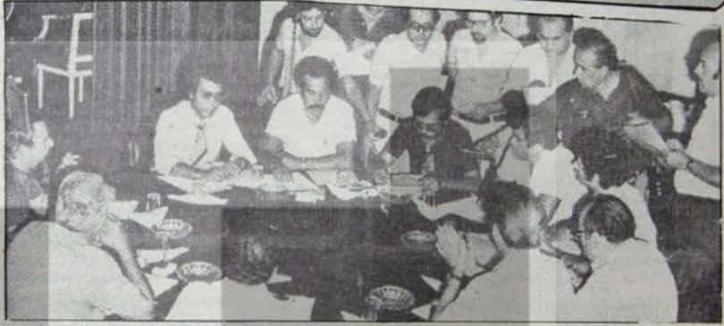
Dev-İş ve PEO temsilcileri ortak açıklama yapıyor.