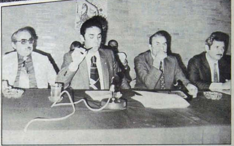
Odalar Birliği Başkanı Yazar: Süper kartlı bir yılın bilançosu

NOT: 1) Ödenmiş sermaye rakamının 31.12.1978 tarihi itibarıyla düzenlenmiştir.