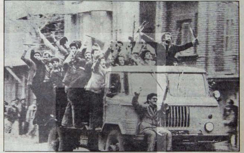
TUDEH MK, İran Devrimini tehdit eden, Bazargan'ın ödüllüğüne karşı uyarıyor.

Komünist ve sosyalist partilerin parlamentodaki eylem birliğinin sonuç almaya yönelmesi üzerine, ülkedeki gerici güçler, Mota Pinto hükümetinin istifa etmeden "yeniden düzenlenmesi" olasılığını denemeye çalışmışlardır. Ne var ki bu girişim başarıya ulaşamamış, hükümetin çekilmesi kaçınılmaz hale gelmişti. Şimdi sonbahardaki seçimlere kadar gerici-sağ partilerin bir seçim bloku oluşturmaya çalışacakları bildiriliyor. Sa Carneiro'nun "sosyal demokrat"larının, Sosyal Demokrat Merkez Partisi'nin, sosyal partiden ayrılan "sağ-kanat" reformistlerinin, "Halkçı Monarşistler" ile "Hristiyan Demokratlar"ın oluşturacağı böyle bir bloka başkanı tanınmıyor.