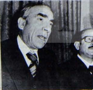
MİSK'te bomba imal edildiğinin ortaya çıkması Başbuğ'un partisinin çözümesindeki çemberi daralttı.

İstanbul Sıkıyönetim Askeri Savcılığı ise, MHP Bakırköy İlçe Merkezi'nde patlayıcı madde ve silah bulunduruldukları ve bölgede çeşitli saldırılar düzenleyen MHP'lileri parti lokalinde bannırdıkları için MHP İlçe yöneticileri hakkında dava açılması istemiyle Cumhuriyet Başsavcılığı ve Adalet Bakanlığı'na başvuruda bulundu. MHP Bakırköy İlçe Binasında, 11 Şubat günü yapılan aramada silah ve patlayıcı maddeler ele geçirilmiş, silahlardan birinin Yalova'da 4 yeri bombalamak ve kurşunlamaktan sanık iki faşiste ait olduğu saptanmıştı. Aynı sanıkların İlçe Başkanı tarafından binada saklandıkları da belirlenmişti.