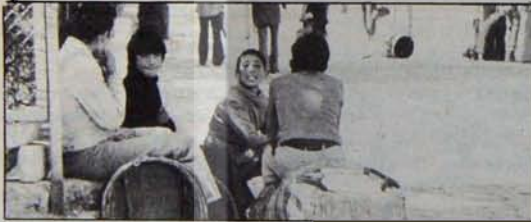
Kârlı 1978'in faturası

Tabloda yer alan diğer kuruluşların kârları incelendiğinde, özel kesimin neden 1978'den hoşnut kaldığı kolayca anlaşılabilir. Emperyalizmle yapılan işbirliğinin sonucu "fena değildir", ama hep daha fazlası istenmektedir, istenmek zorundadır. Çünkü, sistemin mantığı, temel direği "kâr" dir.