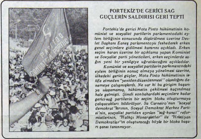
PORTEKİZ'DE GERİCİ SAĞ GÜÇLERİN SALDIRISI GERİ TEPTİ

"Ekonominin düzeltilmesi için şimdiye dek hiçbir çözüm yolu göstermeyen ve bağımlı