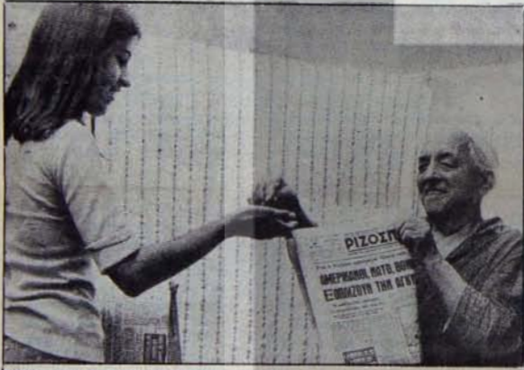
YKP organı Rizospastis kitlelerin elinde