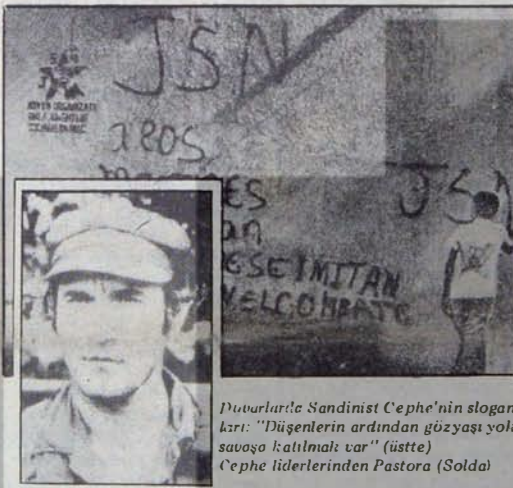
Düvarlarla Sandinist Cephe'nin sloganları: "Dişgenlerin ardından gözyaşı yolu, savaşa katılmak var" (üstte) Cephe liderlerinden Pastora (Solda)

Sandinist Cephe'nin daha kapsamlı bir programı 1969'da oluşturuldu. Bu programda Cephe'nin "işçi-köylü ittifakına ve ülkenin tüm yurtsever, anti-emperyalist güçlerinin kitlesel katılımına dayanarak, iktidarı ele geçirmeyi, diktatörlüğün askeri ve bürokratik aygıtını parçalamayı ve devrimci bir hükümet kurmayı amaçlayan askeri-politik bir örgüt" olarak tanımlanıyordu. Programda, ABD tekelininin ve Somoza ailesinin mülklerinin ulusallaştırılması, doğal kaynakların ve dış ticaret üzerinde devlet denetiminin kurulması, etkin bir planlama sisteminin kurulması öngörülmüyordu.