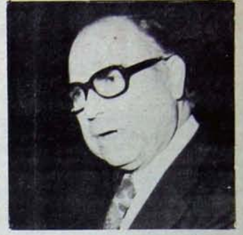
Orhan Alp'in Transtürk'e hediyesi Taksan

Türkiye'nin takım tezgahları gereksinmelerini karşılamak için kurulan ve sermayesi 500 milyon lira olan kamu kuruluşu TAKSAN'ın Maliye Bakanı Ziya Müezzinoğlu ve Sanayi ve Teknoloji Bakanı Orhan Alp tarafından, bir özel kuruluş olan TRANSTÜRK Holding'in girişimiyle kurulan ve sermayesi 30 milyon lira olan BUNSA adlı şirkete peşkeş çekilmek istendiği öğrenildi.