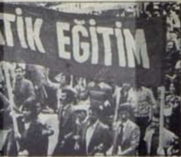
Demokratik Eğitim mücadelesi için güçlü bir TÖB-DER

Örgüt Genel Başkanı ve onbinlerce üyenin eleştirilerine hedef olan tüzüğümüzün 5. maddesi, örgütümüzün mesleki yönü öne çıkaracak biçimde yeniden düzenlenmelidir. Öğrencilerin, memurların, daha üst düzeyde -Sendikalarda- örgütlenme olanaklarına sahip işçilerin TÖB - DER'e üye olması engellenmelidir.