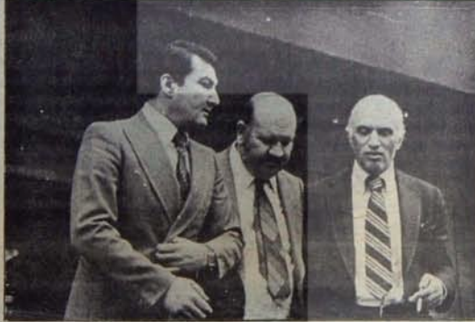
Ekonominin üç bakanı: Baykal, Köprülüler, Müezzinoğlu