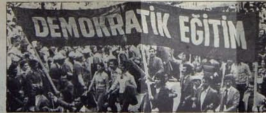
Demokratik Eğitim mücadelesi için güçlü bir TÖB-DER

4. olağan kongresinde ve kongre öncesinde, bu anlamdaki olumsuzluklar, TÖB-DER'i bölünme noktasına getirmiştir. Bu tehlike henüz atlatılmamışken, bu günlerde örgütümüzün kongrelere zorlanması, iç mücadelelerin körüklenmek istenmesi rastlanırsa olmasa gerek.