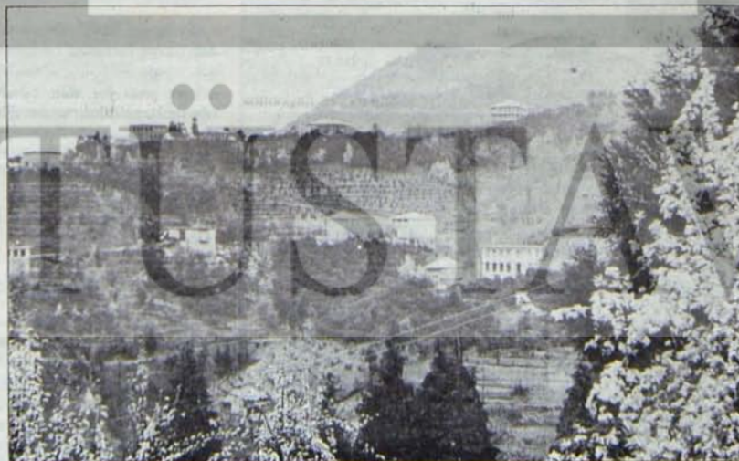
Batum'da Ahaşeni kolhozunda emekçi evleri