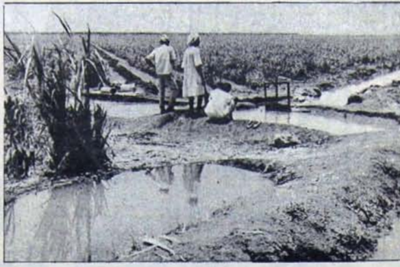
Sudan emekçi halkının direnişi Numeırl diktasını sarıyor

Sudan'da Numeırl yönetimindeki askeri darbe 25 Mayıs 1969'da gerçekleşmişti. Kitle hareketinin o dönemdeki düşük düzeyini değerlendirerek böyle bir darbeden yana tutum almayan Sudan Komünist Partisi, Numeırl'in ve "Hür Subaylar"ın ilerici ve anti-emperyalist konumlarına dayanarak, daha sonra hükümeti destekleme kararı almıştı. Ne var ki kısa sürede SKP'ne karşı bir baskı politikası yürürlüğe kondu. Partide bir bölünme yaratma girişimleri hızlandı, Parti yasaklandı ve Genel Sekreter Abdülhalik Mahçup ülkeden çıkarıldı. Aynı zamanda bütün demokratik güçleri hedef alan bu terör karşısında, SKP, bağımsız varlığını koruyabilmek için dövüşmek zorunda kaldı.