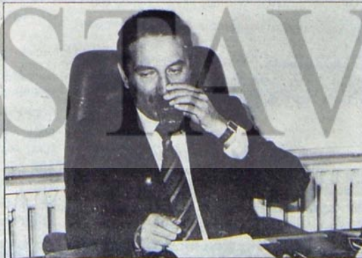
Ecevit: Bir bardak soğuk su!...

Yaşadığımız günler, gerici hükümet formüllerine, faşist hareketin sürdürdüğü terör, işçi ve emekçi kitleler üzerindeki ekonomik ve politik baskılara, sosyal demokrasinin tekelcilerle yaptığı gerici işbirliklerine karşı direnme gündedir. Demokratik güçler önünde bu direnişin örgütlenmesinden başka bir seçenek yoktur ve işçi sınıfının politik hareketi bu direnişin örgütlenmesi için görev başındadır.