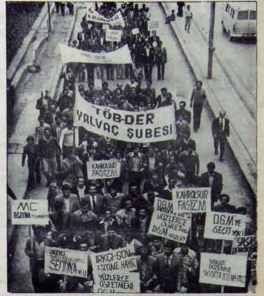
Güçlü kitle eylemleri güçlü kitle örgütlerini gerektiriyor

● Önce "Demokratik Birlik Kongresi'nden ne anladığımızı belirtelim: Biz, demokratik birlik kongresinden; üyelerimizin özgür-