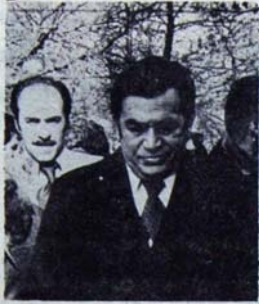
Apartman gibi devlet yönetmek

Olaylara anında müdahale eden T.İ.P. Giresun İl Örgütü, Giresun halkına durumu, hemen bastırıldığı bildiri ile duyurarak gençlere sahip çıkılmasının ortamını hazırlamış oldu.