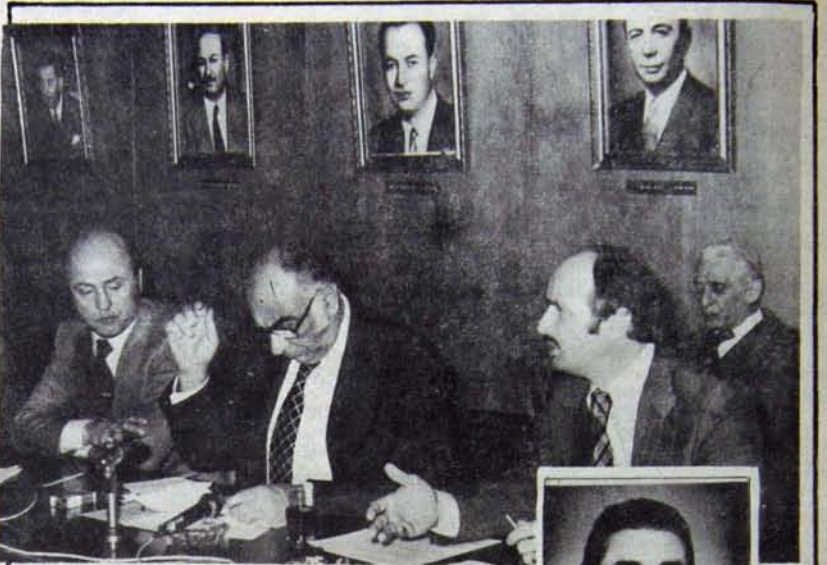
Dıblan ve Narin Odalar Birliği Başkanlığına Yazar'a bıraktı.

Fakat daha da önemlisi şuydu: Odalar Birliği'ni politik bir ağırlık merkezi haline getirmeyi amaçlayan büyük burjuvazinin egemen kesimleri, bu Genel Kurul'a politik tercihlerini ortaya koymalıydılar. Ve böyle oldu. Genel Kurul, tekeli büyük burjuvazinin CHP karşısında AP'den ve MHP'den yana koyduğundan ilân edildiği bir forum oldu. Böylece TÜSIAD'ın ilanları ve "Genişletilmiş Odalar Birliği" Genel Kuruluyla başlatılan politik çıkış, Odalar Birliği'nde gen-