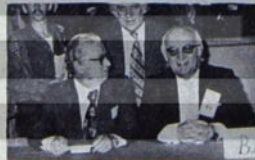
Ersoy'un Türk-Metal'e hedyesi

Konu sınıf ve kitle sendikacılığının mücadele ilkelere açısından incelenince bütününe kavuşabilir. Herşeyden önce MKEK'e bağlı işyerlerinde işçilerin işyerlerinin, demokratikleşmesi, işveren baskısının son bulması, faşist terörün dağıtılması gibi güçlü bir talebin var olmasını olayın tek yanı olarak alan, bunu örgütlü bi-