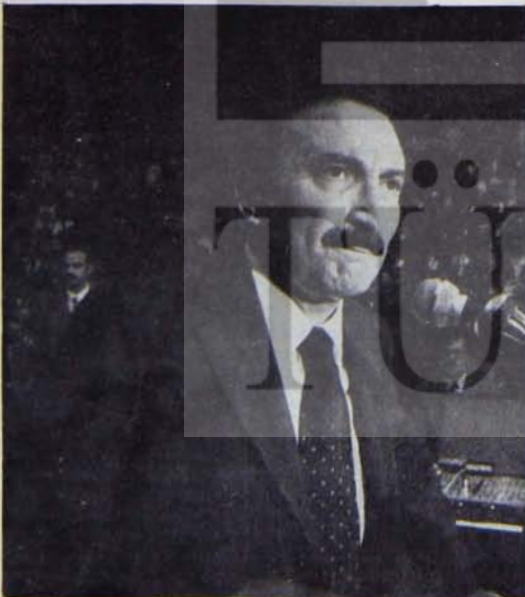
Sıra AWACS projesinin uygulanmasında