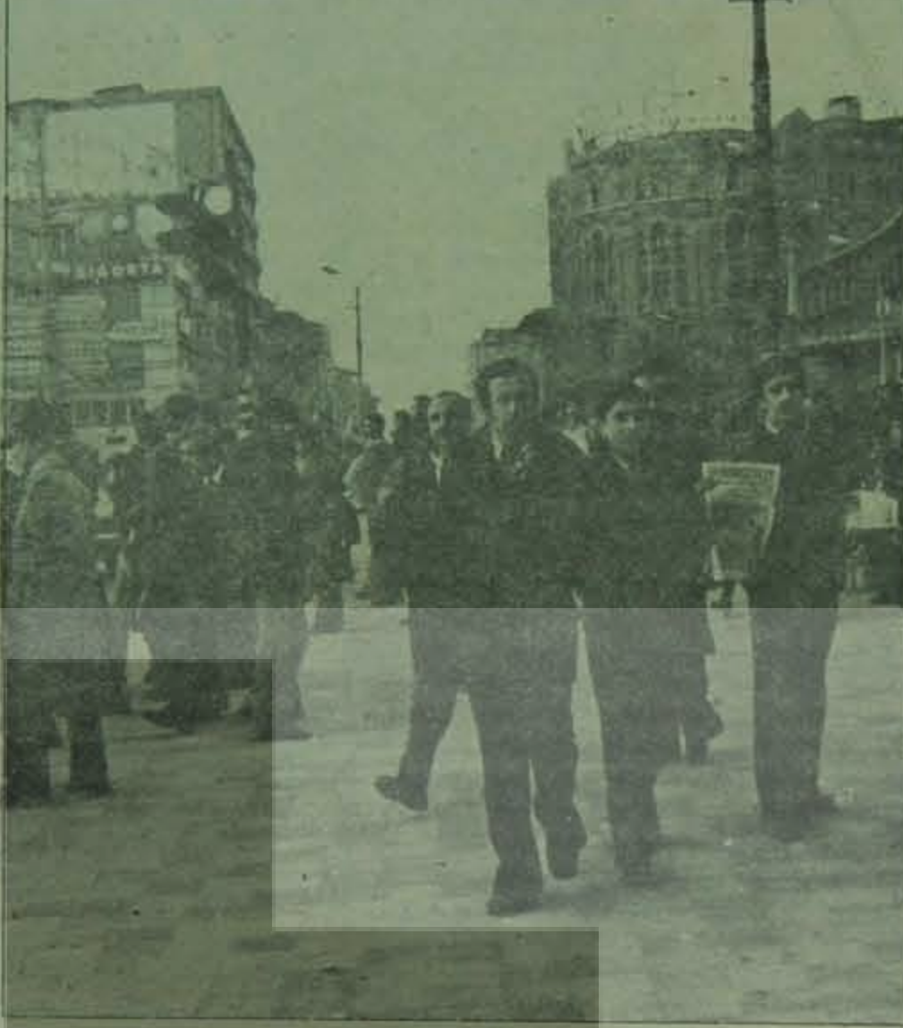
Yürüyüş bütün engellemelere rağmen yayını geniş kitlelere ulaştırmayı başardı.

YÜRÜYÜŞ'ün yayın alanında sesini yükseltmesi bu temel gelişmeyle doğrudan doğruya bağlantılıydı. YÜRÜYÜŞ demokratik güçler arasında ve sol içinde vazgeçilmez ve temel bir işlevi yerine getirmek üzere yayın alanına atılıyordu: Bağımsızlık, demokrasi, sosyalizm mücadelesinin bütünlüğünü titizlikle korumak; tüm demokratik güçlerin antifaşist ve antiemperyalist mücadelesiyle bilimsel sosyalizm ve işçi sınıfının politik hareketinin perspektifi arasında örülebi-