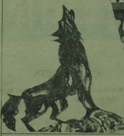
MHP'nin Batı Almanya'daki terörü ilerici güçlerin duvarına çarpıyor...