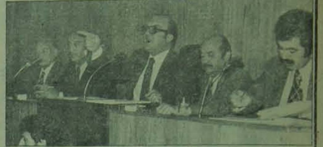
Tiyaşan "patronlar grevi" kararını açıklarken belinde tabanca taşıyordu.

Gerici güçlerin "iki maske" politikası bir başka alanda daha tendisini göstermeye başladı. Gerici basın geçtiğimiz hafta içinde, ekonomik bunalımdan kurtuluş için Türkiye'nin önünde tek "eksik" diye ilan ettiği devalüasyon kararını almadığı gerekçesiyle, hükümete karşı yeni bir kampanya başlattı. Tercüman gazetesinin geçtiğimiz Salı günü büyük bir bomba gibi ortaya attığı habere göre, Türkiye'nin devalüasyon yapması halinde hemen sunulmak üzere, uluslararası bankalar 1 milyar 228 milyon dolar-