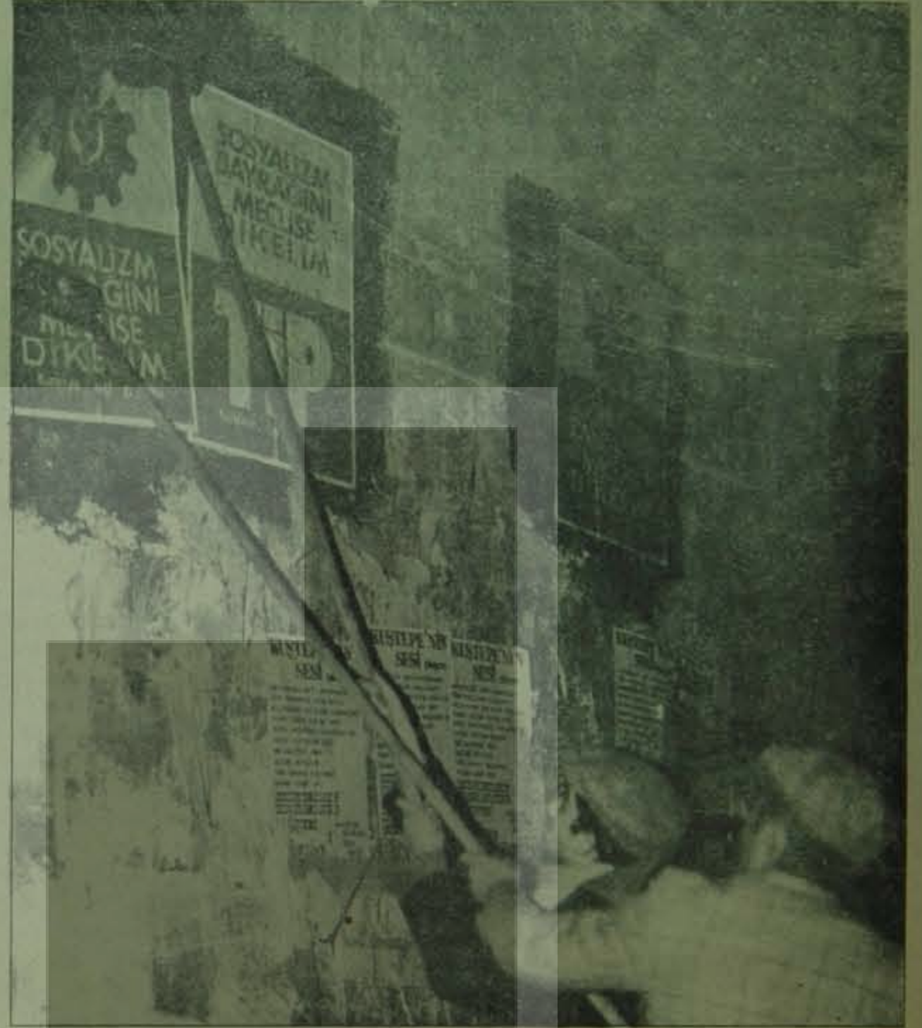
Seçim yasasındaki değişikliklerle afiş yasağı getirilerek seçim çalışmalarının kütelleri politik yaşamda etkin kılmasının önü alınmak isteniyor.

"Seçim kurullarının seçim güvenliği açısından taşıdığı önem açıktır. Yeni yasa teklifi, ilçe seçim kurulları ve sandık kurullarının kurulması ve buna üye olabilecekler bakımından da önemli değişiklikleri öngörmüş bulunmaktadır. Yürürlükteki yasaya göre, seçime katılan her siyasi partinin bu kurullarda asıl üye olarak temsil edilme olanağı vardır; siyasi parti sayısı fazla ise ad çekme yoluna gidilir. Yeni teklifte, bu düzenleme baştanbaşa değiştirilmekte, bunun yerine dört yıl önceki seçimde alınan oylar tek ölçüt kabul edilmektedir. Seçime katılan her siyasi partinin yasalar karşısında eşitliği temel ilkesine aykırılığı su götürmez olan bu değişiklik önerisi, diğer yandan da dört yıl önceki seçimin sonuçlarını, seçime katılma koşulunda olduğu gibi seçim kurullarının oluşumu bakımından da esas almakla, ülkenin siyasi yaşam ve ortamını değişmez sayan ve değişmemesi için de var gücüyle uğra-