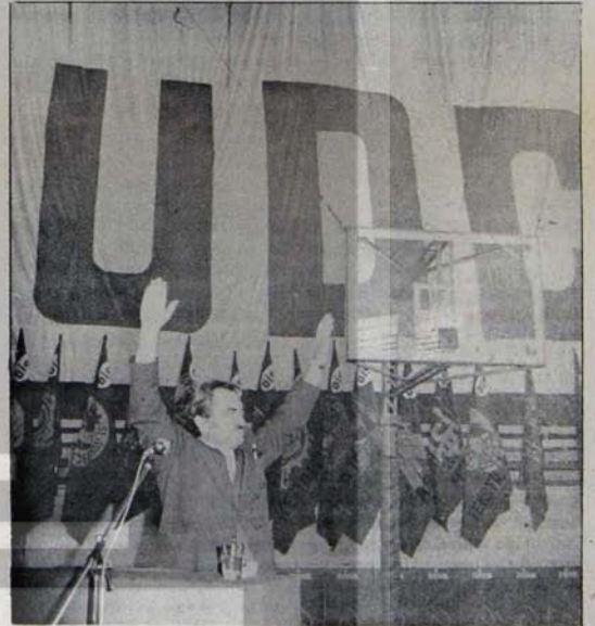
Keskin sol görünüm arkasında başlatılan operasyonları tasfiyecilerin tasfiyesiyle sonuçlandı...

"DISK'i kuran, ilkelerini hayata geçirmek için tüm engellere rağmen yılmadan mücadele eden ilerici, devrimci, bilimsel sosyalist işçiler işçi sınıfının ilerici sendikal örgütü DISK'in parçalanmasından giden yolları tahmin edilecektir."