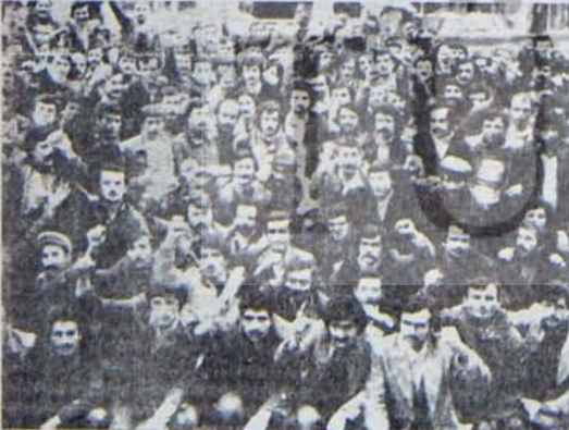
Direnişçi Lassa işçileri işverenin kıstırtmalarını pishürtecek.

• Ödeme Adresi: TÜRKİYE: YORUYUŞ DERGİSİ POSTA ÇEKİ 100234 • AVRUPA: GOODIFF POSTA ÇEKİ: 000-1164657-75 BRUXELLES-BELÇİKA