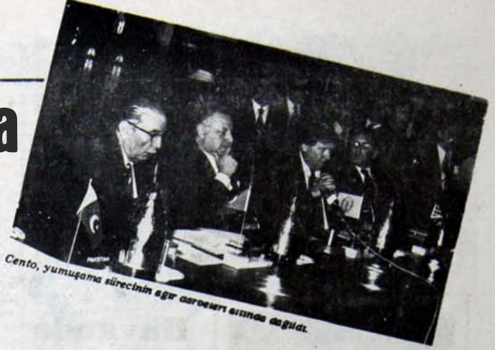
Cento, yumuşama sürecinin ağır çarpmaları sırasında dağıldı.

☆ CENTO'nun kuruluş amacı neydi? Örgütün bu amacını yerine getirdiği söylenebilir mi?