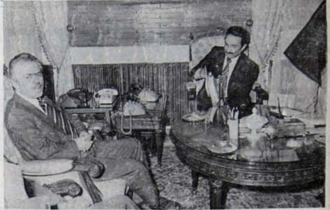
Hükümetin izlediği denge politikası, ekonomik bunalıma çözüm getirme-yeceği gibi, bunalımı daha da derinleştirerek hükümetin kendisini de uçurumun kenarına getirecektir. Hükümet, emperyalizmin ve büyük burjuvazinin dayattığı politika karşısında kesin tercihi yapmak zorundadır...