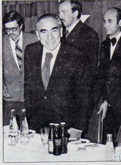
Bu keyif neden?

Bu uygulamalar, Elazığ'da faşist tiranlığın en yüksek boyutlara ulaştığı sırada TİP il örgütünün kurulması üzerine Parti'yi ve yöneticilerini hedef seçen faşist terörün, şimdi "yasal hüviyeti" olan kimileri tarafından sürdürülmeye çalışıldığını gösteriyor. Bütün bunlar, sosyalistleri sindirmeye yetmeyecektir.