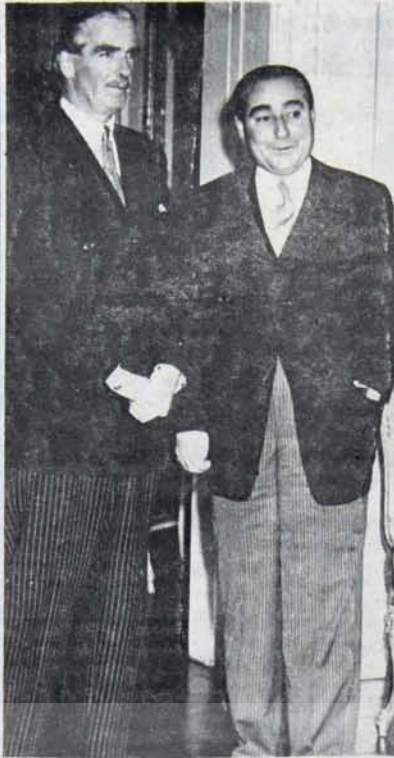
CENTO anlaşmasına imza koyan Adnan Menderes, İngiliz Dışişleri Bakanı Anthony Eden'la...