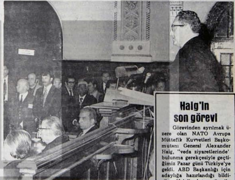
Kissinger. CENTO Bakanlar Konseyi Toplantısında

Ecovit İktidarı, CENTO'nun feshedilmesini, bütünüyle kendisi dışarda oluşan bir sürecin sonucu gibi yanıtmaya özellikle titizlik göstererek, böylesi bir anda bile CENTO'nun patronlarını gücendirmeye titizliğine sarıldığını göstermektedir. Şimdi sorun, yeni bir askeri paktın ortaklığı Türkiye'ye dayatma girişimlerine kesinlikle karşı çıkabilmektir. Emperyalizmin saldırı ve yeni-sömürgecilik aracı CENTO'dan sonra Ortadoğu'da yeni bir saldırı paktının oluşturulmasına Türkiye'nin ileric, demokratik, anti-emperyalist güçleri izin vermeyecektir.