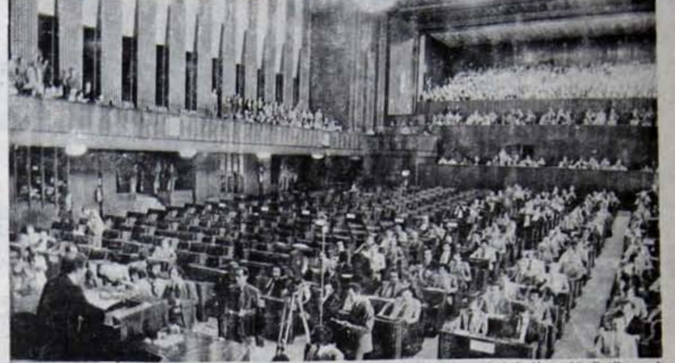
Seçim yasa tasarısı, parlamentoyu burjuva partilerinin yarışma plati haline dönüştürmeyi amaçlıyor...

* "Önerilerin asıl önemli ve sonuçları etkileyici bölümü, şu anda yürürlükte olan siyasal - toplumsal durumun güçlenmesini ve süreklilik ka-