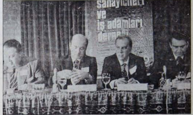
TUSİAD'ın hükümete dayattığı ekonomi politikası, devlet denetiminin piyasa mekanizmasına terk edilmesini öngörüyor...

macasının ve "dış yardıma dayalı planlı kalkınma stratejisi"nin gerçek niteliğini sergilemekte, bu politikaların iflasını vurgulamaktadır.