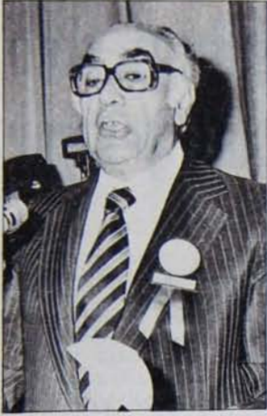
Hükümet karşısında büyük sermayeyi temsil eden Odalar Birliği devalüasyonu kaçınılmaz görüyor...