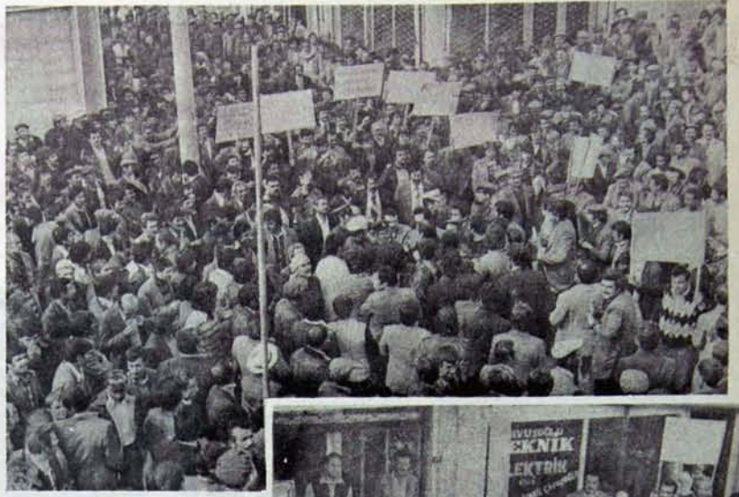
Başbakan Ecevit ve partisi bütün emekçilerden esaslı bir cevap almaya hazırlanmalı

1190 sayılı Tütün Tarım Satış Kooperatifleri Yasası ise, yalnızca bir yasa olarak duruyor, yaşama geçirilmiyor. 1190 sayılı yasa yaşama geçirilmediği içindir ki, kurulduğundan bu yana ilk kez toplanmış olan Millî Tütün Komitesi'nde üreticilerin gerçek kuruluşu olan Tütün Tanım Satış Kooperatifleri temsil edilemedi. 1190 sayılı yasanın yaşama geçmesinin engellenmesinin diğer iki nedeni ise; Tütün Tanım Satış Kooperatifleri'nin tütün ihracatı yapan 50 kadar tüccarın elinden bu hakkı alacak olması ve Koo-