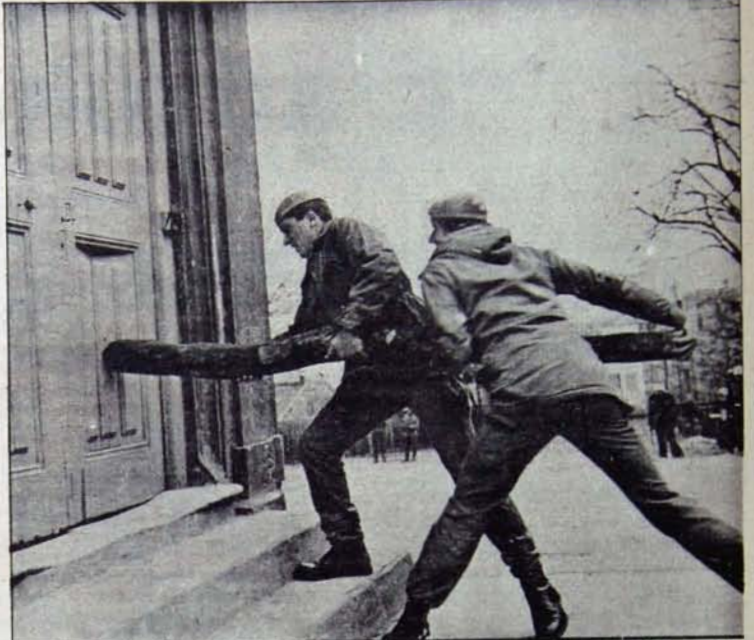
Demokratik hakların kısıtlanmasını yine demokratik güçler eliyle meşrulaştırma çabalarına izin verilmemeli!

Bu taktiğin, yalnız hükümeti değil, aynı zamanda ülkedeki demokratik mevzi ve kazanımları nereye götürebileceği, bugüne kadarki deneyimlerle ortaya çıkmıştır. Demokratik güçlere, antidemokratik, gerici, faşist odaklara "iyi geçime" politikası karşısında rehavete kapılmak değil, son derece uyanık olmak görevi düşmektedir. Demokratik hak ve özgürlüklere yönelen sınırlamaları ılerici ve demokratik güçler eliyle meşrulaştırma çabalarına olanak tanımamalıdır.