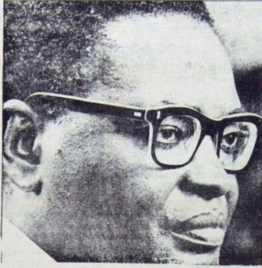
Agustino Neto: Devrimci Angola emperyalizmin provokasyonlarını boşa çıkarıyor.

Kuzey Yemen'in Demokratik Yemen'e saldırısının Çin'in sosyalist Vietnam'a saldırısıyla aynı zamana rastlaması da bir rastlantı değildir. Her iki saldırı da emperyalizmin zayıflayan konumlarını onarmak için başlatılmış genel bir provokasyonlar zincirinin parçalarıdır.