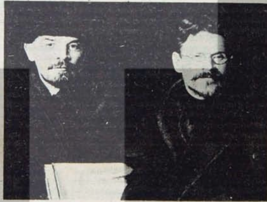
Üçüncü Enternasyonal'in kurucusu Lenin, Sovyetler Birliği'nin ilk devlet başkanı Kalinin ile

Komintern, İspanya Cumhuriyeti'ni faşist Franco kuvvetlerine karşı savunmak için oluşan ulusalarama dayanışma için de öncüllüğü elinde tuttu. 54 ülkeden gelen 35 bin antifaşist gönüllü İspanyol yurttaşlarının yanında çalıştı. Komintern'in