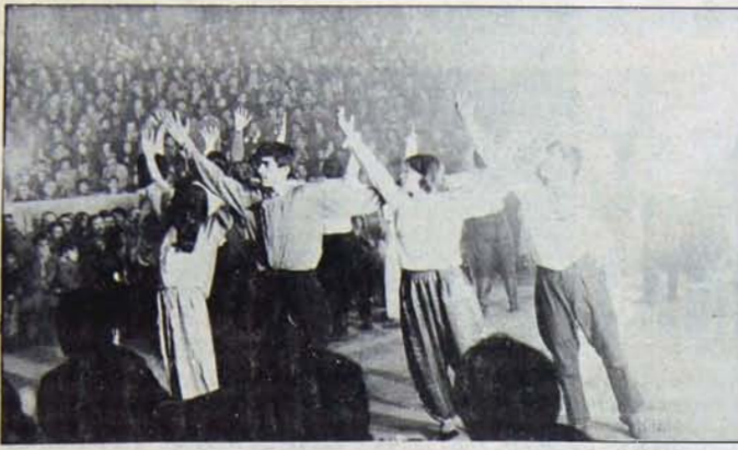
İşçi Kültür oyuncuları TİP Kongresinde Şeyh Bedrettin'i sergiliyor.