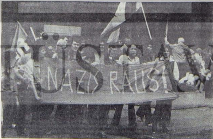
Essen'de anti-faşist gösteri: "NAZİLER DEFOLUN"

Bilindiği gibi, faşizm tarihsel olarak, kapitalizmin emperyalist aşamaya girdiği, ilk sosyalist devletin kurulduğu ve tüm Avrupa'da işçi sınıfı hareketlerinin bilimsel sosyalist bir nitelik kazandığı dönemde ortaya çıktı. Neo-faşizmin ortaya çıkmasını hazırlayan ve serpilmesine olanak veren tarihsel ortam biraz daha farklıdır. Bir kez, neo-faşizm, İkinci Dünya Savaşı'nda saldırgan faşist devletler yenilgiye uğradıktan sonra ortaya çıktı. Bu anlamda, geleneksel faşizm ile neo-faşizmin aynı kesintisiz çizgi üzerinde yer aldığı söyleyemeyiz. İkinci Dünya Savaşı'nda faşizm yenilgiye uğratan güçlerin başında Sovyetler Birliği geliyordu. Ama, hemen onun yavaş yavaş ABD ve İngiltere vardı. Başta bu iki emperyalist ülke olmak üzere İkinci Dünya Savaşı ertesinin tüm kapitalist devletlerinin "Faşizm"e karşı duydukları öfke, Almanya'nın yenilgiye uğratıldığı anda sona erdi. Faşizme karşı duydukları öfke sona erdiği gibi, ona gereksinimleri de ber geçen gün çoğaldı. Neo-faşizm Dosyası'nda ele alınan ülkelerin hemen hepsinde neo-faşist örgütlerin savaşın sona erdiği yıl olan 1945 ya da en geç 1946-47