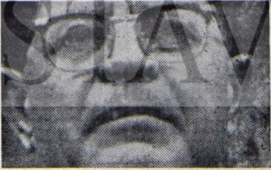
Kostas: Cuntanın elit adamlarından...

Cunta lideri Papadopoulos geçmişi Yunan gizli istihbarat örgütü olan KYP ile CIA arasında bir tür irtibat subayı görevi yapmıştır. Bu niteliğinin cuntanın başına geçmesinde büyük payı olduğunu söylemek yanlış olmaz. 21 Nisan 1967 sabahı Atina sokaklarında devriye gezen güvenlik güçlerinin yanı sıra özel gysileri içindeki 4 Ağustos Hareketi üyesi neo-nazilere de rastlanmaktadır. Bu sırada örgütün başında Ladas ve Konstantin Plevris vardır. Bu adamların işleri ise, askeri polis örgütünün şefi general Yuannidis'in ellerindedir. Yuannidis cunta yıllarını güçlü adamı olacaktır.