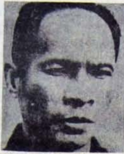
Halk devrim Konseyi Başkanı Heng Samrin

Neo-faşistler, emekleyerek de olsa demokratik yolda ilerleyen Yunanistan'ı bu yoldan çevirebilmek için her şeyi yapmaya kararlı görünüyor.