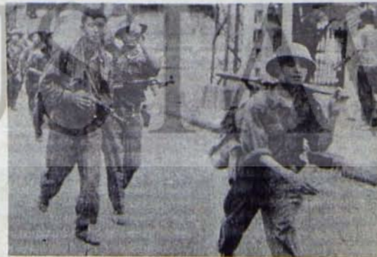
Kamboçya'nın ikinci zaferini de silaha sarılarak kazandı...

Kamboçya'da Ulusal Cephe'nin ve Halk Devrim Konseyi'nin zaferi, ülkedeki bütün yurtsever güçlerin ve Kamboçya halkının desteğine dayanmaktadır. O nedenle, bu zaferin geri alınması ve Kamboçya toprakları üzerinde gerici rejimin canlandırılması için girişilecek tüm komplolar başarısızlığa mahkumdur.