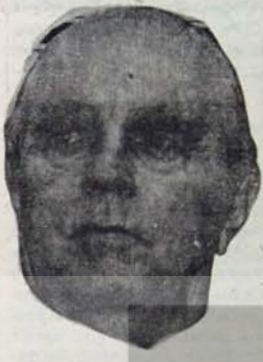
Karamanlis: Faşist güçlerin eskimeyen hamisi...