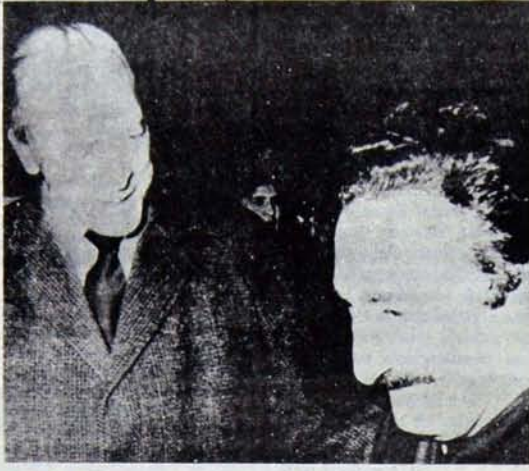
Ecevit Christopher'la: Hangi pazarlıklar?..

Bonn toplantısına 'arayipler' dedi Guadeloupe Adası'nda yapılan sanayileşmiş dört batılı ülke doruğunda biraraya gelen Birleşik Amerika, İngiltere, Federal Almanya ve Fransa'nın ekonomik konulara görevli yüksek düzeydeki yetkilileri katılacaktır. Toplantıda, Türkiye'ye yardım sağlanması için izlenecek olan yolun planlaması yapılacaktır. Basına sızdırılan haberlere göre, Bonn'da Türkiye'nin yalnızca kısa devreli gereksinimlerinin değil, daha uzun süreli gereksinimlerinin de karşılanması için bir sistem bulunmasına çalışılacaktır. Birleşik Amerika Dışişleri Bakan yardımcısı Warren Christopher, geçtiğimiz hafta sonunda Ankara'da yaptığı görüşmelerde, Türkiye Hükümeti'nin bu konudaki görüşlerini almıştır. Warren Christopher, Ankara'dan Washington'a dönerken, kısa bir süre Bonn'a uğrayarak Federal Alman yetkilileriyle görüşmüştür.