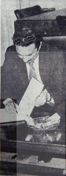
Yeni baskı reçeteleri Ecevit'in imzasını bekliyor...