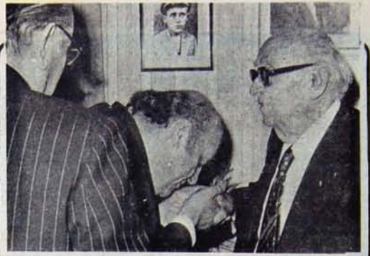
"Kıç geldi. Komünizm bekleniyor!"