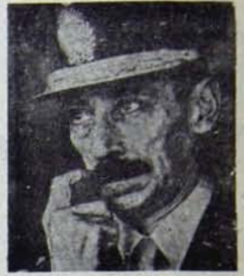
Videla: Arjantin'de faşist rejim moral şırıngasıyla yaşıyor.

Bugün Latin Amerika faşizmin çizmesi altında bulunan acıların içinde bir kıta durumunda. Kapitalizmden sosyalizme geçiş olgusunun belirlediği çağımızda henüz ayakta duran tekelci kapitalizmin güvenebileceği son kalelerden biri. Latin Amerika ülkelerindeki faşist hareket ve yönetimlerin en önemli özelliği doğrudan doğruya İkinci Dünya Savaşı öncesinde Avrupa da kurulmuş olan faşist ve nazi devletlerin bir uzantısı olması.