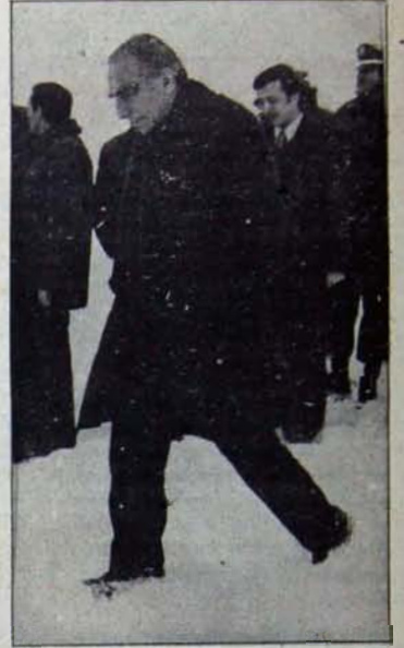
Başbuğ'un "felsefesi", insanlara boyun eğmeyi ve köleliği öğütleyen gerici burjuva filozoflarından kaynaklanıyor.

Faşistlerin "yeni" olarak bir takım "felsefi görüşler" öne sürdüğü, ancak bunların "yeni" olmadığı vurgulandı. Nasî faşizm tekelci kapitalizmin dışında di-