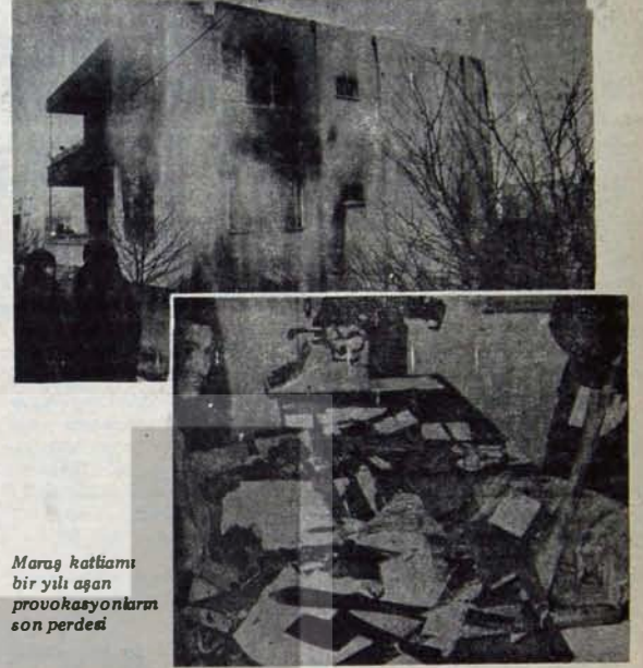
Maraş katliamı bir yılı aşan provokasyonların son perdesi

Böylesi bir provokasyonun büyük boyutta tezgahlandığı ilk kent Malatya oldu. CHP hükümetinin kuruluşunun ilan edildiği 5 Ocak günü Malatya'da Tekel ve Sümerbank fabrikalarında MHP ve MSP eğilimli oldukları bildirilen 300 kişi işçi olarak alınıyor ve bu uygulama kentin ilerici halkı-