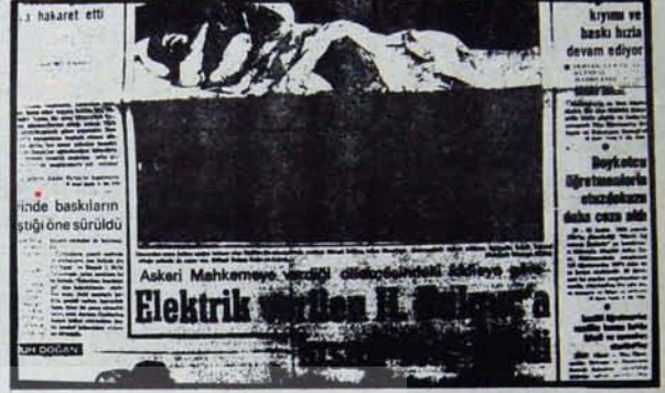
"Sıkıyönetimin anayasal demokratik hak ve özgürlükleri fiilen ortadan kaldıran bir yönetim biçimine bürünebildiği yakın tarihimizde görülmüştür."

Bilinmelidir ki, demokrasi mücadelesi, yalnızca yasaların çerçevesi içerisinde tutularak ele alınmaz. Demokratik hak ve özgürlüklerin özünü sınırlayan, onun çerçevesini daraltan yasalar, toplumsal mücadelenin nesnel gelişimi ile aşılır. İşçileri, emekçileri ve demokratik güçleri, kısacası, toplumun ezici çoğunluğunu hedef alanlar, onların dış sökersesine kazandı-