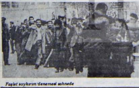
Faşist soykırım denemesi sahnedir

Kahramanmaraş olaylarında resmi açıklamalara göre 110'u aşkın yurttaş hayatını kaybetti. İlerici işçi ve emekçilerin evleri yakıldı, yıkıldı, yağmalandı. Tam beş gün bir barut fıçısı halinde bekleyen Kahramanmaraş'ta, daha önce bir önlem alınmasından yararlanan faşist güçler rahatlıkla istediklerini gerçekleştirebildiler. Faşist ayaklanmanın tam anlamıyla bastırılabilmesi için ise aradan bir beş gün daha geçmesi gerekecekti.