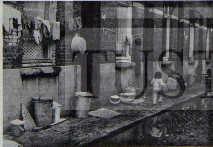
Belçika maden bölgesindeki Türk getto'ları

TIKM sözcüleri, Belçika bannuna açıkladıkları istekleri bir daha tekrarlıyorlar: