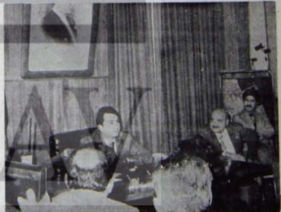
Baykal, Çorum Belediye Başkanlığında

Enerji ve Tabii Kaynaklar Bakanı Deniz Baykal'ın Çorum'a geleceği ve TKİ Alpagut-Dodurga Linyitleri İşletmesinde incelemelerde bulunacağı öğrenilince