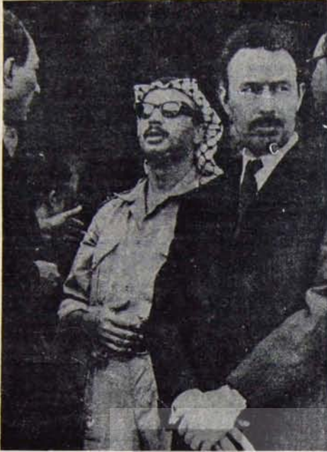
Bumedyen: seçkin bir bağımsızlık savaşçısı

Zamanımızın etkin politik liderlerinden, halkının yiğit evladı, seçkin bir bağımsızlık savaşçısı, Cezayir Devlet Başkanı Huari Bumedyen 27 Aralık günü öldü.