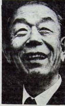
Fukuda: Liberal-Demokrat hükümetler Japon neo-faşistlerin umudu.

Japonya'da 1967'den sonra, faşistlerin içinde bulunduğu tüm terörist eylemlerde Bin Aka'o'nun adamlarının parmağı ya da en azından katkısı vardır. 1973 yılında yapılan eğitim sendikaları kongresine saldıran Aka'o'nun komandoları birçok delegeyi ağır yaralamışlardır. 1975 yılında ise, bir cenaze töreni sırasında başbakan Takeo Miki, Hiroşoşi adlı faşistin saldırılarından raslanı sonucu kurtulabilmiştir. Aka'o'nun örgütünün mali kaynakları içinde en önemli kalemi