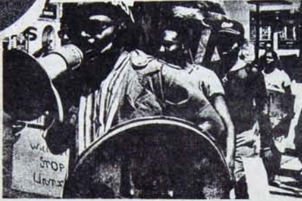
Hitler'i ABD emperyalizminin çıkarlarına uyarlayan neo-faşizmin harçında tüm emekçiler yer alıyor.

Amerika Birleşik Devletleri'nde varolan neo-faşist örgüt, grup ve fraksiyonların tümünün adlarını ve etkinliklerinin birer birer sıralamak bu yazının boyutları dışındaki sınırlarda olanaksız ve aynı zamanda gereksiz bir uğraştır. Bu yüzden Amerika Birleşik Devletleri'ndeki neo-faşist örgütlerin başlıcaları üzerinde durmakla yetineceğiz. Bu örgütler hakkındaki bilgiler Amerika Birleşik Devletleri'nde adeta cirit atan, tüm diğer benzerlerinin içinde bulunduğu duruma da bir ışık tutacaktır.