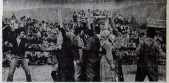
Emekçi hitlerle tiyatrodan toplumsal kurtuluş mücadelesinin işçiyi yasatmasını bekliyor.

Bugün Devlet Tiyatrolarının ücretleri iki misline çıkmış olmasına rağmen, günün koşullarına oranla oldukça ucuzdur. Eskiden on lira olan biletler, şimdi yirmi liraya satılmakta. İzçilere, öğrencilere, öğretmenlere yüzde elli indirim yapılmakta. İşlevlerini yerine getirirken, pa-