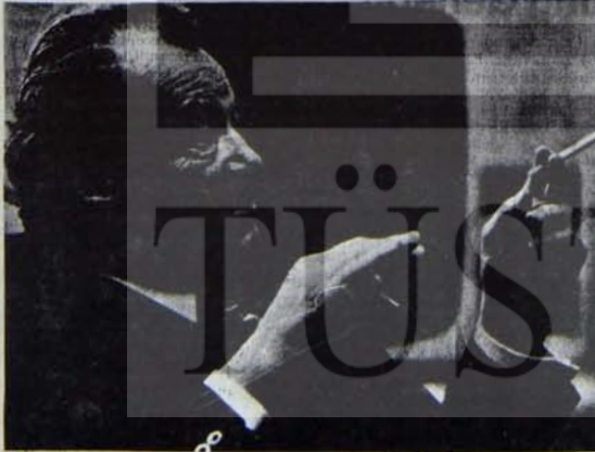
Brandt: Sosyalist Enternasyonal'in yeni döneminde yeni sorunlar

Türkiye'nin dış politika sorunları son günlerde fazlaştı. Türkiye dış ilişkilerinde tam bir çıkmaza girdi. Dış politik etkinlikler, diplomatik trafik son haftalarda birdenbire çok yoğunlaştı. Ancak bu alanda hükümetin eylemleri eskisi kadar çekici olmuyor. İlgili uyandırmıyor. Nedenlerden bir tanesi hükümet ve Başbakan Ecevit dış politika alanını ilk günlerde olduğu gibi, kendisine halk kitleleri arasında destek sağlamak için kullanmakta eskisi kadar istekli gözüküyorlar. Çünkü çıkarılacak söz konusu olduğunda kendi sınıfsal çıkarları da buna elverişliymiş.