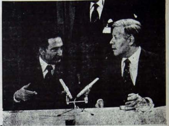
Ecevit Schmidt'te: Kapitalizmi "kurtarmak" için NATO merkezlerinde koçkolo

Önce bir noktaya çok açık belirtmekte yarar var. Tartışmanın, CHP'nin