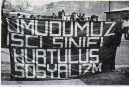
7 TIP üyesinin katılmayı protesto eden Zonguldak MTA işçileri

Kaldı ki, ara ve yatırım malları ile teknoloji açısından dışa bağımlı Türkiye sanayinin hracatına yönelik bir strateji izleyebilmesi, yurt içinden sağladığı gelirleri daha ucuza temin etmesi ve ücretleri düşük düzeyde tutmasını "başlıdır. Tekelci burjuvazinin, desteklenmesi ve kamu iktisadi teşebbüsleri hakkındaki eleştirileri ile işçi sınıfının ekonomik ve politik hareketini zayıflatmaya yönelik isteklerinin temelinde bu olgu yatmaktadır.