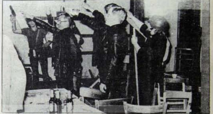
Fanatik Hitler hayranları Führer'in anısını sürdürmek için toplu gösterilerinde 'Heil' iğareti kullanıyorlar.

Hitler faşizminin yıkılmasından sonra, Almanya'da, Alman halkını ve tüm dünyayı sosyal-sosyalizmden kurtarmak için başlatılan, nazizmin kahntılarının temizlenmesi girişimlerinin, "batı cephesinde" başarısızlık sonuçlandı; bugün açıkça görülüyor.