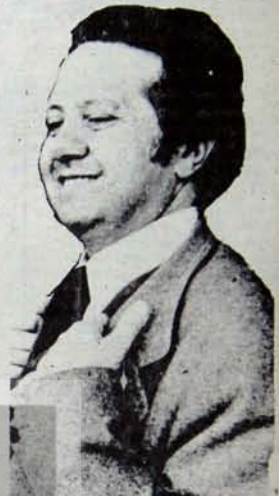
Sources: Sosyalist hükümet neo-faşist ör-gütlerine meydan boş bıraktı

Birçok Batılı haberalma örgütünün desteęinde, Portekiz'de neo-faşist ajan-ların sürdürdüğüleri, demokratik rejimi hedef alan oldukça ciddi faaliyetlerine karşı hükümetin ılgısız tavrı - en hafif deyimle - eşarşıtıydı. 26 Nisan 1974