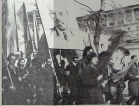
Sovyet emekçileri 61. yılı da ülkenin bütün hoşelerinde coşkuyla kutladılar.

"Bu doğrultularda işbirliğimizin gelişmesi Sovyetler Birliği'yle Türkiye arasında dostluk ve karşılıklı güven havasının daha sağlamlaşmasına ve dolayısıyla Helsinki anlaşmalarının tümüyle gerçekleştirilmesine yardım edecektir."