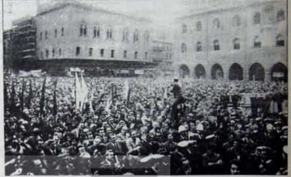
İtalya'da neo-faşist hareketin saldırılarına karşı tek güvence: İşçi sınıfının öncülüğünde emeçli kitlelerin birliği

FAŞİST HAREKET İTALYA'DA DAHA 1944'DE HORTLADI. 1944'ÜN "MUSSOLİNİ EYLEM BİRLİKLERİ" NİN LİDERLERİNDEN GİORGİO ALMİRANTE DAHA SONRA İTALYAN SOSYAL HAREKETİNİN BAŞINA GEÇTİ. BUGÜNKÜ İTALYAN NEO-FAŞİST HAREKETİNİN STRATEJİSİ, GERGİNLİĞİN ARTIRILMASINA VE TERÖRİZME DAYANIYOR. BU, GERGİNLİKTEN MEDET UMAN HİSTİYAN DEMOKRATLAR TARAFINDAN DA DESTEKLENİYOR. CIA, DINA VE SAVAK MSİ'NİN FAALİYETLERİNDE BELİRLİ "ROL" OYNUYOR.