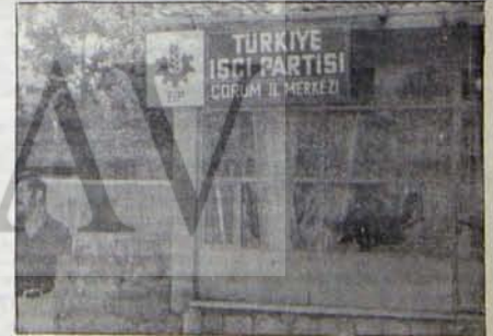
TIP Çorum İl örgütü binasının feşistlerin bundan önceki bir saldırıdan sonraki durumu

Emniyet Müdürlü'nün bu tutu- mu, demokratik güçleri faşist