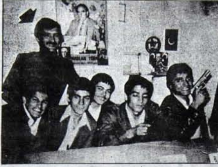
Bu silahlar kaç yurtevere ölümlü kustu!

mas, rayından çıkarılması gerekiyor. Bu işi de, başta bizzat gene Hürriyet yükledi.