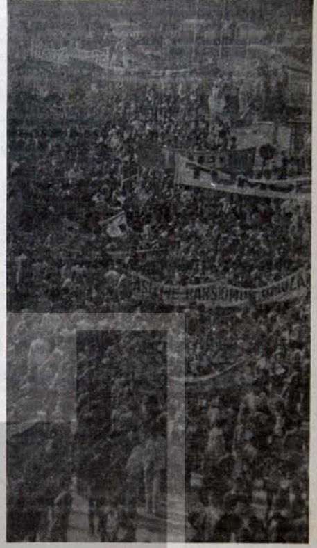
Öğretim üyeleri görev başında.

○ Üniversitenin, kendi içinde demokratikleşmeyi başardığı söylenemez. Ülkemizde, hâliâ, ODTÜ gibi birkaç kurum dışında öğretim üyesi sayılmak için en az 'üniversite doçenti' olmak gereklidir ve üniversite yönetimine, öğretim çalışmalarını doktoraşını tamamlamış akademik personelin katılması sınırlı tutulmuştur. Oysa günümüzde, çok hızlı bir bilimsel ve teknolojik değişimin olduğu, bunun yalnız izlenmesinin değil toplumsal koşullarla bileşimlerinin ortaya çıkarılması gerektiği ve bu süreçte genç öğretim elemanlarına olan gereksinim yadsınmaz. Akademik başarının göstergesi, belli zaman aralıkları ile alınan ünvanlar olmamalıdır. Kastlaş-