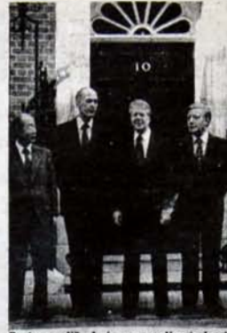
Carter ve diğerleri; emperyalizmin beyin tröstünün mimarları