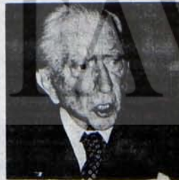
Paul Getty: Üçlü komisyonun ardındaki mülti milyonerlerden birisi.

Tüm bunları yaparken temel amaç, Brzezinski'nin iki yıl önce Foreign Policy Dergisi'nde yazdığı gibi, "düşman kamplara bölünmüş dünyada ABD'nin yalnız kalmasını ne bacasına olursa olsun önlemek"tir.