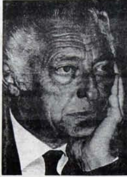
Agnelli: Avrupa Konferansında birini isim.

Bu, "trilateralizm" (üç yanlılık) strateji planıdır.