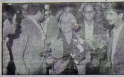
TIP Genel Başkanı Boran Esenboğa'da karşılanıyor