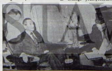
Özyadını kafasıdır bu tablonun halısı

Bu misyonun önde geleni "Hürriyet" gazetesinin provokasyon, kıskırtma taktikleri doruğa varmıştır.