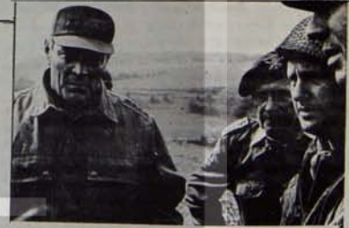
General Haig: Nötron yapımı için yuzuz yaseen tetva çıktı.

Nükleer çalışmalarını ve denemelerini yol açtığı radyoaktif kirlenme günümüzde henüz ölümcül boyutlara ulaşmamıştır. Ama bu konudaki son araştırmalar, mevcut kirlenmenin, canlı organizmalarda yüzlerce, binlerce kez arttığı göstermektedir. Yani radyoaktif kirli canlıların vücudunda büyük bir artış göstermekte ve bunun sonucunda