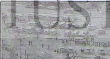
Tahsisli yol tetelağını karmaşa: Kitlelerin gözüne girmekten boğuşma bir çaba daha

Faşistlerin şehrimizde terör estirmelerinin nedeni tabanlarını kaybetme kaygısından kaynaklanmaktadır. MHP son genel seçimlerde ilimizde 51000'in üzerinde oy aldı, ancak bu oyların çoğunluğu faşist demagogilerle aldatılmış, kırsal kesimin aldatılmış orta tabakalarından, yoksul ve işsiz kesiminden oluşmaktadır. Bu oyların çok az bir miktarı kemikleşmiş faşist militanlar tarafından. Buna yerel seçimlerde MHP'nin 26000 civarında oy almaması doğrulamaktadır. HC hükümetinin değişmesiyle büyük kapasiteli işletmelerde çalışmaz hale gelen, MHP aracıları ile işe