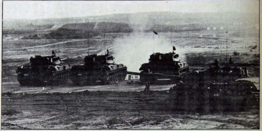
NATO: Sosyalizme ve barışa karşı en açık terörcü saldırıların olduğu kadar ideolojik saldırıların da birinci kaynağı