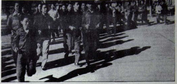
Çin işçi sınıfı ve emekçi kitleleri, sosyalizmin kazanımlarını yeniden egemen kılacaktır.

ney Amerika ülkelerine devrim ihraç edilmesini savundu, bu kıtalardaki maceracı eğilimlerden yana çıktı. Sovyetler Birliği'ni buralardaki devrimci hareketleri yeterince desteklememekle, giderek devrimci ihanetle suçladı.