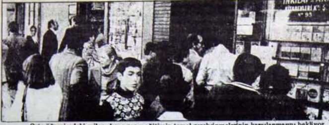
Orta öğrenimdeki milyonlarca genç, eğitimin temel gereksinimlerinin karşılanmasını bekliyor.

den düşülen yanlışlara meydan vermemek gerekiyor. Şurası artık herkesçe görülebiliyor. Hızla politize olan öğrenci gençlik, artık yalnızca içinde bulunduğu 'özel' in sorunlarıyla değil, ülke düzeyinde, içinde yaşadığı düzenin yarattığı sorunlarla da ilgileniyor.