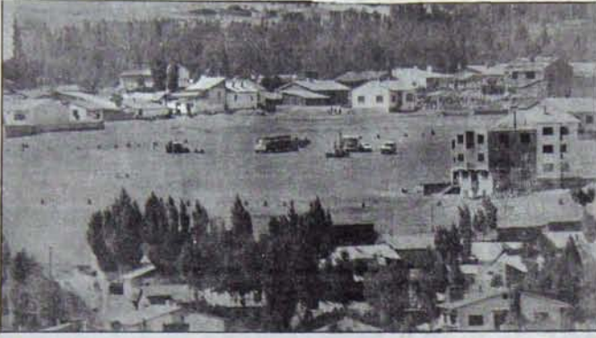
Faşist saldırıya hedef olan illerin değişmez görüntüsü: Korku ve ıssızlık.