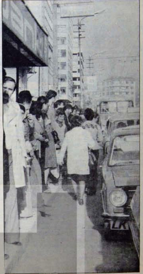
Emperyatme bağımlı geri kapitalist işleyişin kaçınılmaz sonucu olan zamlar, bunalımın faturasını emerkî halkın sırtına yüklemeli gilevini görüyor.

Son zamlarda, TRT'nin kendisinden aldığı bilgiye göre açık-