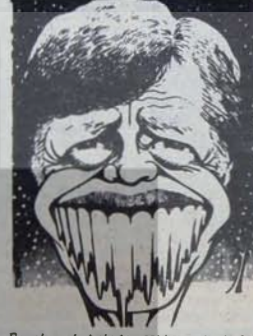
Esnek mukabeleden saldırı yoluyla savunmaya.

yor ve dünya halklarının "beklenmedik uyanışının" toplumsal sakineler yarat- tığını söylüyor.