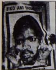
Vorster rejiminin işkence zindanlarında can veren Steve Biko'nun anısı, ırkçılığa karşı mücadelenin bayrağında yaşıyor.

Genel olarak bakıldığında, Çin yönetimi Asya'da hegemonyasını kurabilmek için elinden geleni yapmaktadır. Afganistan'da gerçekleştirilmeye çalışılanlar, Pekin'in diplomatik ilişkiler görüntüsü altındaki, yayılmacı politikasının bir ifadesinden başka birşey değildir. Çin gizli servislerinin Çin'e komşu ülkelere yasal hükümetlere karşı her türden karşı devrimci gruplara, etnik ve milliyetçi azınlıklara para ve silah yardımı yaptığı biliniyor. Bu doğrultuda bir örnek Hindistan'da hükümet karşıya çıkan Mizo ve Naga kabilelerine sağlanan destekler. Bunların yanında Burma ve Filipinler'e saldırı ve en önemlisi Vietnam'a karşı sürdürülen silahlı saldırılar yoğunlaşmaktadır. Bu eylemlerin amacı açıktır: Çin, komşularını sürekli tehditlerin bir ortamında tutmak ve böylece ortaya çıkacak olan yığınlık ortamında kendi hegemonyasını kurmak istemektedir. Bütün bunlara Çin'in komşularına yaptığı toprak talepleri eklenirse gelişmelerin nereye doğru gittiği anlaşılır. Çin Asya'da egemenlik kurmak, Üçüncü Dünya ülkelerinin lideri gibi gözükme amacındadır. Bu amaçla da resmi olmayan bir takım adımlar atılmıştır. Çin'in komşularını Çin toprakları içinde gösteren "tarihi" haritalar bile yayınlanmıştır. Bu, hegemonya planlarının açık bir göstergesidir. Afganistan olayı da bu olgunun diğer bir yönüdür.