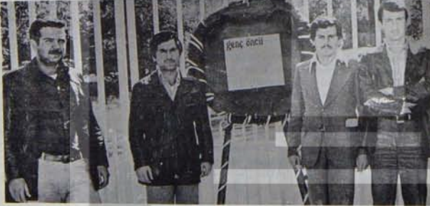
Genç Öncüler, Şah'a girin gözükmeye çalışanların bütün engelleme girişimlerine rağmen, İran'lı kardeşleriyle dayanışmayı sürdürecektir.

Ülkemizin tüm demokratik, ilerici güçleri faşist diktatörlüğe karşı direnen İran halkı ile etkin bir dayanışmaya girmeli; Türkiye CENTO'dan çıkmalı; SAVAK'ın, CIA, MIT, İsrail gizli servisleri ve benzerleri ile serbestçe işbirliği yapmasına engel olunmalı İran'ın faşist yönetimi BM'de ve diğer uluslararası kuruluşlarda resmen kınanmalıdır.