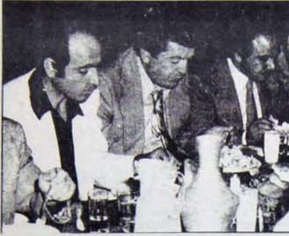
CHP'li Belediye Başkanı, MHP Kayseri İl Başkanı'yla oruç bozuyor