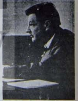
Z. Brzezinski: Soğuk savaşçı şahinle- rin başı.

Ama tüm bunlar, emperyalizmin güc- lü olduğu günlerde uyguladığı taktiklere