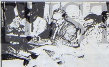
Sadıklar, kime göz kırpmıyor?

Görünürde CHP'nin gadrine uğramağa aday bu zat, acaba hâttâ niçin elinde "biraz" da ol- sa halka açık CHP hıse senedi bulundurmağa çalışıyor dersin- iz? Niçin acaba?