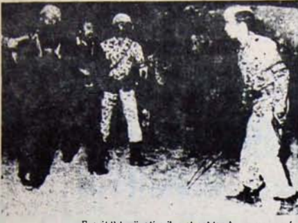
Ecevit Sıkıyönetim ilan etmekten kaçınıyor muş.

ve Van'da yarablan olayların dayandığı temeller daha iyi değerlendirilecektir.