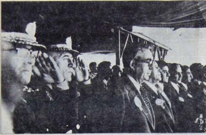
Feziyoğlu: "Geniş tabanlı" bir çözüme doğru çark...