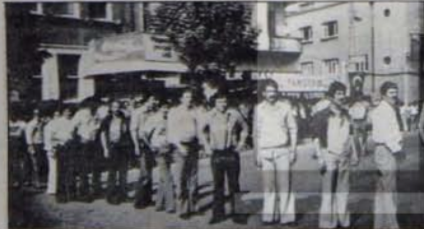
Tensikat hesapları 30 bin işçiyi hedef alıyor.

Geçtiğimiz hafta Türkiye'ye OECD Genel Sekreteri Van Len- nep, "fırsat bu fırsattır" örneği çantasında Türkiye'nin Enerji Ajansına tam üyelik konusunu getirmişti. Batının fiilen ve do- zunu artırarak sürdürdüğü ekono- mik ambargonun kısıcından Türkiye'ye Enerji Ajansına üye- lik konusunda son imza da atıl- rılmaya çalışılmaktadır.