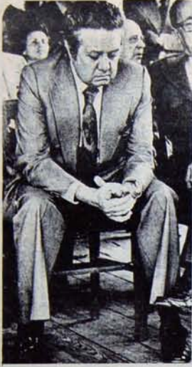
'Soares "ben Allende Jmak isteniyorum" dedi ve IMF'ye teslim oldu. Tarih Allende'den daha onurlu bir yere gelmediğini yazacak.