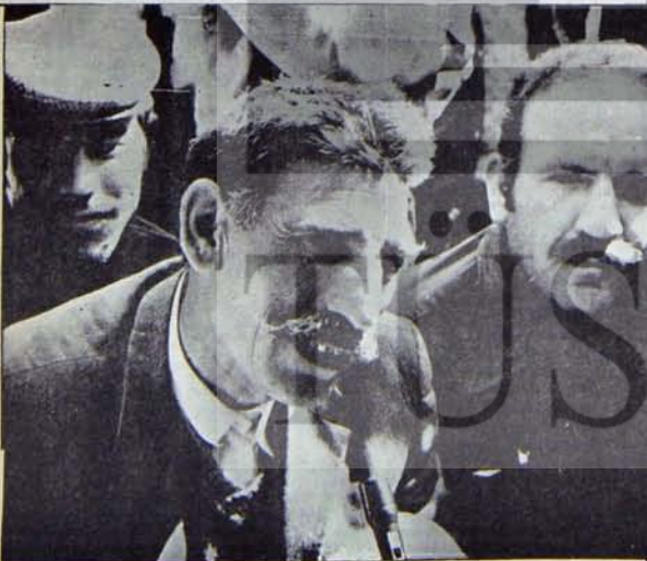
Eğy emekçileri köklü bir toprak reformunu ve kendi kooperatiflerinde birleşmeyi istiyor.

Sorunun köklü çözümü küçük toprakları optimal büyüklüklerde toplayarak yapılacak köklü bir toprak ve tarım reformu ile, toprak dağılımının olumsuz etkilerini ortadan kaldıracak ve kooperatifleşmeyi tezyük edecek olan destekleme alımları politikasıdır. Bu, aynı zamanda gelir dağılımını etkileyecek, tarımsal üretimin planlanması işi yapılabilecek girişimlerde destekleyici olacaktır. Bunun dışında, çok parlak olarak tanımlanan destekleme politikası boşlukta kalmaya mahkum olacak, büyük üreticinin desteklendiği (vezi) çözümlenmektedir.