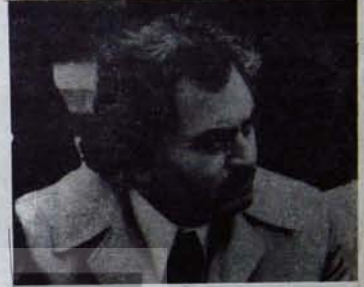
Görünüşteki ayrışık, haderde, kuançta ve tasadahi birliği gizley