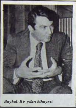
Baykal: Bir yılan hikayesi