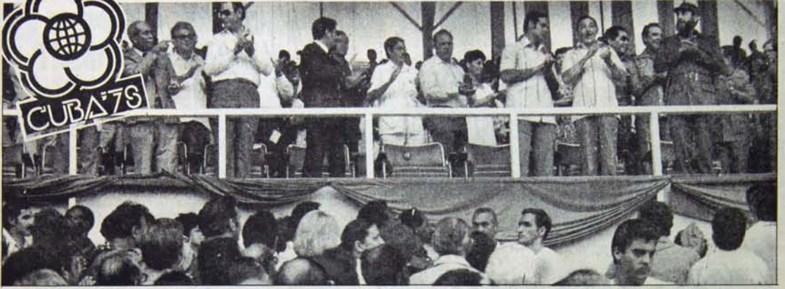
Castro: "Gençler, halklar ve insanlar arasındaki kardeşliğin en yüce fikirlerinin sönmeyen ateşi gözlemlerinde yanan insanlardır."