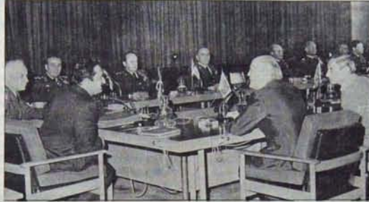
Demokrasi anti-demokratik yollardan korunamaz

"Emperyalizmin içinde kuvandığı ekonomik bunalımın etkileri emperyal-