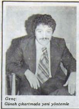
Genç: Günah çıkartmada yeni yöntemle