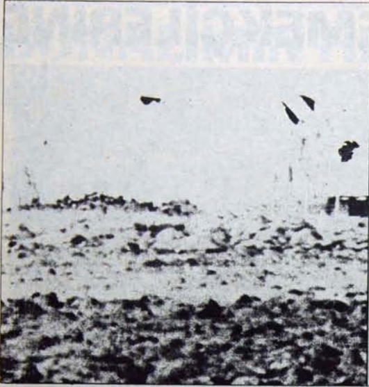
Amerikan saldırı ve casusluk işleri kapatılmadı.