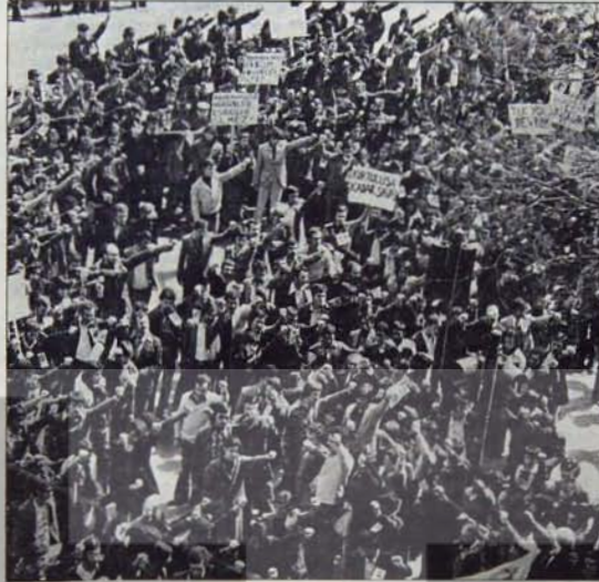
İlk kez trajedi, ikinci kez komedi

Tek ve aynı "dünya görüşü"nin temsilcisi olan bir hareketin safalarında, 1975'ten itibaren, sayısı 4'ü, 5'i çok aşan çok partililerin ve ayrı baş çekmelerin ortaya çıkmasının baş nedeni, söz konusu