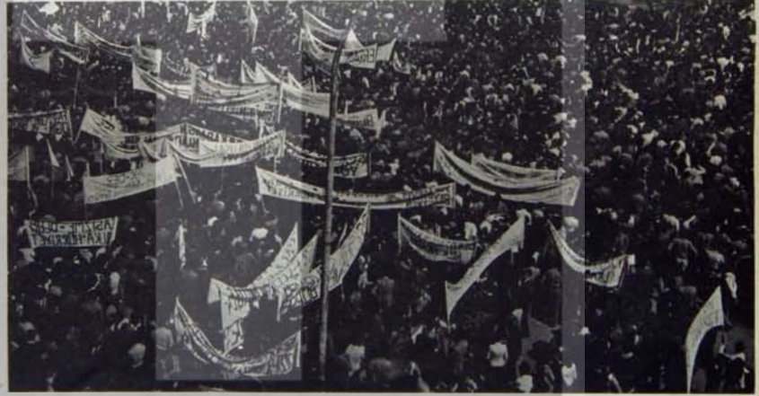
Tarih hiçbir gücün kitlelerin örgütlü gücü önünde duramadığını göstermiştir.

muşluğunda, hatta bazan zengin deneylere rağmen, işçi sınıfı biliminin dışında, küçük burjuva karakterli düşünce ve uygulamaların getirdiği yanlışlar sadece deney kazanma ile aşılamaz. Deneyler birlikte, mücadelenin sınıfsal karakteri hakkında gelişen daha fazla netleşmeye ihtiyaç vardır. Bu netleşmeyi sağlamak üzere, bir yandan örgütlü birleşik mücadele verilirken diğer yandan da bilimsel sosyalistlerin sürekli olarak ideolojik mücadeleyi sürdürmeleri gerekir. Somut adımlarda belirginleşen yanlışların ideolojik temellerine vunnak gerekir. Böylelikle hem küçük burjuva devrimciliğine karşı gereken ideolojik mücadele verilir, hem de örgütlü birleşik mücadelenin gerek istekleri yaygınlaştırılır.