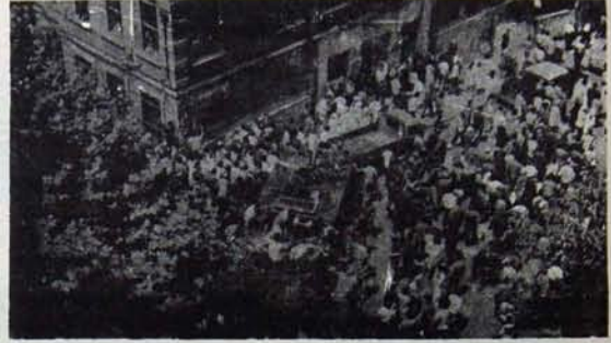
Dün yetiçenler, bugün görev başında

Bugün küçük burjuva sosyalizmini ağız değiştirmeye zorlamak için yeni 15-16 Haziran'lara gerek duyuluyor. Onlar "günün gereklerini" acemice de olsa dile getirecekler.