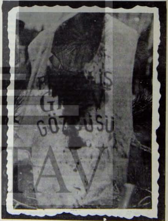
İşçilerin hedefi: Kana bulanmış grev gömleği

"Türkiye'nin uyanık güçleri, kemalist devrimden yana olan tüm halkımız, emekçilerimiz, çağdaş uygarlığa yetişmek çabasındaki insanlarımız, tek umut, tek güven, tek güç saydıkları Ecevit iktidarının yanındadır." (Oktay Akbal, Bu Hükümet 1981'i Bulur, Cumhuriyet 8 Haziran Perşembe)