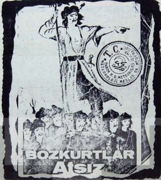
İşte Meslek Lisesi kitaplığını sıslayan "büyük" yapıtlardan biri

Sahibi: Yuruyus Yayıncılık Ltd. Şti. editör: Nihat SARGIN © Genel Yayın Yönetmeni: Zeki KILIC © Yazı İşleri Müdürü: Metin CULHAOĞLU © Teknik Sekreter: Bülent ARTAMLI © Yönetim: Konur Sok. 15/8 Katlıy - ANKARA Tel: 17 45 81 © İstanbul Bürosu: Piyeroli Cad. 21/1, Camberitias - İSTANBUL, Tel: 26 35 67 © Abone Kosulları: Yıllık 200, 6 aylık 100, TL. Avrupa, 6 aylık: 250 TL., Yıllık: 500 TL., Amerika: 6 aylık 325 TL., Yıllık: 650 TL., Avusturya - Japonya: 6 aylık: 400 TL., Yıllık: 800 TL. © Posta Çeki: YOROYUS Derneği 100234 © İlan Kosulları: Arkık Kapak (Renkli) 15.000 TL., Arkık Kapak (Siyah beyaz): 12.000 TL., İc ayırlarında süren satımı: 40 TL., Yayın İlanları % 50 İndirimi'dir. © Basıkı: Daily News-Offset İcalsleri ©Kapak:UŞUR OKMAN