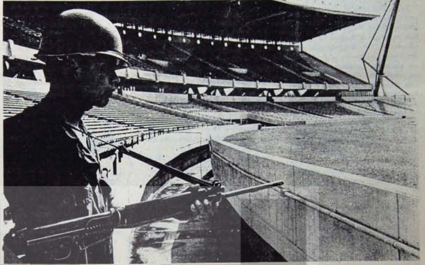
Futbolun unutturduklarını hatırlatalım

Arjantin toplumsal yapısının ilk özelliği tarımda toprak mülkiyetinin giderek yoğunlaşan bir oligarşinin, landfundistlerin egemenliğine yol açması. Bu yapı, üretimde verimliliği, çok düşük tutuyor. Elli yıl öncesinin düzeyinde. Öte yandan Arjantin'de gelişen bir kapitalizm de söz konusudur. 1930'lara kadar Arjantin'de kapitalizmin gelişmesinin temelinde üç etken yatmaktadır: birincisi, tarım kesiminin (tahıl, et, yün) ihracat olmaları; ikincisi, önemli miktarda Avrupa kökenli göçücü akını (1860 ile 1930 arasında 6 milyon İtalyan, İspanyol ve Yahudi göçmen) ve üçüncü olarak, başta İngiltere olmak üzere, emperyalist merkezlerindeki sermaye yatırımları. 1930 sonrasında gıda ve tekstil sanayine dayalı bir iç burjuvazi güçleniyor. 1910'lu yıllarda Arjantin'in tüm tüketim malları gereksiniminin % 40'ini