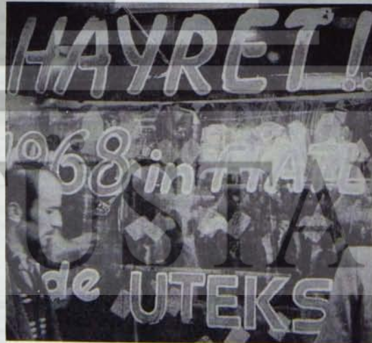
Ücret fiyat kısılcısında çalışan, halhalkta oluyor