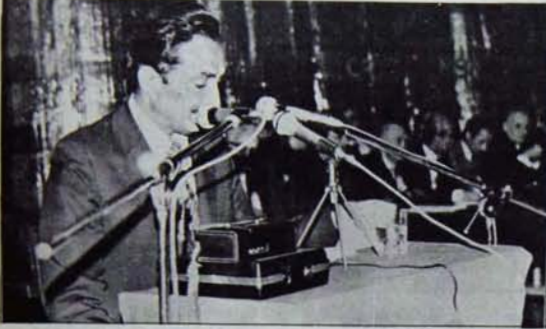
Şişirilen balonu patlatmakta geçmedi