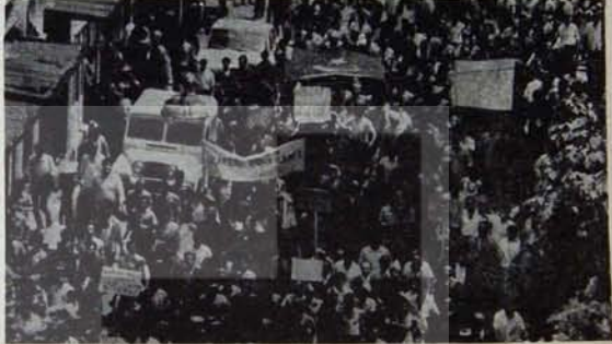
Türkiye İşçi Partisi olsa mendireklerle geçit vermezsek.