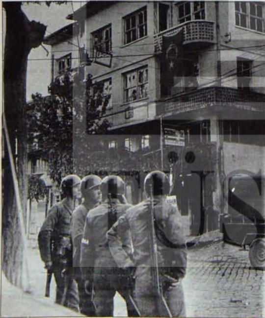
Demirci büyük tehlike atlattı

Kim bilir, belki böyle düşünmeler de vardır.