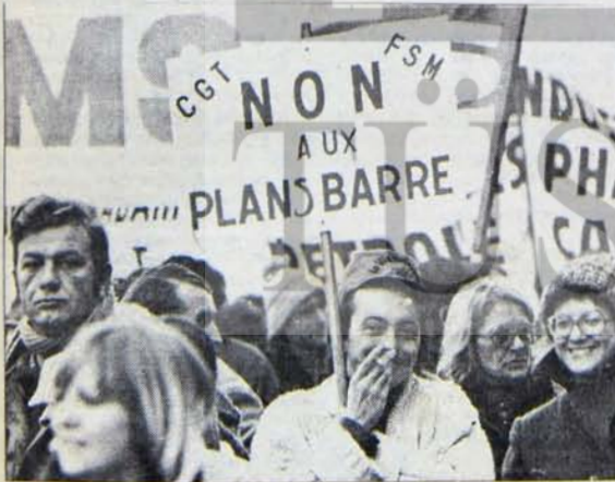
Gün, emekçi halkın tekeller iktidarına karşı soldaki güçlerin birliğini sağlamlaştırma günüdür.