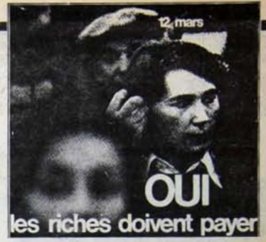
Tekeller hesap verecek.

Gerek birinci turun, gerekse ikinci turun sonuçları, Fransız emekçilerinin, solun birliğine basit bir seçim ittifakı düzeyine indirme, Ortak Program'ı özünden boşaltma girişimlerine prim vermediğini göstermiştir. Sosyalist Parti yönetiminin, Ortak Program'ın güncelleştirilmesini, karşı çıkarak FKP aleyhine güçlenme çabaları başarısız kalmıştır. Solun birliğinin temel ilkelere uzaklaştırma girişimlerinin, ancak, emekçi halkın bu girişimlerin sahiplerine karşı güvenini sarsmaya yarayabileceği belli olmuştur. Fransa'da gün, emekçi halkın tekeller iktidarına karşı mücadelesini güçlendirme, soldaki güçlerin birliğini sağlamlaştırma, Ortak Program'ın daha geniş kitlelerin elinde gerçek bir silah haline getirme günüdür.