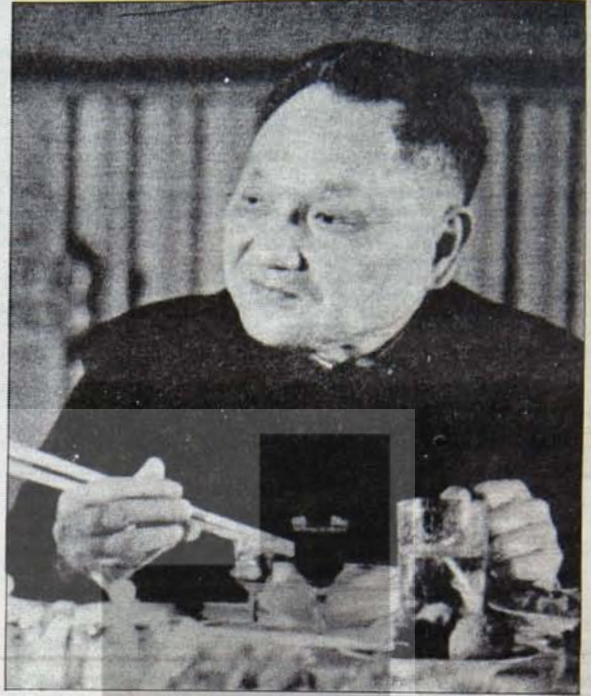
Teng Hsiao Ping'in sosyalizme karşı kutsal ittifak çağrısı: "Doğuda Çin ve Japonya batıda ABD ve Avrupa Sosyalist Birliği'ne karşı etkili mücadele vermektedir".

Mao Tse Tung'un bu "görüşünde" sınıflar ve sınıf mücadelesi, sosyalist devrimin karakteri ve itici güçleri, proletarya diktatörlüğü, sosyalizme geçiş dönemi, sınıfsız toplumun iki aşaması konusunda birçok yanlış anlayış yer almaktadır. Bu görüşün özü, proletarya diktatörlüğü koşullarında sınıf mücadelesinin keskinliğini muhafaza ettiğini, politik devrimin bitmeyecek tam tersine gitmeye kızıştığını, asıl rolünü bundan sonra oynayacağını kanıtlamaktan ibarettir.