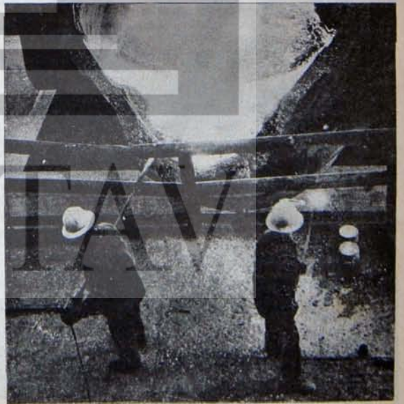
Oyunları bozacak tek güç: Bilinçli, sınıfsal işçiler

Ertesi gün okullarına giden öğrenciler, alınan kimliklerin teslim edilmeceğini ve dekanın "suçlu" olarak tespit ettiği bazı öğrencilerin okuldan uzaklaştırılacaklarını öğreniyordu. Bu, yasanın suçsuz saydığı kişilerin, dekan tarafından suçlu bulunarak cezalandırılmalarından başka bir anlam gelmiyordu. Verilecek ceza ise, öğrencilerin bir yıl kaybetmelerine yol açabilirdi. Sonuçta, göz altına alınan 60 kadar öğrenci ile dekan tarafından okuldan uzaklaştırılan 20 öğrenci polis marifeti ile okuldan çıkarıldılar. Dekan Sungur, bu öğrencilerle görüşmeye gerek bile duymamıştı.