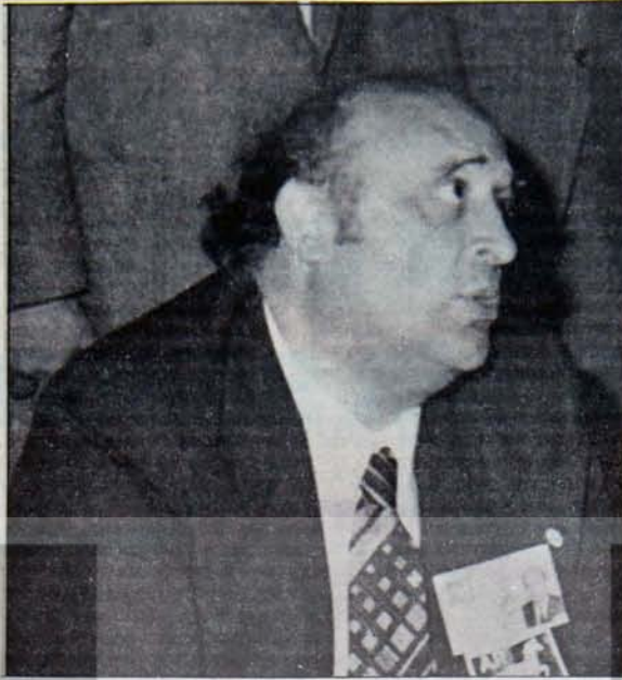
DEMIREL: Büyük sermayenin "yedek" heabı...

da ABD Başkanı Johnson'la çekilmiş fotoğrafları da mizansenin bir değişik örneğini oluşturmuştur. Demirel'in o tarihlerde cami avlularında görünmeye ihtiyacı yoktu. Devrin Cumhurbaşkanı Cemal Gürsel'den başlayan ve entellektüel kalemleri de kapsayan geniş bir destek ortamını bulmuştu.