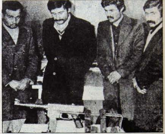
Hala mı elinizde delil yok?

Meclis Başkanına, Danıştaya ve benzeri silahlı saldırıların hangi namullardan çıkan kurşunlarla hazırlandığı bellidir. Cinayet şebekeleri silahlarıyla olduğu kadar politikaları ve ideolojileriyle de yakalanıp seçilmelidir. Gereken va-