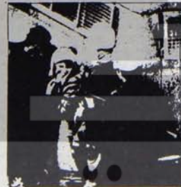
Tunus halkı baskılara boyun eğmeyecek

Emekçi halkı ezen bunalım etkilerinin başında, her geçen gün çok daha geniş yığınları, özellikle genç emekçileri kapsama alan işsizlik sorunu geliyordu. Nüfusun yarıdan fazlasının 18 yaşından küçük olduğu bir ülkede, genç yığınları için alan bir işsizlik dalgasının sonuçları bir anda bütün toplumu etkiliyordu. Öte yandan gerici İktidar ücretleri fiilen dondurmuştu. Buna karşılık fiyatların dörtlüce artışı durdurulmuyordu,