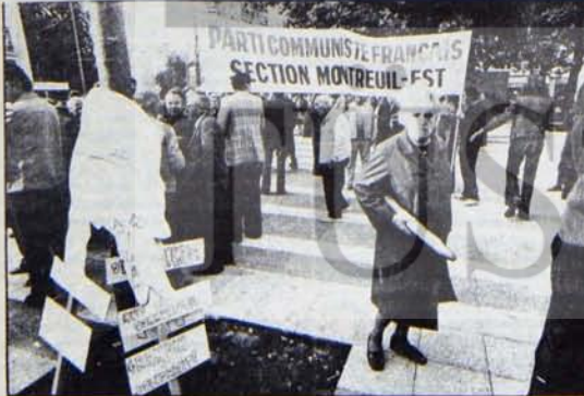
Seçim aritmetiği için değil, ilkeler için...

Fiyatlardaki değişikliklere ilişkin belirtilebilecek bir diğer konu, sözü edilen değişikliklerin geçiminde endeksinin sabit tutulmak biçimde düzenlenmesi yaşam koşullarının da buna bağlı olarak sabit kalmaması gerektiğidir. Ücret ve gelirler planlı bir yolla tüketim maliyetleri olarak artmakta olduğu için, geçiminde endeksinin sabit tutulması refah düzeyini sürekli olarak yükseltmektedir. Duyurulan son fiyat değişikliklerinin zorunlu tüketim mallarından dayanıklı tüketim mallarına doğru bir yönlendirilmesi de böyle bir gelişmenin sonucu olmaktadır.