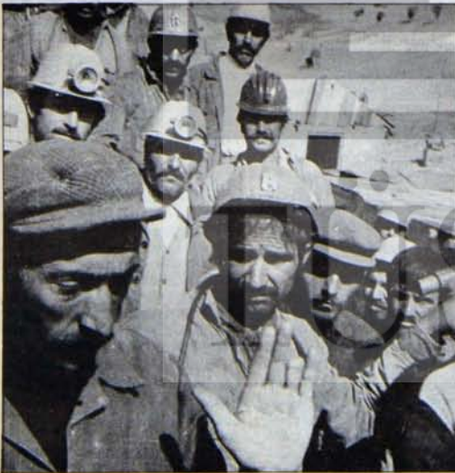
Devaliasyon yine işçi ve emekçilere vuruyor