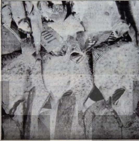
Fiyat artışlarını devalüasyon mu "durduracak"?

gelirli halkı etkilemesin! öledik, hatta halkın yararına işlemisini sağladık. Bu kez devalüasyon için de aynı şeyi yapacağımızı umuyoruz..."