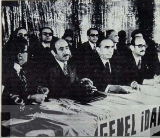
Post büyüdükçe kavga da büyüyor...

Hükümetin kurulması çalışmalarını, güvenoyu, güvensizlik ve yeni hükümet kurma çalışmalarını süresi boyunca bir ay geçmişti. MHP'li milletvekilleri birbiri ardına millet meclian başkanı, "bankaların devletleştirilmesi"ne, "işgortaların devletleştirilmesi"ne ilişkin yasa önerileri vermişlerdi. Seçim kampanyası boyunca tekelci sermayeye küfürler eden ve seçim "başarını" üzerine ilk tebrik ve kutlama mesajlarını da tekelci sermaye temsilci ve sözcülerinden alan MHP, düzenden hoşnutsuz, bilinc-