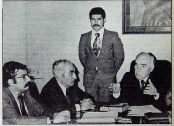
Demokratik güçler yanlışların düzeltilmesini, tutarlı olunmasını talep ediyorlar.

"Eğitim Enstitüleri'ne vereceğimiz yeni kimlikle, özel sınavlarla alınan bu