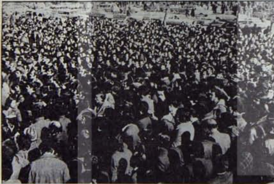
Kitleler Faşistlere verilen politik ödünün protesto ediyor.

Doğrusu Millî Eğitim Bakanı Necdet Uğur toplantı boyunca hiç rahat değildi. Alınan karara kendisinin de pek alışın-yatmadığı anlaşılıyordu. Ne var ki, hükümetin politikasını izlemeye, bu yol-daki kararları uygulamaya zorlanıyordu. Ne kadar inandırıcı olmasa da!