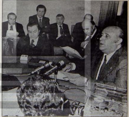
Başbakanlık ya da başbakanlığa geliş yöntemleri Ecevit'e Kontr-gerilla için söylediklerini unutturdu mu?

Mayıs 1977 tarihinde Cumhurbaşkanı'na, yazılı olarak, kontrgerillayı