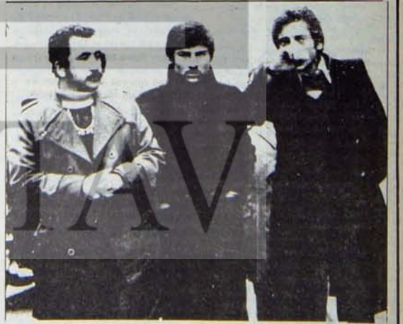
Önemli olan cinayet yuvalarının ağıtılması

Faşist cinayetler örtbas edilemez, faşistler aklanamaz. Her ne gerekçe ile olursa olsun.