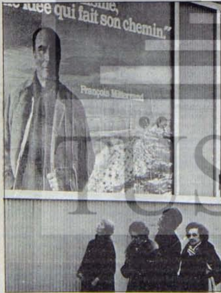
Mitterand: Tekellerin baskısına boyun eğerse, emekçilerin örgütü mücaddeleli onu da aşarak devam edecek

İtalya'nın ivedi gereksinimlerine cevap verebilecek böyle bir leri hükümet biçiminin gerçekleştirilememesi, İtalya'da yeniden antikömünizme dayanan bir hükümet deneyleri döneminin başlatılmasına anlamaya gelecektir. Hristiyan demokrat partisini, komünistlerin hükümete katılmasına karşı uzlaşmaz bir tavır alarak, yeniden koyu bir antikömünist doğrultuya çekmek isteyen güçler ilkededir. Bu güçler, hem HDP'nin yanında, gerici, faşist kanatta, hem de HDP içinde mevcuttur. Bu durumda HDP'nin içindeki güçler dengesi, hükümet bunalımının İtalya'ya önüne getirdiği yol ayırımından çıkış yönünü belirleyecektir.