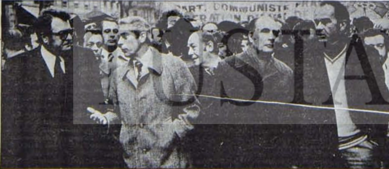
Fabre-Mitterand-Marchais: Kitleler, mücedede mızıkçılık yapanları braharak yuirimeğe devam edecekler.

Ancak, bu nitelik değişimini ranatça gerçekleştirecek uzun bir süreç söz konusu değildir. Fransa'da sol birliğin gelişmesi, halkın ve parti militanlarının ortak programa olan inanç ve bağlılıklarının artması, ve sosyalist partinin ortak programı geri plana itme, birliği sadece bir seçim ittifakı olarak ele alma eğilimi