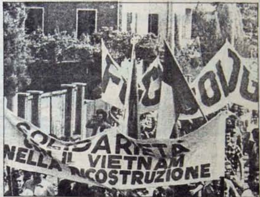
Emperyalist müdahale mücadeleyi geriletmemeyek

İtalya'da hükümet bunalımının doğmasıyla başlayan politik gelişmeler, ülkedeki demokratik süreçte karşı birleşen güçlerin niteliğini açıklıkla ortaya koydu. ABD Dışişleri Bakanlığının, İtalya'da komünistlerin hükümete katılmasına karşı olduğunu açıklamasından sonra, İtalyan patronların örgütü Confindustria ile Vatikan'ın sözcüleri de aynı yönde açıklamalarda bulundular.