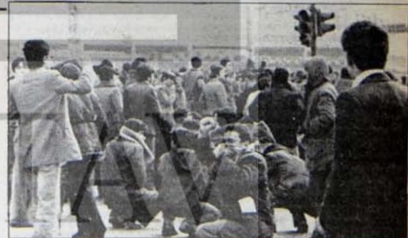
Faşist Gösteriler: Kimden cesaret alıyorlar!

Öğrencilere gelince, tüm öğrencilerin okulla ilişkisini kesmek her bakımdan yanlış olur. Bu öğrenciler arasında komando ve ülkücü olanların derhal okuldan uzaklaştırılması mutlaka gerçekleştirilmelidir. Ama bunun dışında her zaman demokrasi saflarına kazanılabilecek olan ve çoğunluğu yoksul ve orta halli ailelerden gelen büyük öğrenci kütlesinin eğitimlerinin devamı mutlaka sağlanmalıdır. Bunlar bilfiş ve kararlı bir politika ile mürasi mücadelesine kazanılmalıdır.