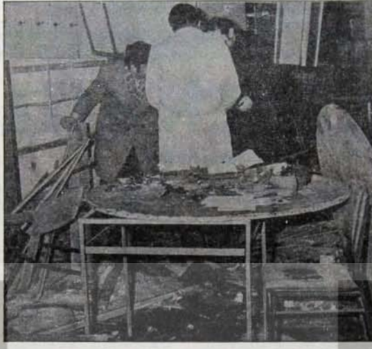
"Ülkücü" akdrların hesabı kapatılmaz!...

AP Genel Başkanının Başbakan Ecevit'e yönelik bir sinir harbini de ihmal etmediği gözleniyordu. Ecevit'in kendi-