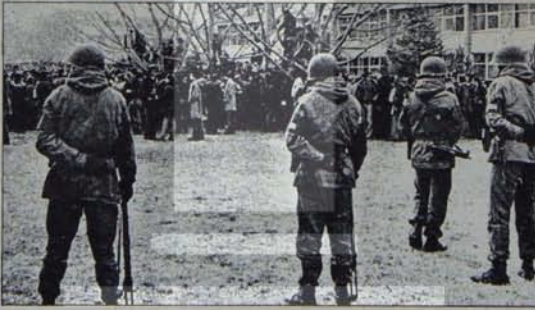
ODTÜ'de sindirme çabaları boşa çıkarılacak

ODTÜ işçilerinin ekonomik-demokratik mücadelesinin bugünkü konuma gelmesinin ikinci yönü teknik yön kadar önemli. Önemli oluşunun da birkaç yanırı. Birinci yanı ODTÜ işçilerinin yıllardır içinde bulunduğu işyeri sendikacılığı ve bu sendikacılığın açmazlarından kurtulmak için vereceği mücadelede deneyiz oluşu. İkincisi, bu mücadelenin yetki safnasına ulaşmasından sonra ODTÜ'nün faşist güçlerce tam anlamıyla işgal edilmiş olması. Üçüncüsü, yetkinin kesilmesi nedeniyle kadar sendikal işleyişin yürütülmesinde örgütlenilmesini sağlanamaması.