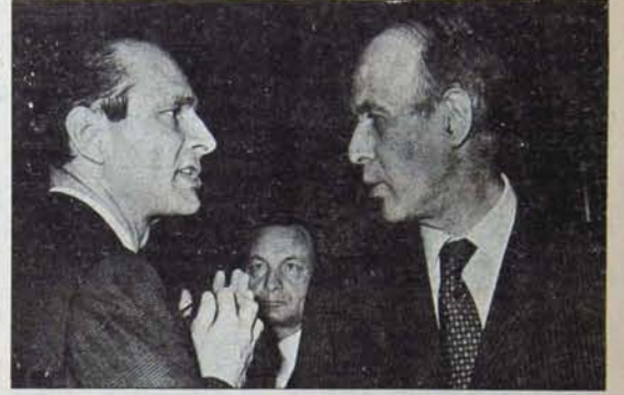
Chirac-Giscard: Son sığınaktaki anti-komünist demogoji ve seçim hileleri

Öte yandan soyut özgürlük teması da gitgide egemenliğini yitiriyordu. "Hürriyet düşmanlığı" ile suçlananlar, düzenin özgürlüğü nasıl kastediğini, yapısı itibarıyla tekelci kapitalizmin bir baskı düzeni olmanın kurtulamayacağına gösteriyorlardı. Fransa işçi sınıfının politik örgütü ise, gerçek özgürlük değerlerine bağlılığını ortaya koymak için geniş bir propaganda sürdürüyor ve başanlı oluyor.