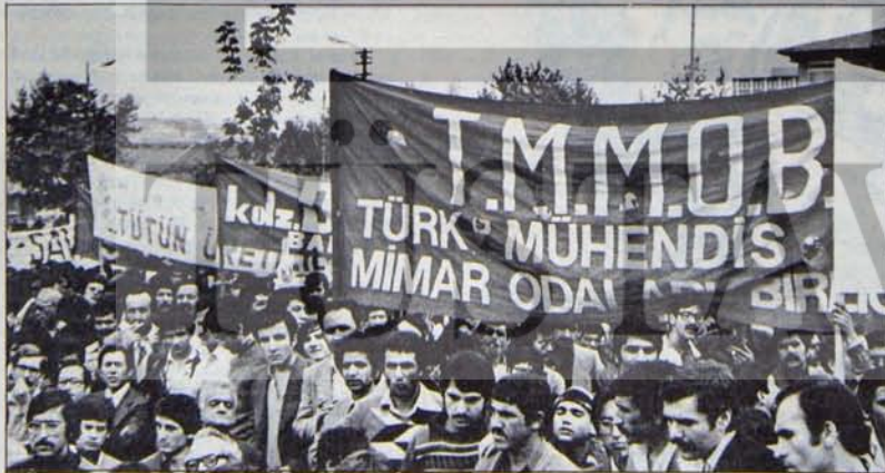
Demokrasi güçleri, iktidardan titiz denetçileridir

İşçi sınıfının ve demokratik güçlerin bugünkü hükümete karşı tavırları ise bununla farkedilir. İşçi sınıfı ve demokratik güçler, bu hükümeti emekçi halkın acil anti-faşist, ekonomik ve demokratik talepleri karşısındaki sorumluluklarından temizleme girişimlerine kesinlikle karşı çıkacaklardır. İşçi sınıfı ve demokratik güçler, sadece büyük sermayenin yeni hükümet ve CHP üzerindeki hesaplarını açığa çıkarmakla kalmayacaklardır. Bir yandan bu görevi sürdürürken, diğer yandan MC partilerinin kurmayaya çalıştığı, çalışan yığınların anti-faşist taleplerinin doğrultusunu bugünkü hükümetin üzerinden uzaklaştırma tuzağına da bozacaklardır. Tam tersine işçi sınıfı hareketi, yeni hükümetin ve CHP'nin, emekçi kitleler karşısındaki sorumluluktan kurtulma, demokratik toplu-