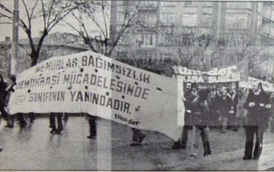
Rehavet değil, mücadele dönemi

İşçi sınıfı hareketinin sosyal demokrat hükümetlere ya da sosyal demokrat partilerin burjuva partileriyle kurdukları koalisyona hükümetlerine karşı tutumu.