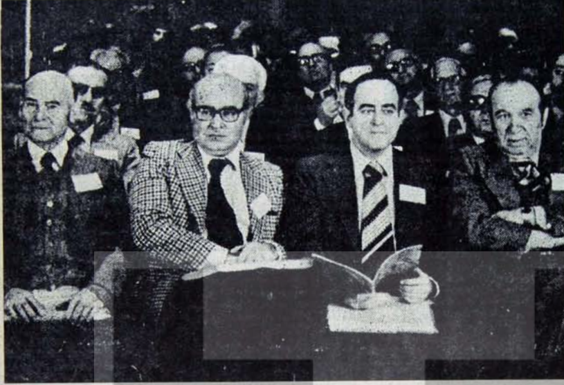
"Önder sanayiciler": Güçlerini iyi biliyorlar

ÖNCEKİ HAFTA CUMARTESİ GÜNÜ TÜRKİYE'NİN "ETKİN" İŞVEREN KURULUŞLARINDAN TUSİAD'IN KONGRESİ YAPILDI. KONGRENİN CEREBANLI, TÜRKİYE'NİN "SEÇKİN" İŞVERENLERİNİN VE "ÖNDER" SANAYİCİLERİNİN DEMOKRASİ ANLAYIŞLARININ VECİZ BİR GÖSTERGESİ OLDU.