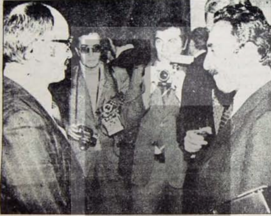
Büyük sermaye-Ecevit: Lüğhâler zamanla somutlaşacak

Günden güne bilinci bir örgütlenme dinamiği yaşayan işçi sınıfının politik hareketinin sermaye sınıfına dayattığı taleplerin maddi temellerini gördenen, Berker ve Koç'un parantezi sözlerini fazla abartılmak gerekmezdir. Aksi halde ister istemez pratikte de gözlem-