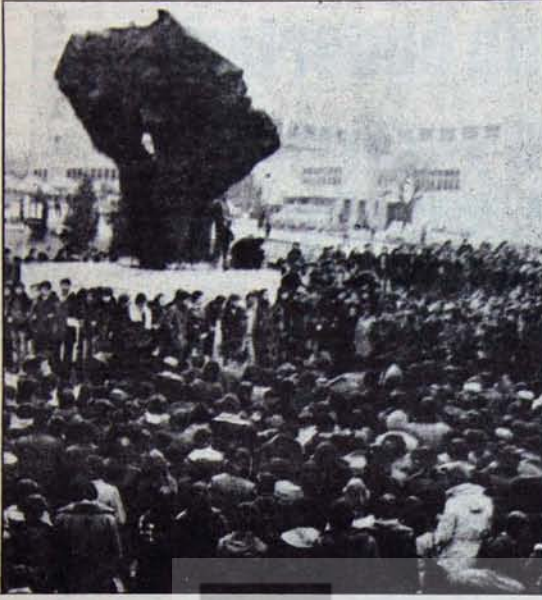
Saldırı olayları: "Tuzak"lara dikkat edilmeli...

lenen bir yanışa düşmek istenmediği: "Eh canım, artık bunlar da böyle söyledikten sonra şunun şuanında ne kaldı?"