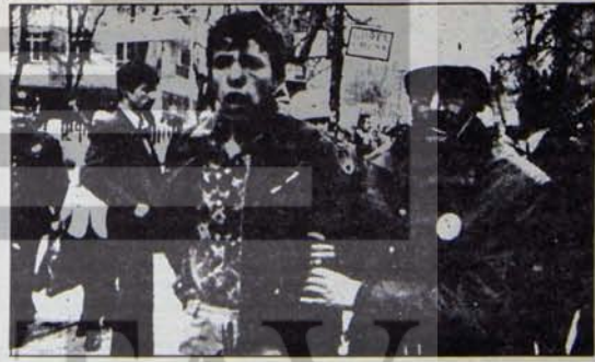
Demokratik güçler "uyuşturulamaz"

Kafayı sokacak kum arayanlar, bir müddet sonra kafalarını çarpacak kayalar aralar. O zaman "zamanı mı?" demek de çare olmaz.