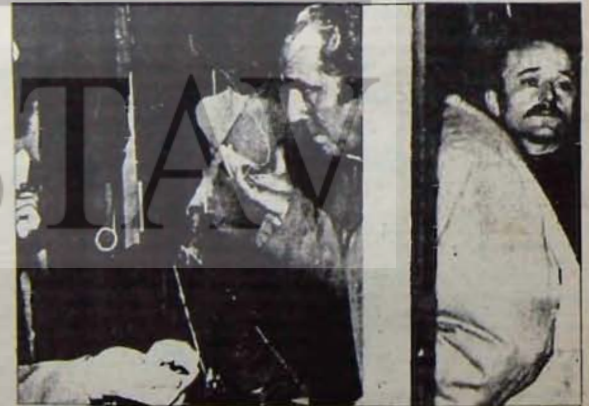
TMMOB'yi Hedef Alan Provokasyondan Sonra

Ama faşizm öyle engeldize turandırmayacak. Artık kıyımlar sessizlikle gerçekleştirilemeyecek. Tepkiler kitlesel olacaktır. Mutlaka yantımları alınacak. Demokratik toplumsal muhalefet seçimlerden de aldığı hızla sağlam adimlarla faşizmin üstüne yürüyecek ve mutlaka zafer işçi, emekçi sınıfların ve onların örgütlü gücünün olacak.