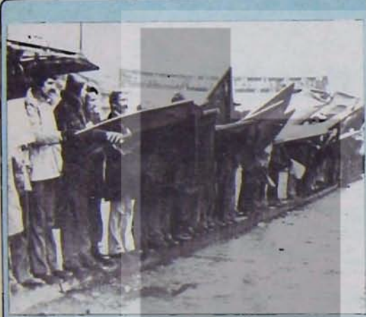
ORGUT BİLİNCİNE VARABİLMEK, ÖRGÜTÜN ANLAMINI KAVRAYABİLMEK SOSYALİZME ULAŞABİLMEDE EN ÖNEMLİ UNSURLARDAN BİRİ. ÖRGÜT BİLİNCİ VE DISİPLİNİ, BUGÜNÜN MUCADELESİNDE, YARDIMIN SOSYALİZMİ KURMA UĞRAŞINDA EN BELİRLEYİCİ FAKTÖRLERDEN BİRİ.

Yine de eldeki bilgilerden hareketle belirli bir sonuca ulaşmak mümkün. Bu sonuç, 11 Aralık seçimlerinde tüm sermaye partilerinin gerilediğine işaret ediyor. Katılma oranının bugüne kadar hiçbir yerel seçimle kıyaslanamayacak ölçüde düşük olması, sermaye partilerinin, ellerindeki geniş olanaklara, yığınlara ulaşma araçlarına rağmen, seçmenleri sandık başına götüremediklerini gösteriyor. Seçmeni sandık başına götürememek tek başına bir gösterge.