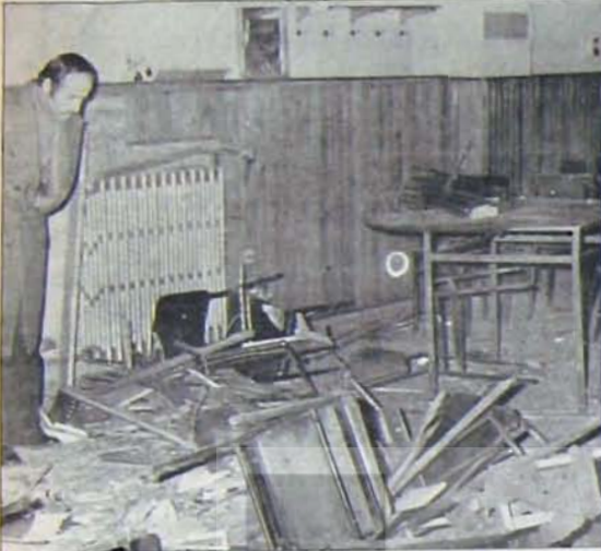
Faşist Saldırıların Sonucunu: İnsanlık Dışı Olay

15 Aralık Çarşamba günü 19.00 'da berlerinde spiker, CHP Genel Başkanı'nın son demecini aktarıyordu. Demek Ankara'daki hava kirliliğinin ulaştığı boyutları ve bunun halk sağlığı üzerindeki olumsuz yansımalarını anlatıyordu.