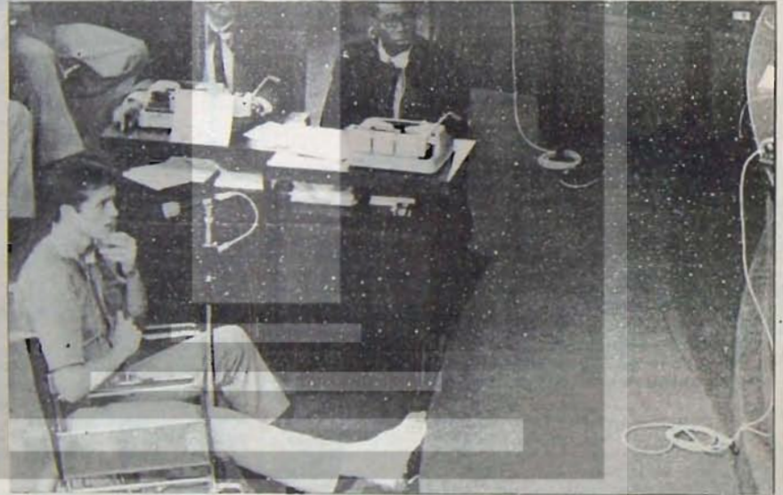
Angola'da Paralı Asaheler Yargılanıyor: Yargılanan Emperyalizm

ülkelerine itiraz etmesini önlemeye yönelik ortak talepler belirlemiştir. Uluslararası düzeyde bu gelişim ve Afrika ülkelerindeki iç toplumsal gelişmeler, bu ülkeler arasında politik farklılaşmayı da giderek bizlandırakta, taraflar kesin yerlerini almaya istemektedirler. Böylelikle, emperyalizmin egemenliğine, yağmasına son vererek, ulusal egemenlik ve sosyal ilerleme yönünde girişimde bulunularak, ülkelerinin geleceğini emperyalist sisteme daha sıkı bağlayıp, halklarını tekelci kapitalizmin sömürsüne açan ülkeler arasında ayrışıklık tıvıca retleşmektedir.