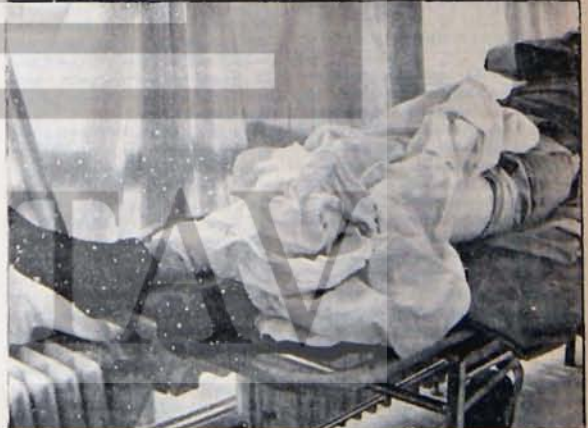
ADMMGA Öğrencileri Demokratik Güçleri Arkalarında Bulacaklar

Cem razı olur mu, olmaz mı? "İşçi sınıfı" gazetesinin başyazarı İsmail Cem'in "işçi sınıfı" adına Cüneyt Arcayürek'in Genel Müdürlüğüne razı olmasını sağlamak gerekecek. Her halde zor olmayacak.