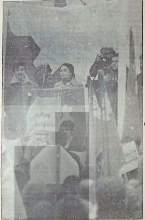
Organizasyon Çalışmaları Üzerinde Durulmaktadır

Eğer ortada bir mizanzen kurulmuşsa, geride kalanlar, dere kenarına yığılan molozlar, birlikte kaybettikleri sınıf adına bu mizanzeneye uygun konuşur, uygun