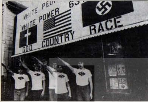
Sapık bir düşüncenin peşinde, beyinleri yıkanmış...

ABD'deki yeni Nazi örgütlerin yaygınlaşabilmesi için, son zamanlarda yoğunlaştırılan Hitler reklamcılığından büyük ölçüde yararlandıklarını, kendi sözcüleri bile ortaya koyuyor. Hitler'i ve Alman Nazizmini sevimlileştirmeyi amaçlayan kampanya uzun süredir Avrupa ülkelerinin sınırları aşarak ABD'ye yayılmış durumda. Bu da yeni Nazi örgütlerinin gelişmesinin, söz konusu Hitler reklamcılığı kampanyasını başlatan güçlerin insiyatifinden bağımsız olmadığını gösteriyor.