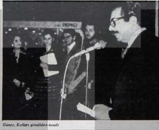
Güner, Kolları şimdiden svadı

niyor. Bu örgütün, vurucu güçleri ve bunların yaptıkları hakkında da elde yeterli bilgi var. Yine de bütün bunların yanısıra, MHP'nin ellerindeki devlet kurumlarında, bakanlıklarda "sermayeyi disiplin altına alma" yolunda bugünden başlattığı girişimler üzerinde de dikkatle durmak gerekiyor.