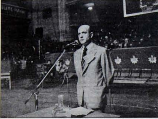
Sargin: Siyasi şantaja hayır.

CHP'nin "hayır" işlerine de ciddi olarak eğildiğini gösteriyordu. Artık mezarından başını kaldıran İsmet Paşa da, partisini tanımayacak.