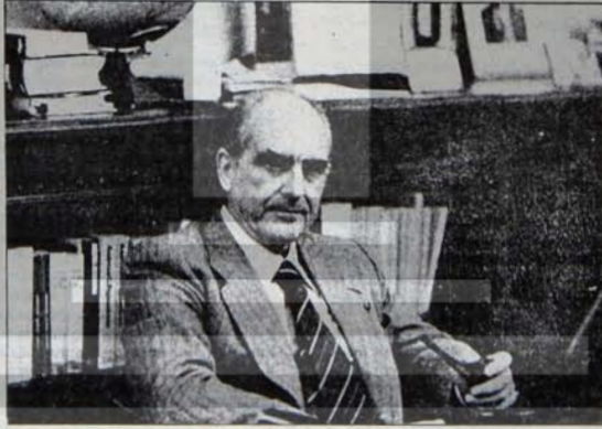
Gelecekteki çizgisini sınıf mücahadesi belirleyecek

Hiçbir toplumsal ve politik olayın sonuçları tek yönlü değildir. Hele iç poli-