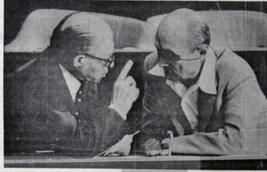
Begin, Sedat'ın yolunu bekliyor; Hedef: Emperyalizmin çıkarında birleşmek.

Geçtiğimiz hafta Ortadoğu'da yeni gelişmeler oldu. İsrail başbakanı Begin Mısır Devlet Başkanı Sedat'ı resmi olarak Kudüs'e çağırdı ve Begin'in bu daveti Sedat tarafından kabul edildi. Sedat'ın Kudüs'e gitme kararı ilericî dünya ve Arap kamuoyunda geniş tepkilere yol açarken, Mısır Devlet Başkanı Şam'a hareket ederek Suriye İlderi Esat'la görüşmelere başladı. Sedat'ın Esat'la görüşmesinin, Kudüs'e gitme kararının tepkilerini yumuşatmaya yönelik olduğu ileri sürülmüştü. Bu görüşmelerin anlaşmazlıkla sonuçlandığı ortaya çıktığı sıralarda İsrail'den yapılan bir açıklamayla Sedat'ın 19 Kasım'da ziyareti gerçekleştireceği duyuruldu.