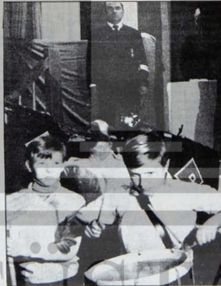
Genç yaşta beyinler yitiliyor

Federal Almanya'da yayımlı ve ilhakçı eğilimlerin geliştirilmesinde neo-nazi partinin yalnız olmadığı görülüyor,