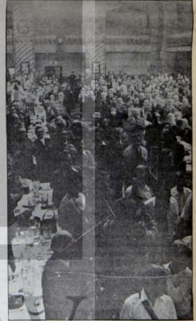
Hitler de birahanelerde başlamıştır

Federal Almanya'daki ve Avusturya'daki ilhakçı ve pan-germanist çevrelerin