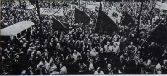
Kapitalist ülkelerin üstesinden gelemedikleri bunalm, hitleleri ayağa kaldırıyor

Kapitalist dünya ekonomisinin yeni bir depresyona doğru ilerlediği görüşü giderek yaygınlaşmaktadır. Birleşmiş Milletler Avrupa Ekonomik Komisyonu'nun her yıl hazırladığı "Avrupa Ekonomisinin Durumu" raporu geçtiğimiz hafta yayınlandı. Raporda Avrupa ekonomisi hakkında verilen bilgiler, 1974-75 yıllarında yaşanan depresyonda çıkılması umutlarının yeniden zayıfladığını, hatta yeni bir depresyonun ufukta gözüktüğünü doğrulamaktadır. BM Avrupa Ekonomik Komisyonu'nun Raporunda 1977 başlarında görülen canlanma belirtilerinin kısa ömürlü olduğu belirtiliyor. Rapora göre 1976'nın son üç ayında ve 1977'nin ilk üç ayında büyük artış gösteren sanayi üretimi, 1977'nin ikinci üç ayından itibaren düşmeye başlamıştır. 1977 yaz aylarında