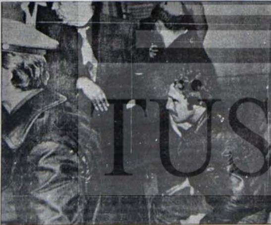
Kapitalist düzenin olağan 'sanık'larından

Özgür İnsan'ın, Eylül sayısında Frankfurter Allgemeine Zeitung'dan alarak yayınladığı antikomünist karikatürler üzerine, aynı gazetede Harald Vocke imzası ile Türkiye hakkında yayımlanmış açık MHP yanlısı faşizan bir yazıyı çevirip, Özgür İnsan okuyucusunun karşılaştırmasına olanak sağlamak bakımından yayınlaması dilediği ile dergi yönetimine göndermişim. Ama "demokratik sol yönde bir tartışma forumu oluşturmayı benimsediği"ni, cevap yazısında da tekrarlayan Özgür İnsan, antikomünist karikatürlerini yayınladı.