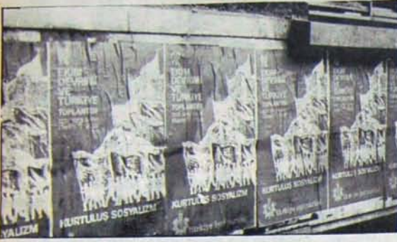
Tüm baskılar ve engellemeler kampanyayı durduramadı.

Türkiye İşçi Partisi'nin 6 Kasım Pazartesi günü İstanbul Spor ve Sergi Sarayında düzenlenen "Ekim Devrimi ve Türkiye" toplantısı ile ilgili aşışları asan 98 parti üyesi, 30 Ekim gecesi gözaltına alındı. Tomsonlarla itile kâkila 2. Şubeye götürülen partililer, burada falakaya yatırıldı. Falaka işlemleri uygulanırken bir kısmının göğüsleri üzerinde tepnildi. Daha sonra tuzlu suda yürütülen üyeler çeşitli küfür ve hakaretlere maruz kaldılar. Bu arada "cop sokma" tehditleri savurmaktan da geri durulmadı. Ertesi gün serbest bırakıldıkları saat 17.00'ye kadar partililerden 9'u elleri kelepçeli olarak şehir içinde ordan oraya dolaştrıldı. Aynı gün 26'sının işkence gördüğü adli tabip raporuyula saptandı.