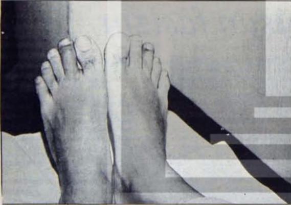
Gerici güçlerin saldırıları yoğunlaşıyor

Türkiye'de gerici güçler, işçi sınıfına ve demokratik güçlerine karşı saldırılarında, belki, hâlâ ayakta durmaya çalışan gerici, faşist rejimleri örnek alıp kendilerine cesaret takviyesi vermektedirler. Ama böyle takviyeler boşunadır. İşçi sınıfının ve demokrasî güçlerinin mücadelesi, dünya ölçüsünde, ayakta durmaya çalışmak bir yana, her geçen gün daha da sağlamlaşan bir örneğe dayanmaktadır. Sömürüyü ortadan kaldıran ve insan toplumunun gelişmesinin önündeki bütün engelleri temizleyen bir sistem örneğidir, bu. Dünyanın üçte birinde başarıya ulaşmış olan bu sistem, sosyalizm, gericiliğin her türlü çabasına bozguna uğratarak bütün dünyada ilerlemektedir. Ekim Sosyalist Devrimi'nin 60. Yılı, işçi sınıfının ve emekçi kitlelerin nihai zafelerini önlemeye hiçbir gücün yetmeyeceğini, tarihten silinemeyecek en güçlü kanıttır.