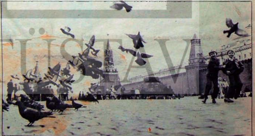
Gelişmiş sosyalist toplumun inşasında güçlü adimler

Dünya emperyalizminin SSCB'ye ve öteki sosyalist ülkelere yapacağı saldırı baskısı rağmen, bu ülkelerdeki kitlelerin yaşam koşulları nicelik ve nitelik bakımından sürekli olarak iyileşiyor, bu insanlar, ekonomik ve toplumsal yaşantının tüm alanlarına giderek daha aktif biçimde katılıyorlar.