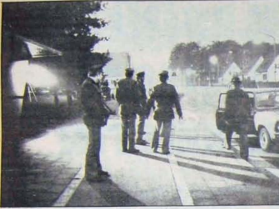
"Anarşizmin önlenmesi" bahanesi ile baskı ve terör