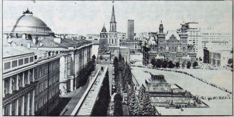
60. Yıl tüm insanlığa kutlu olsun

Ekim Devrimi'ni başarıya ulaştıran bilimsel sosyalist strateji ve taktik ilkeleri arasında, Lenin'in sosyalist devrim teorisi büyük bir yer tutar. Lenin'in, emperyalizm çağının koşullarını çözümleyerek ve dünya işçi sınıfı hareketinin deneyimlerini genişleterek geliştirdiği sosyalist devrim teorisi, uzun yıllar, bilimsel sosyalizm ile oportünizm arasındaki mücadelenin odak noktalarından biri olmuştur. Rusya'da menşeviklerin, sosyalist-devrimcilerin, Troçkistlerin devrim sorununa yaklaşımları, iktidarı alan işçi sınıfının ve