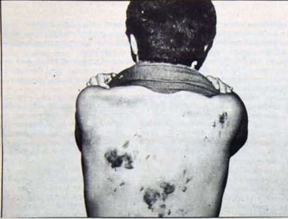
İşçence gören bir partinin durumu

Karanlık da, karanlığın kovboyları da çıktıkları yere geri dönecekler. Başka yolu yok.