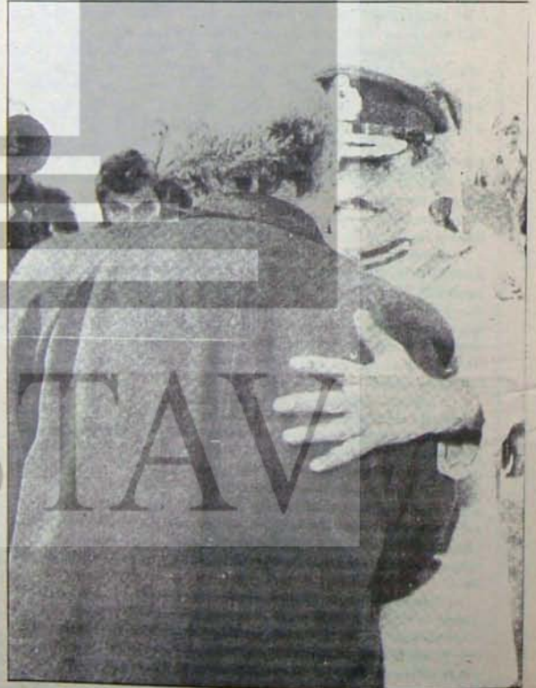
Bu ziyarette hangi hikmet var?

Kontenjan senatörlüğü aslanını yüreğinde taşıyan adayların bundan sonraki tavırlarını belirlemeleri için iyi bir fırsat. Anti-demokratik olmak ve bunu açıkça savunmak, her zaman olmasa bile, kontenjandan senatör olmayı garantiliyor galiba.