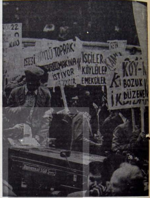
ZAMLAR HALKA KARŞIDIR

Geçtiğimiz Çarşamba günü Cumhuriyetin ilk yıllarında, batıllaşma adı altında, balaların verildiği Ankara Palas'ın