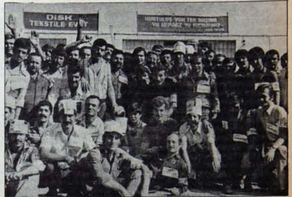
TABAN DISK İLKELERİNE SAHİP ÇIKACAKTIR