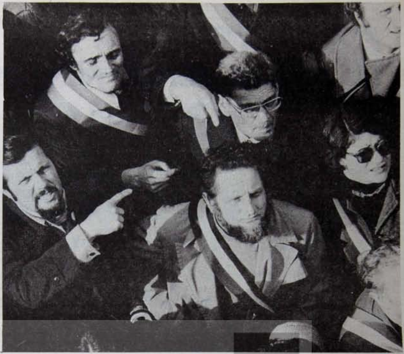
Sınırlı olanakları aşmak için birlikte mücadele

* Bu, çok kapsamlı bir soru. Birkaç sözcük ile cevaplandırmaya çalışırsak, herşeyden önce, Paris gibi