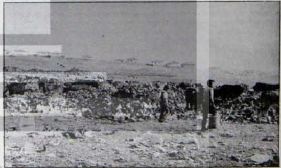
Kapitalizmin insanlığı mahkum ettiği ortam

Arada sırada doğanın yağmalanmasından ve kirlenmesinden başsorumlu olan sermayedarların çetenlik dişi "Çev-