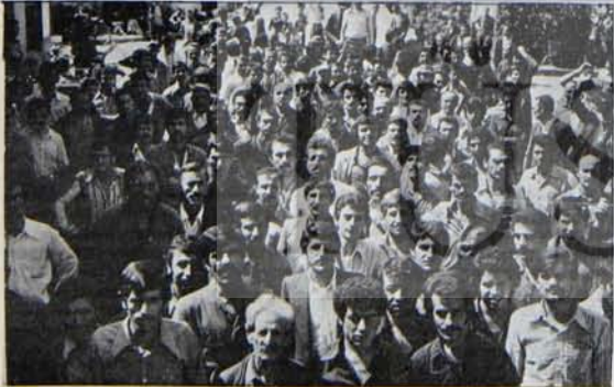
Sümerbank işçileri Teksif'in gerçek yüzünü görüldü.

gerek duyulmamış, kendisi serbest bırakılmıştır.