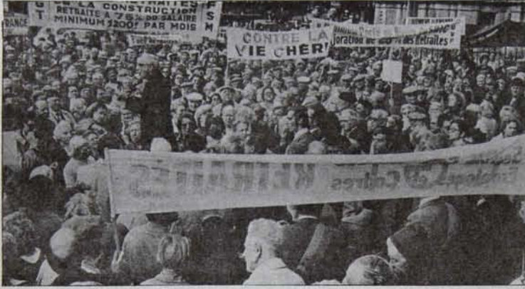
Yerel seçimler Fransa'da büyük önem taşır.