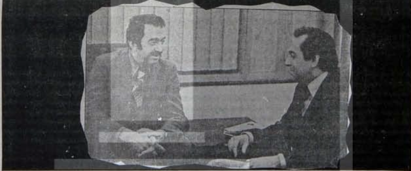
Temelde ayrıldıkları nokta yok

ret açığımız azalmaz, artar. Aldığımız kredileri bu dengesizliği ortadan kaldıracak bir biçimde kullanmamalıyız.. Bir cümlede böyle söyleniyor, biraz ilerde İMF'in İngiltere ve İtalya'da verdiği kredilerde öne sürdüğü koşulları hatırlatıyor. YÜRÜYÜŞ, geçen sayısında bu koşulları özetlemişti. Kısaça, toplumsal harcamaların kısılması ve ücretlerin dondurulmasına yönelik. Bir yerde, söylenenin eleştirisi amacıyla söylendiğinden kuşku duymuyoruz. Yalnız, aradaki bağı kuramamayı, dikkatsizlik olarak değil kasit olarak değerlendirmek gerektiğine inanıyoruz.