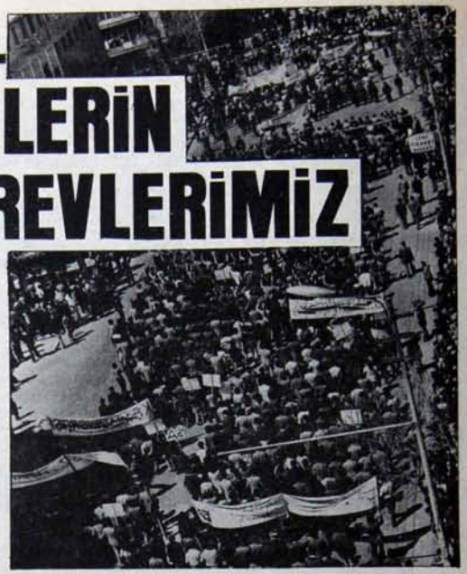
Demokratik güçlerin birliği : Faşizme karşı hayati zorunluluk

Askerlik yapmak istemeyenlerin ne kadar çok olacağı düşünülürse, kısa vadede Fransız Komünist Partisi'nin bu öneriye karşı çıkışının ne denli güç olacağı açıkça görülür. Ancak Fransa işçi sınıfı hareketi, bugün yüzbinlerce kişiyi, hatta kendi taraftarlarını etkileyen bu önerinin burjuvazi için taşıdığı önemi görmekte ve yarın doğacak felaketlerin önlemini ertelemekten almaktadır. Bu somut durumda, Mitterrand ve sosyal demokrat hareket yine "yanılmaktadır".