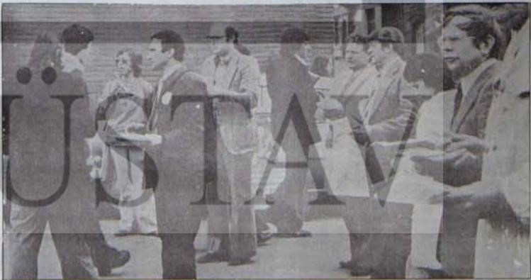
Her birlikte halkın mutluluğu için

* Önemli bir deneyim geçirdik. Kazanmak için birlik gerekir. Birlik içinse somut, açık bir program. Paris için açık, somut bir program oluşturduk ve bu program kazanımlarımızda rol oynadı. Bizlerin nihai zaferi kazanmamızı engelleyen, belki de, ortaklarımızın başlangıçta, seçmenlerin kendilerine daha önceki seçimlerde verdiklerinden daha fazla sandalye talep etmeleri oldu. Doğal olarak, bizler de "Değişim" in gerçek ve sürekli olmasının en iyi güvencesi olan Komünist Parti'ne düşen yere saygı gösterilmesi için mücadele etmek zorunda kaldık. Ortaklarımız, bu hakkımızı tanımak zorunda kaldılar. Ancak, ortak bir mücadelede çok önem taşıyan, aylarca zaman yitirdik. Çok yazık... Bu, belki de Sol'a çok pahalıya mal oldu. Ama, Sol için daha pahalıya gelebilecek bir olgu daha vardı. Eğer, Komünist Parti'si her ne pahasına birlik için açık olmayan bir program kabul etse idi, ya da kendisine düşen yeri bırakmaya yanaşsa idi, sanıyorum ama, belki de günlük, geçici bir ilerleme kaydedebilirdik yalnız, orta ve uzun dönemde mutlaka bir gerileme olurdu.