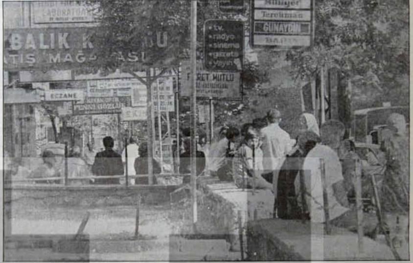
yoksulluk, yokluk, baskı...

Oysa açıklanan zamlar hayatın her alanını tepeden tırnağa etkiliyor ve zam esasları ikinci, üçüncü türleriyle hayatın