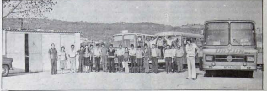
ER-KO işçileri haklı mücadelelerinde zafere ulaşacak

ER-KO, işçili taşınacılığını bir yandan da taşınacılık şirketlerinden günlük 850 liraya otobüs de kiralanıyor. İşçiler, grevin başlaması ile birlikte bütün